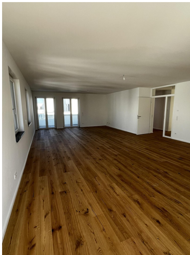
Wohnzimmer + Küche