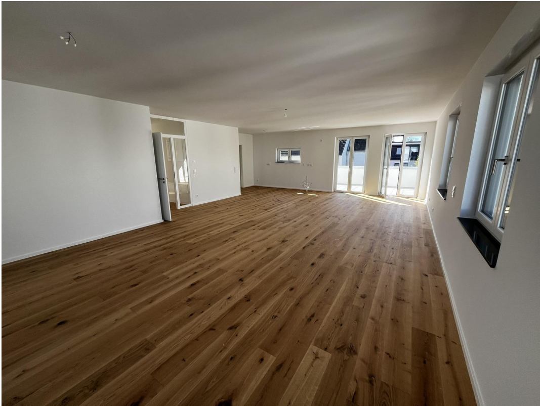
Wohnzimmer + Küche