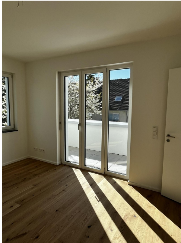
Schlafzimmer 1 mit Ausblick