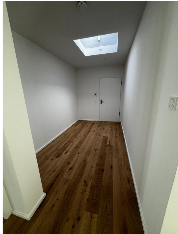
Eingangshflur mit Lichtkuppe