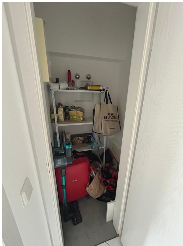
Abstellraum in der Wohnung