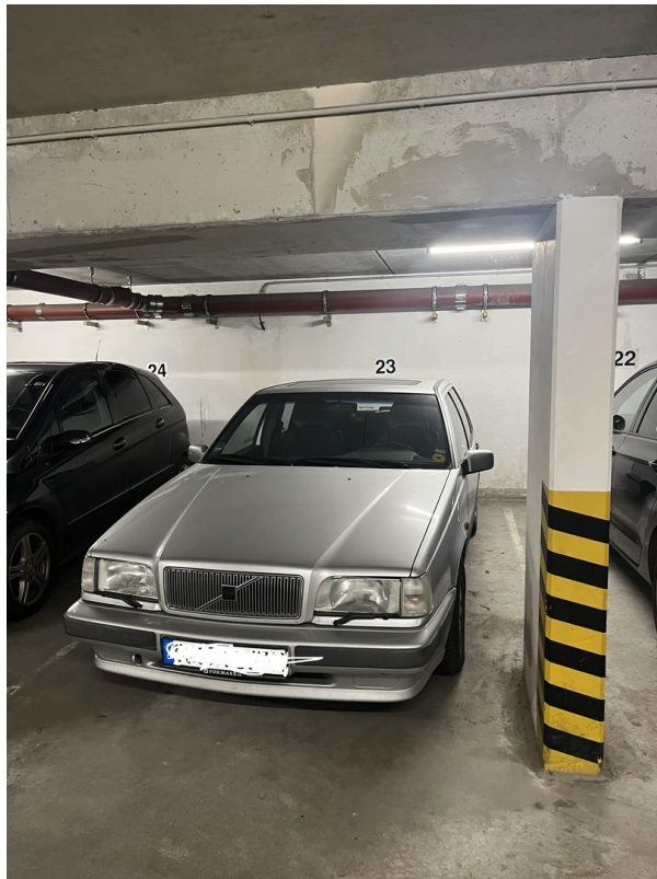
Stellplatz in der Tiefgarage