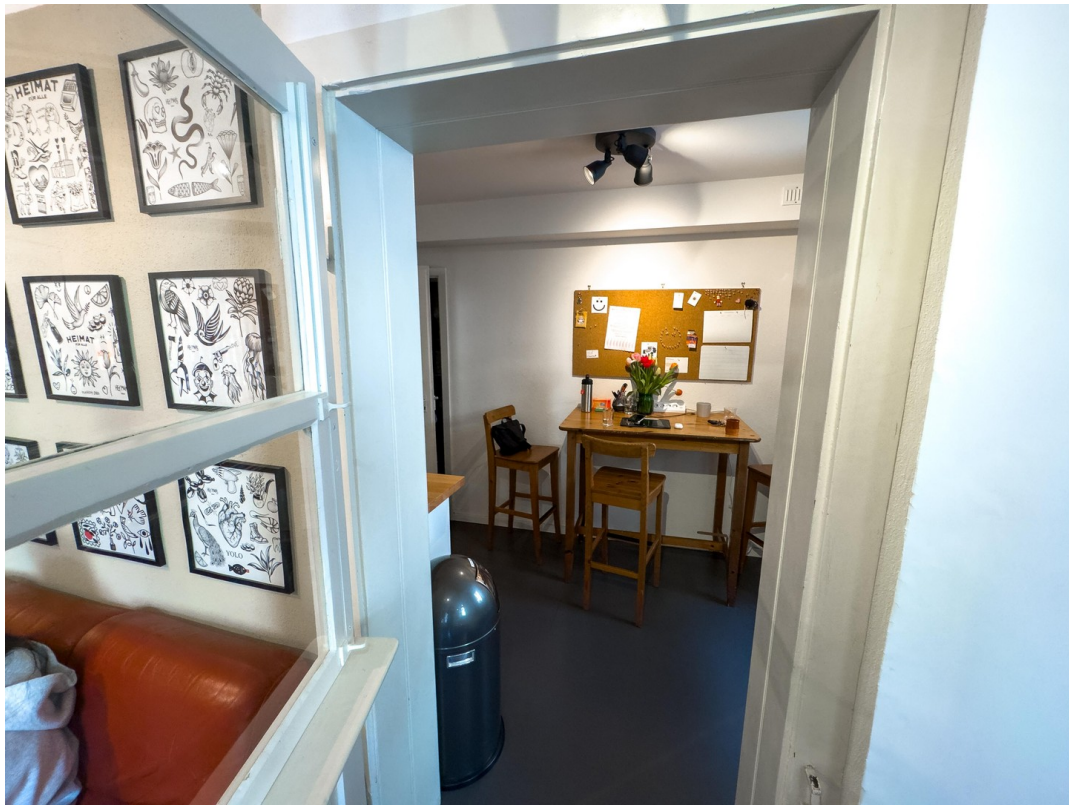
Zugang zu Küche