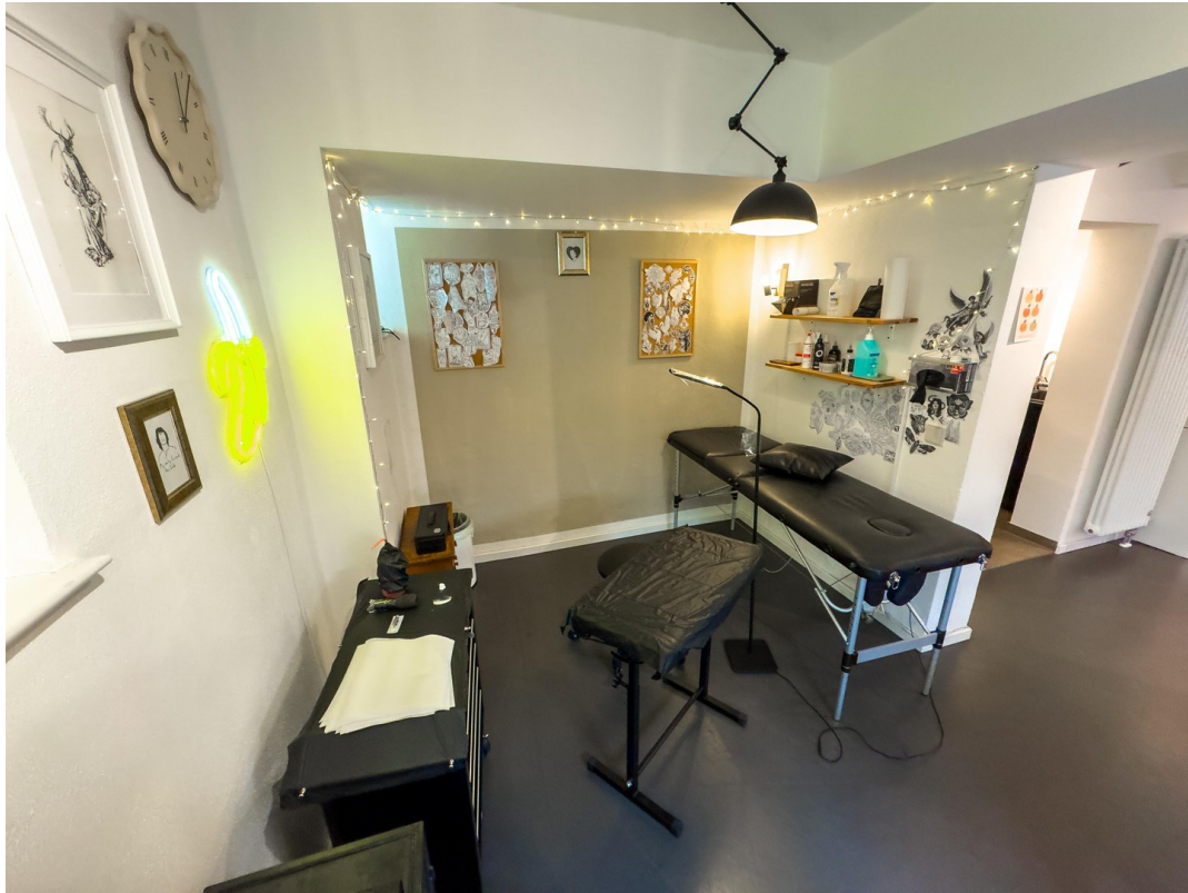
Studio Hinten Erker