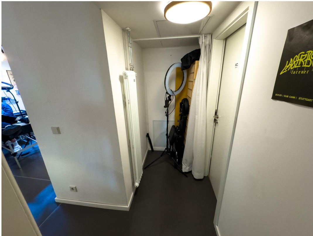
Flur zum Bad