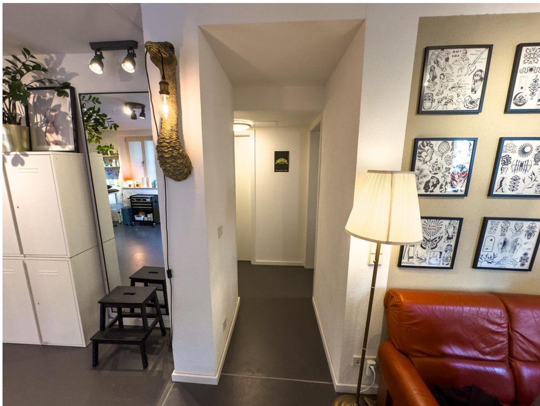
Flur zum Bad