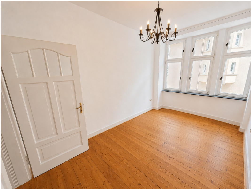
Zimmer 2 (Boden saniert)