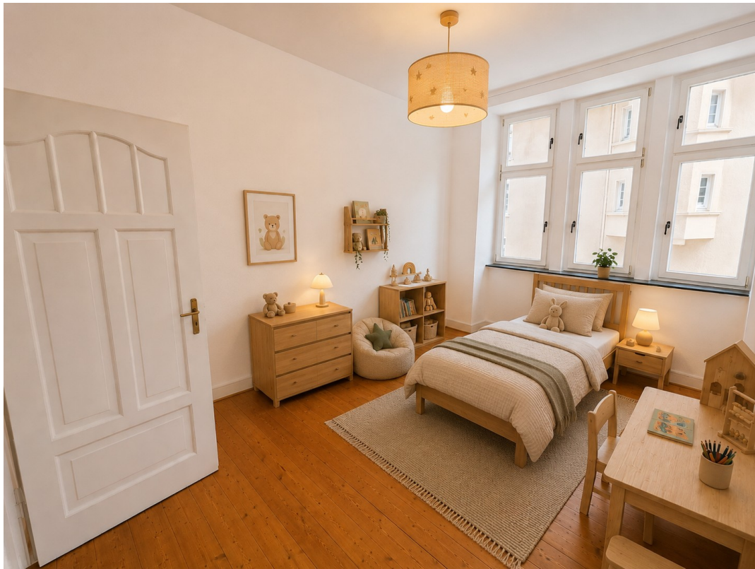
Kinderzimmer (KI möbliert)