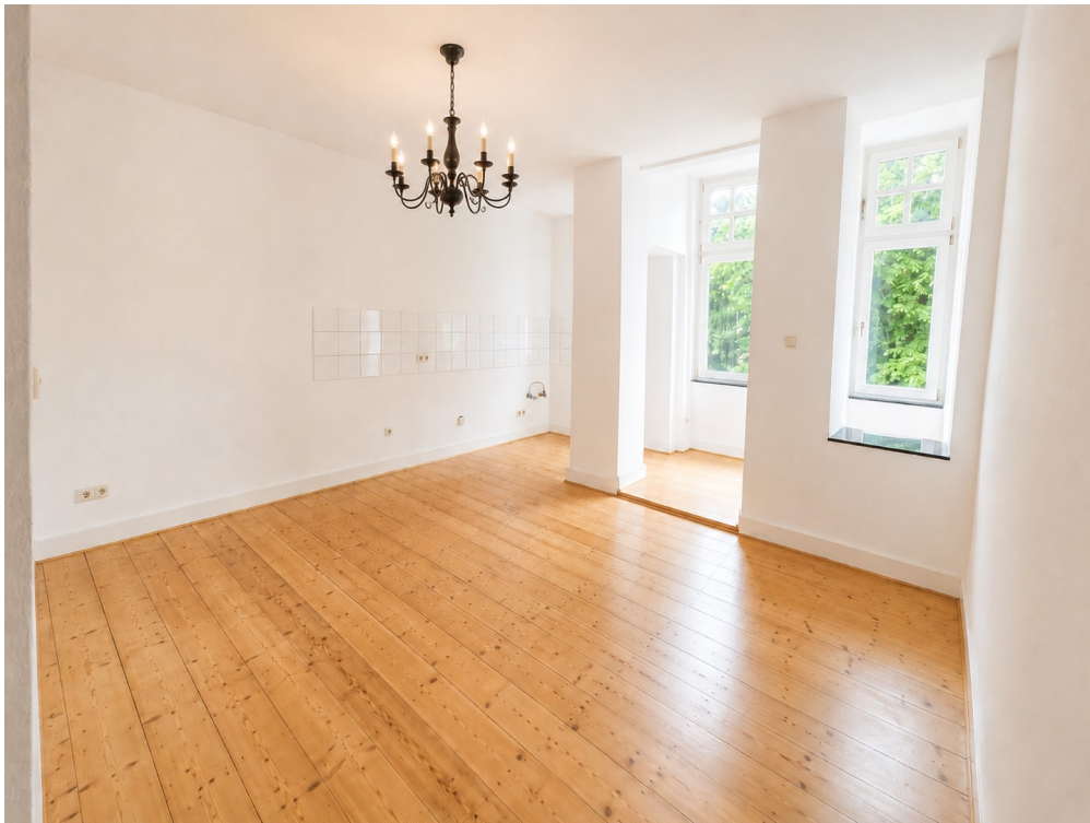
Wohnküche (Boden saniert)