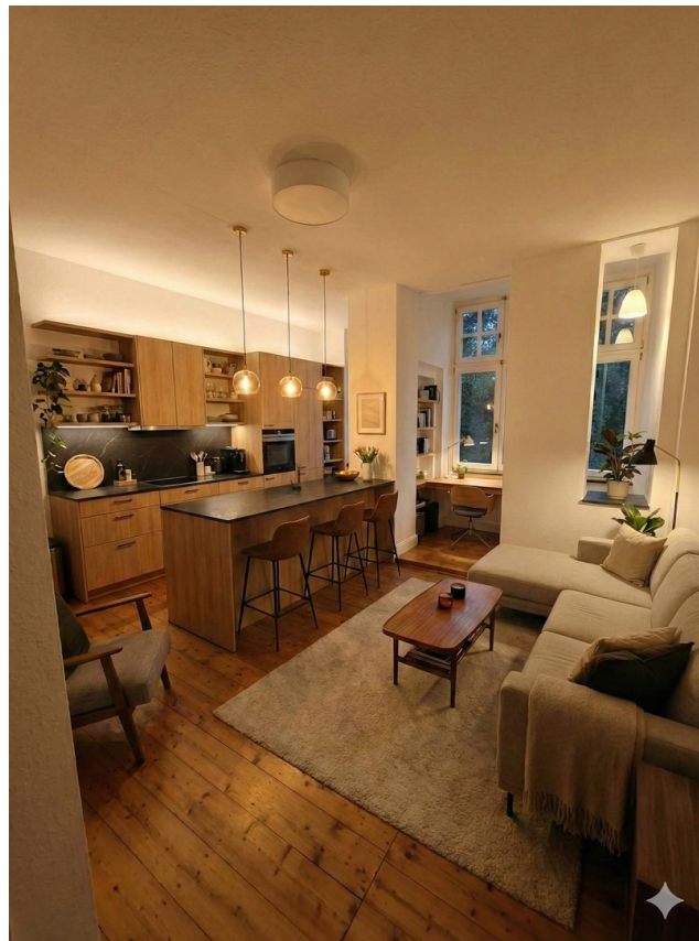
Wohnküche (KI möbliert)