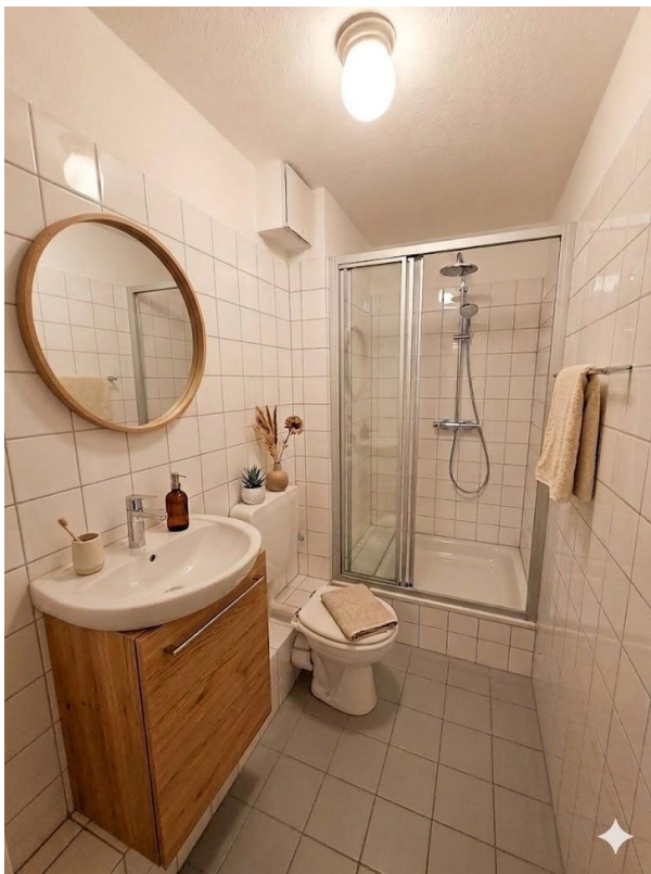
Bad (KI möbliert)