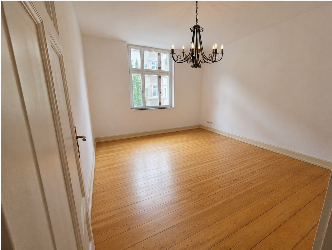
Zimmer 1 (Boden saniert)