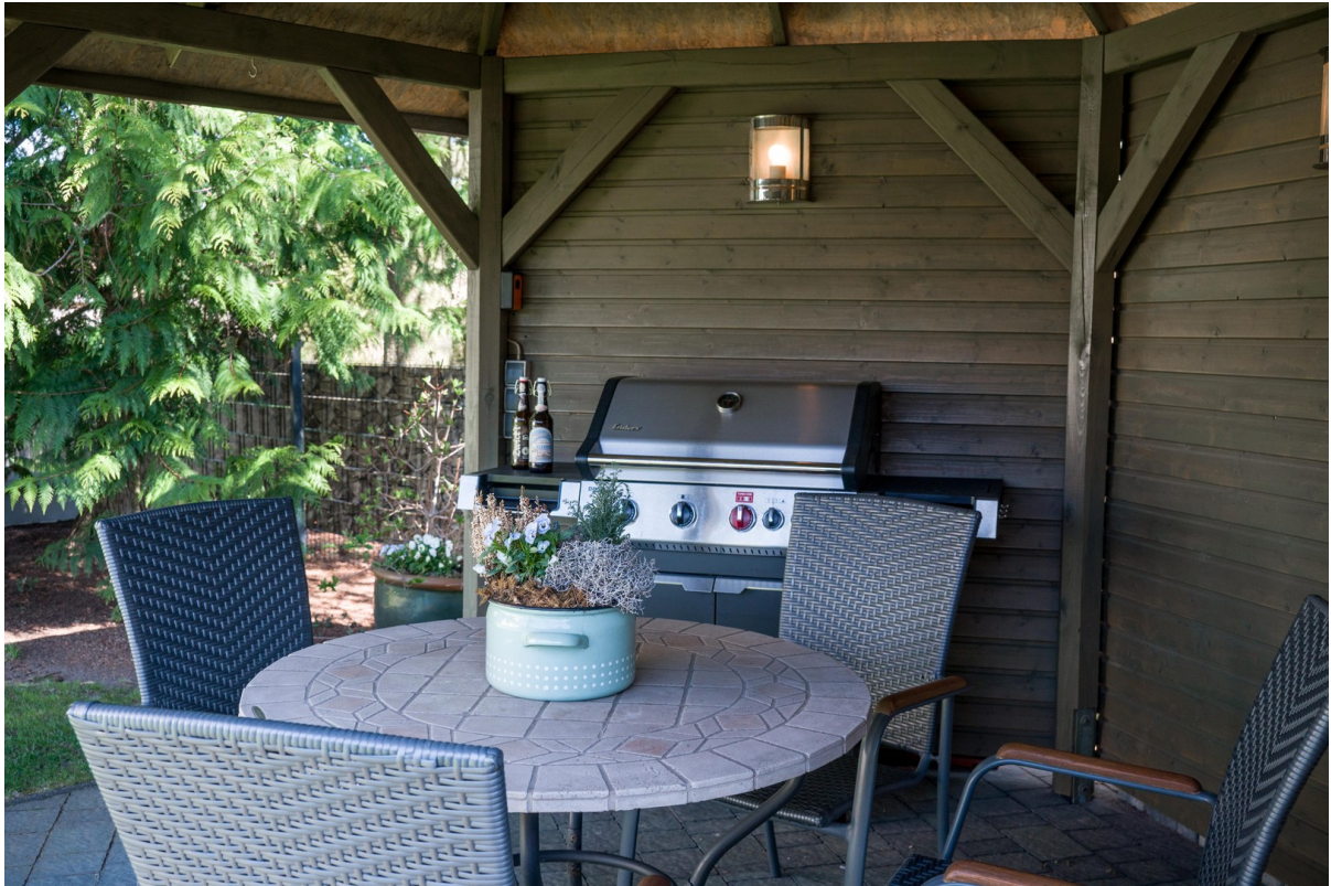
Grillplatz im Pavillon