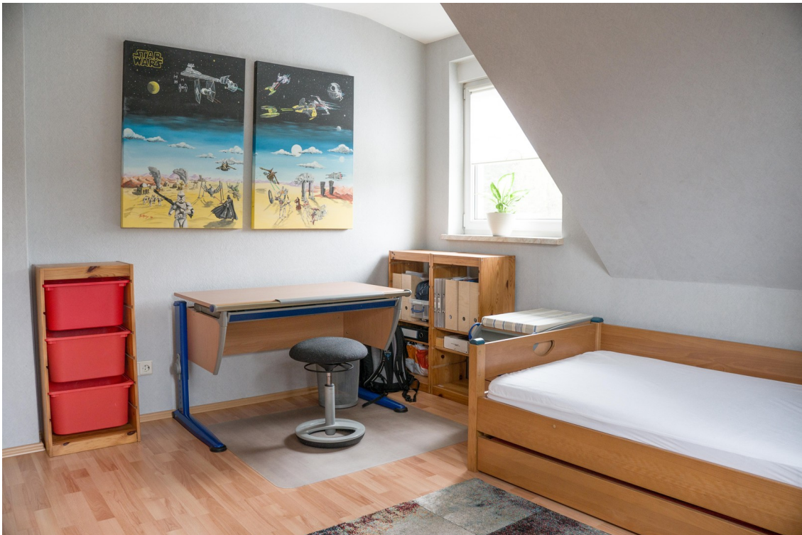
Kinderzimmer 2 Schreibtisch