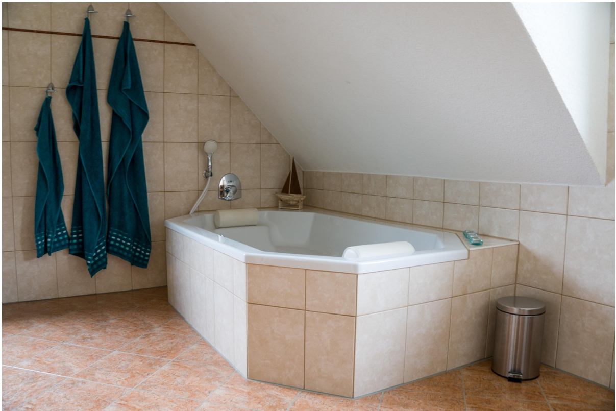
Bad 2 Personen Badewanne