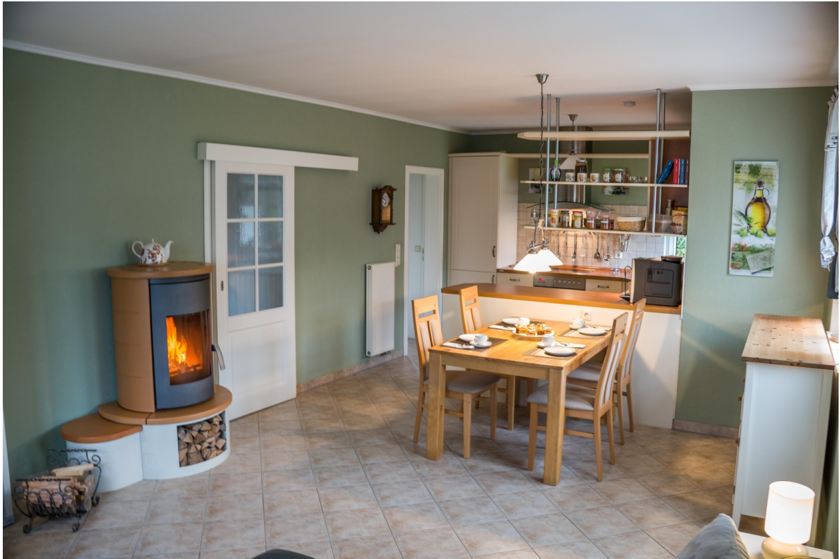
Kamin + Esstisch