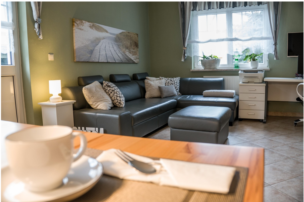
Esstisch mit WZ