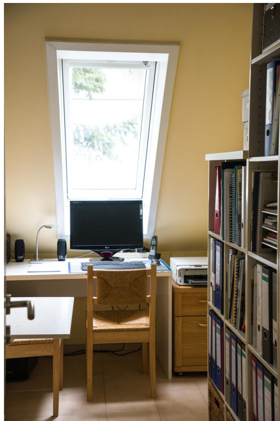
Büro oder Ankleide