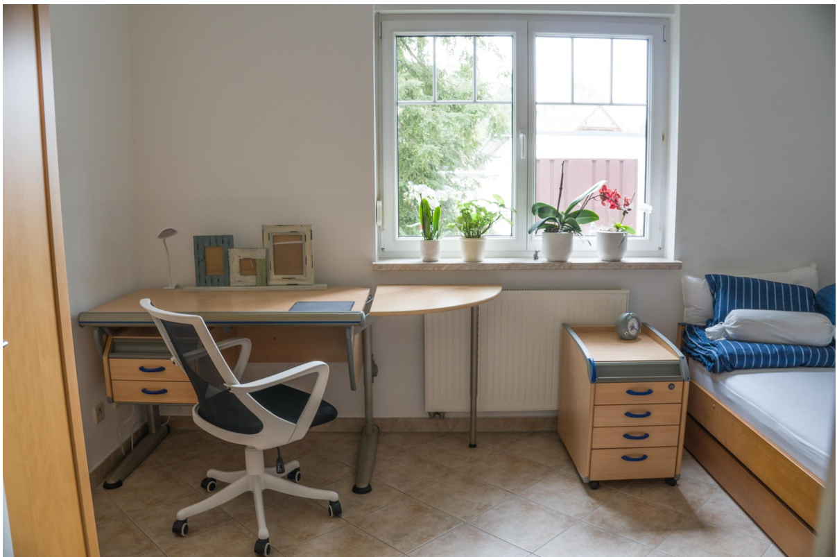
Kinderzimmer 1 Schreibtisch