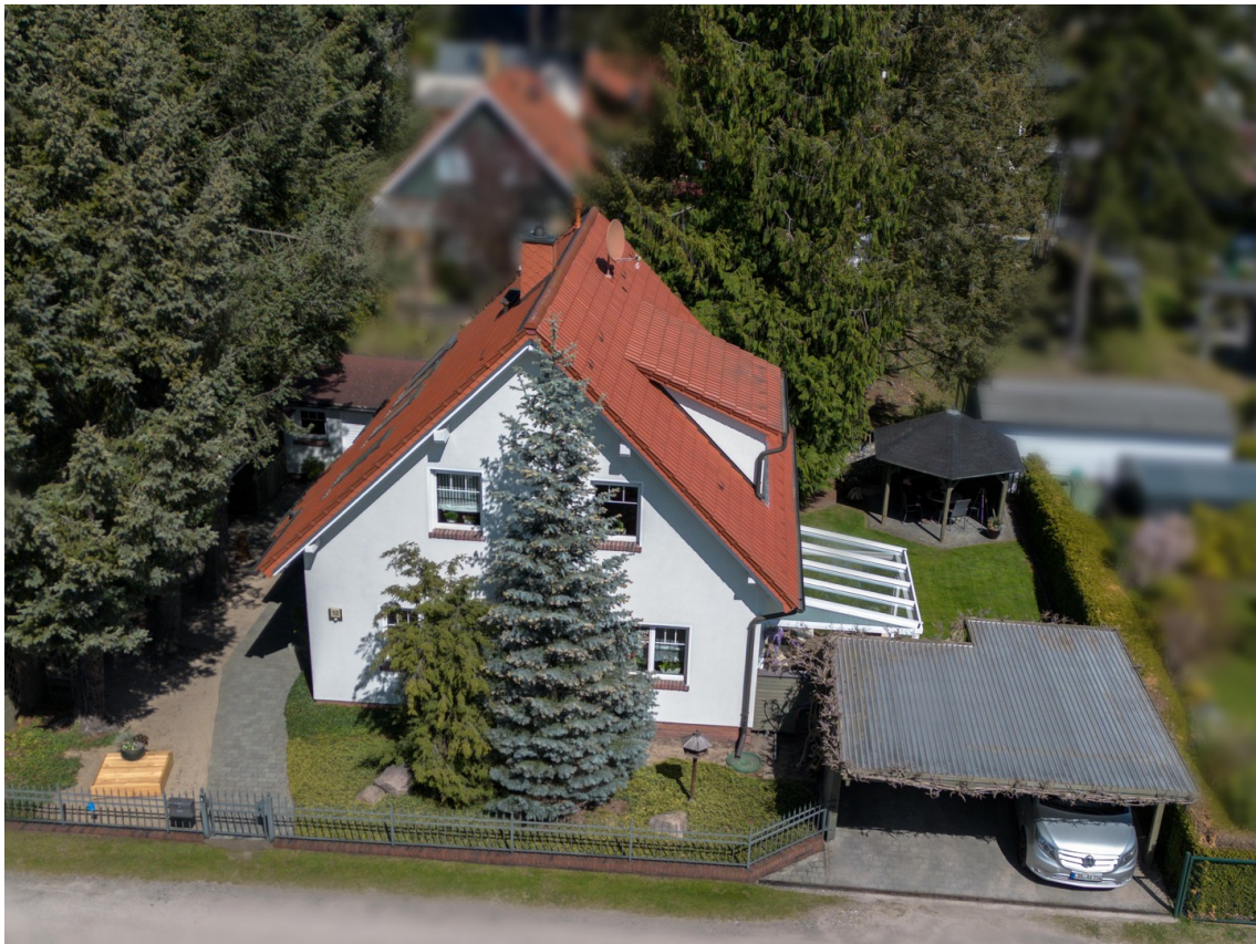
Ansicht Strasse SW