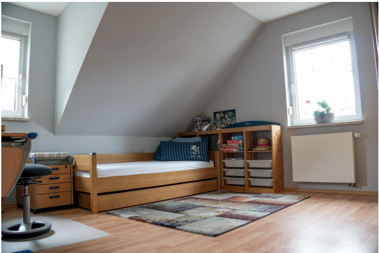
Kinderzimmer 2 Bett