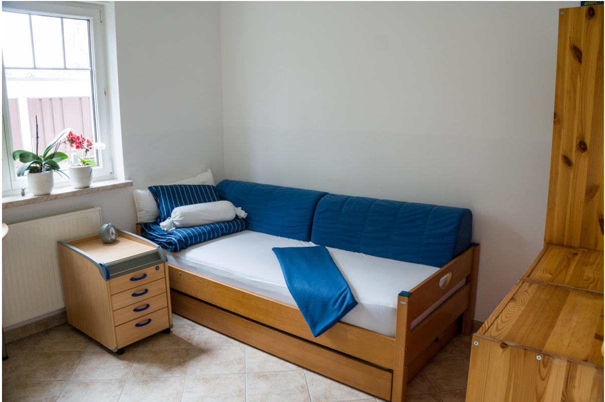
Kinderzimmer 1 Bett