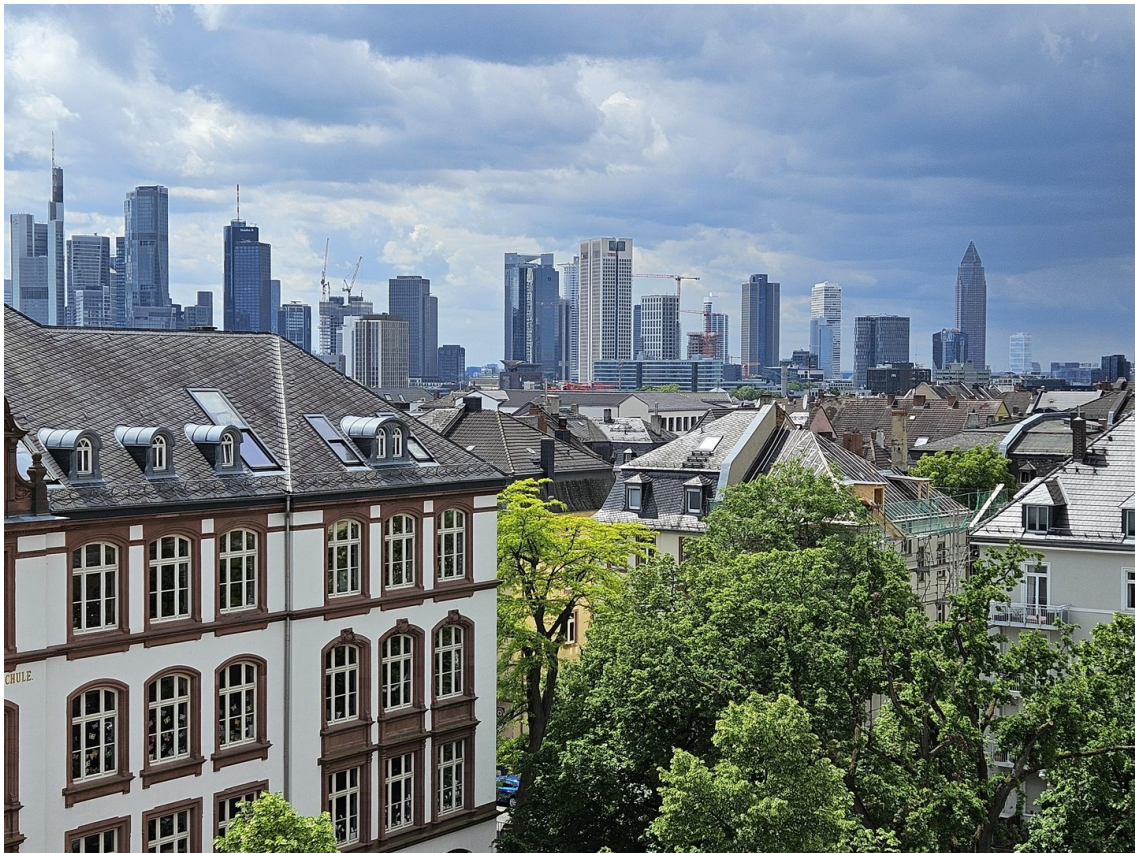
Aussicht Wohnzimmer nach SW