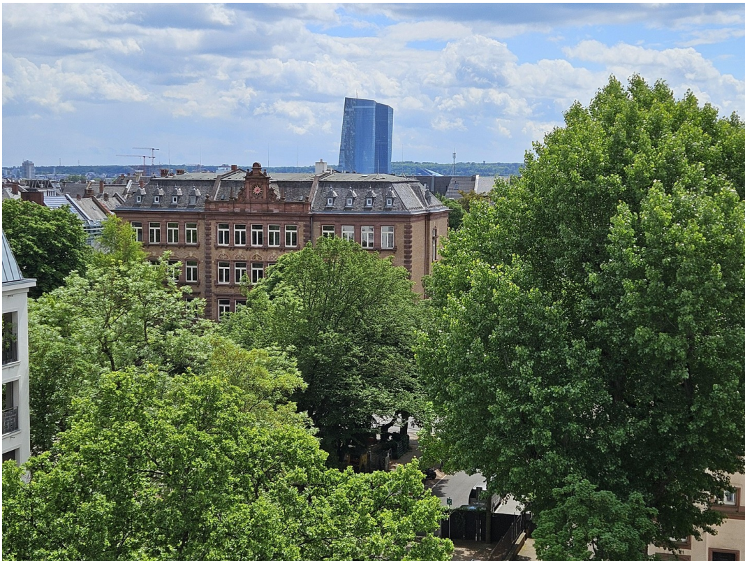
Aussicht Wohnzimmer nach S