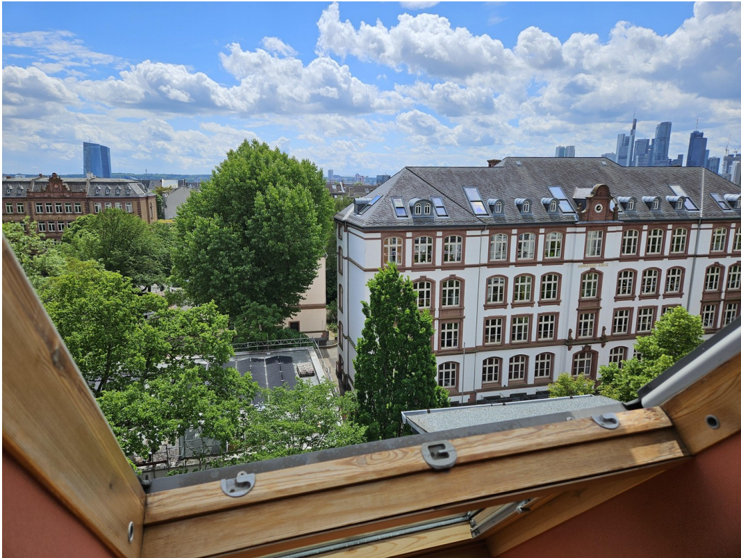
Aussicht Wohnzimmer nach S