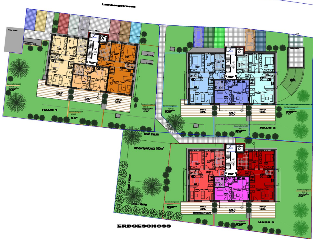
EG Grundrisse Details n.R.