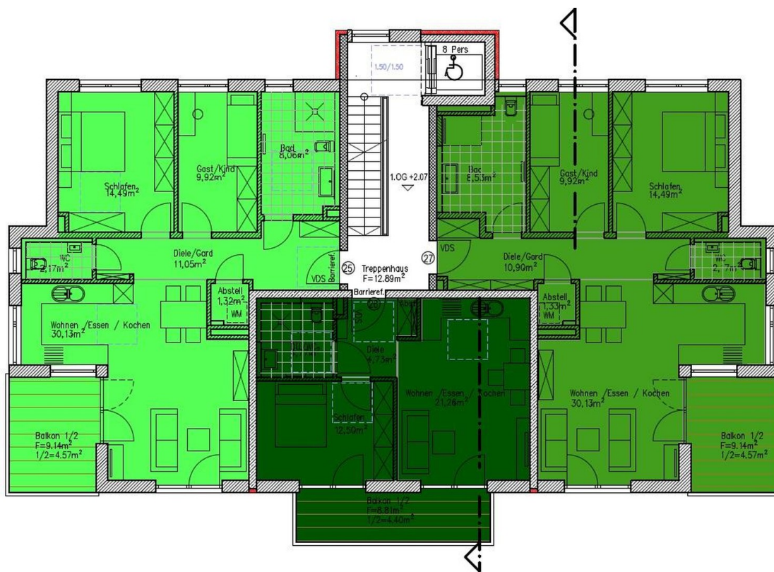
WE 25 u 26 u 27 1. OG Haus 3