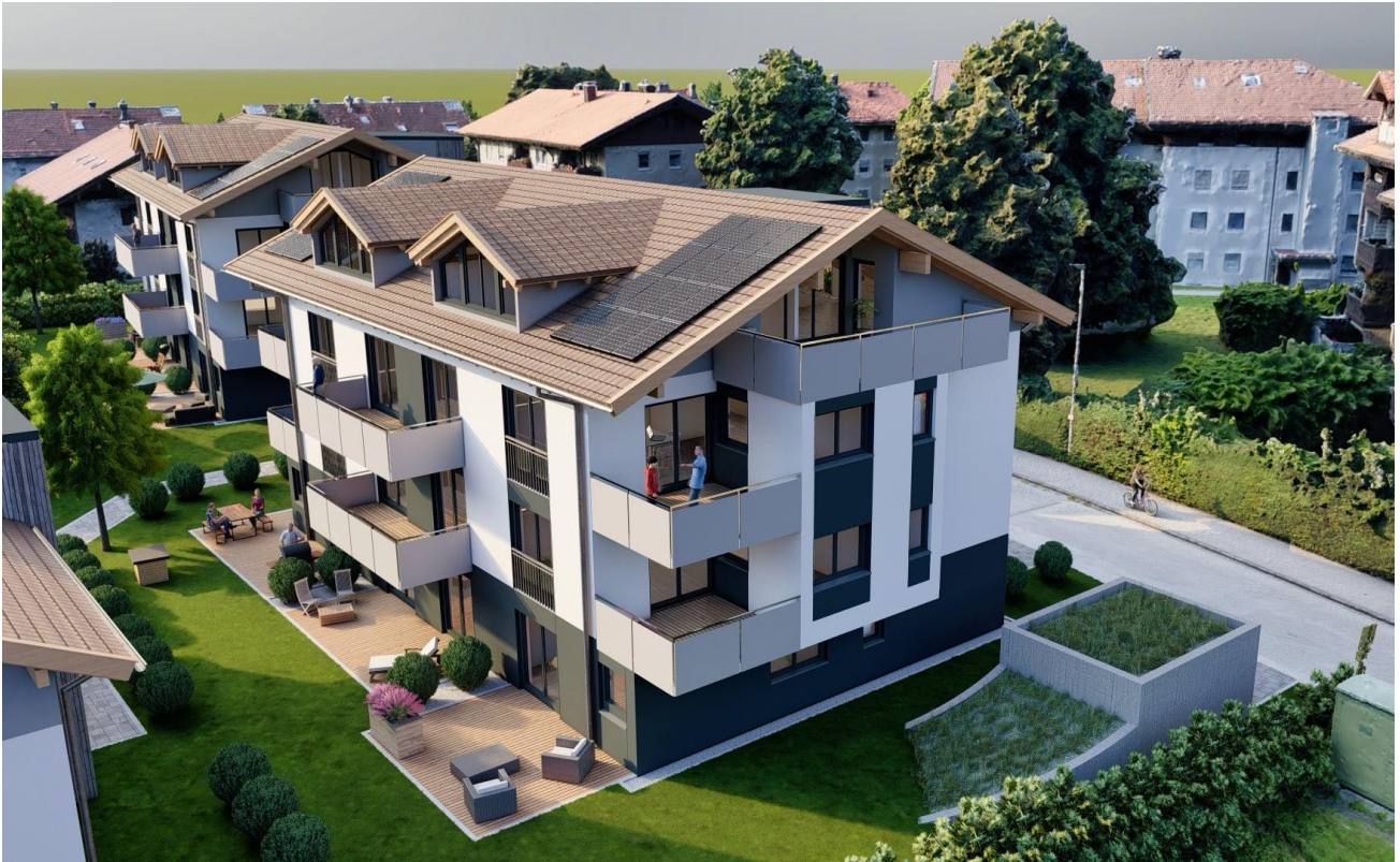
Haus 2 aus Ost