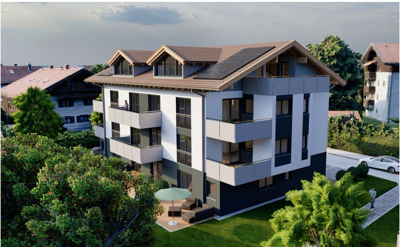
Haus 1 Ansicht Ost