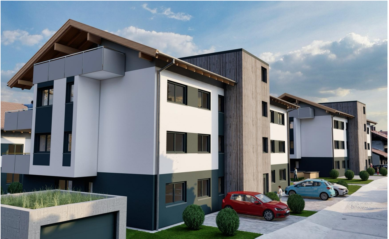
Anfahrt Lambergstr. Haus 2 u 1