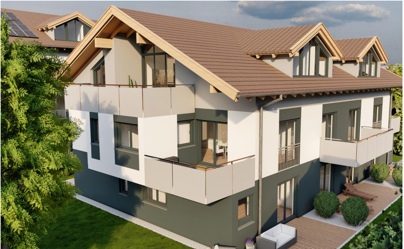
Haus 3 Ansicht Südost