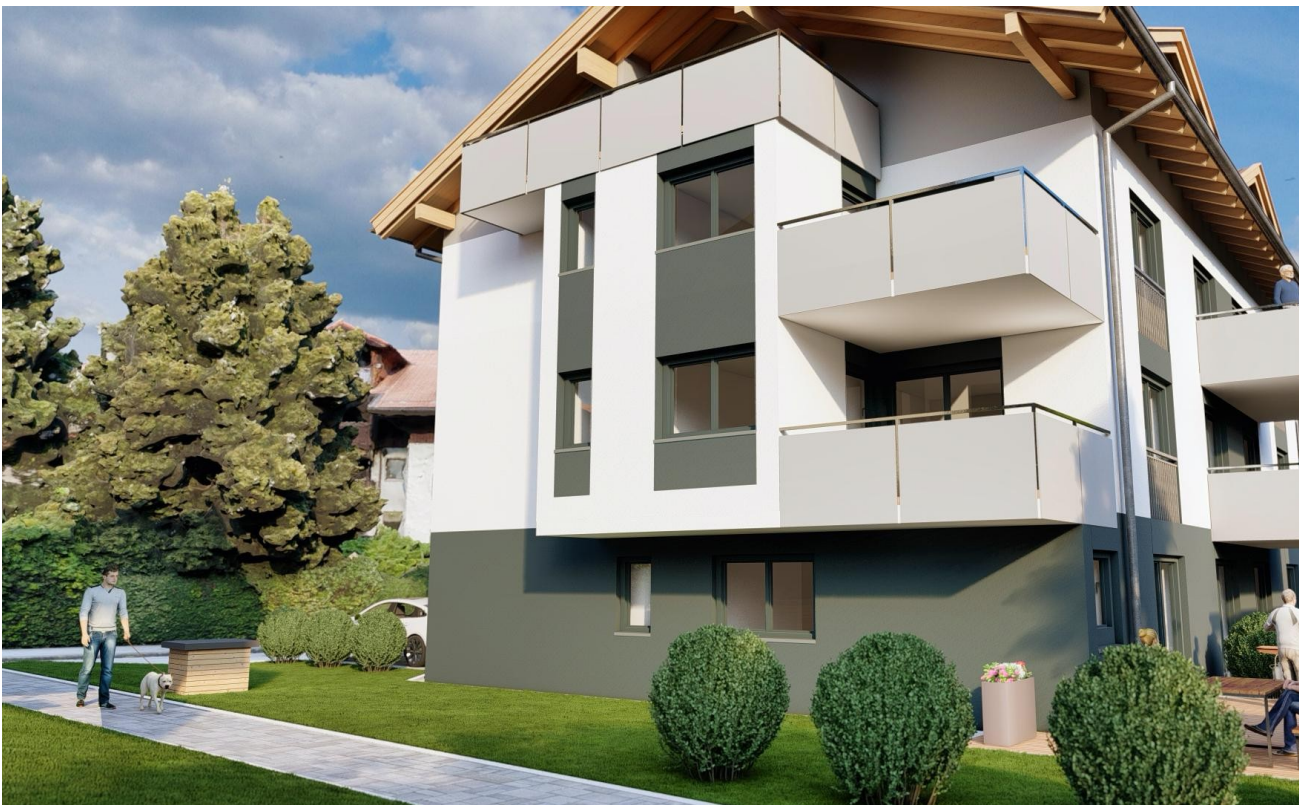
Haus 2 Ansicht Süd