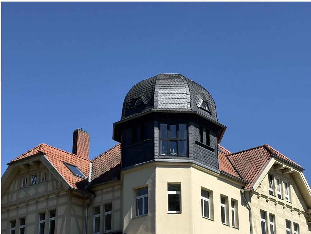
Die Wohnung von außen