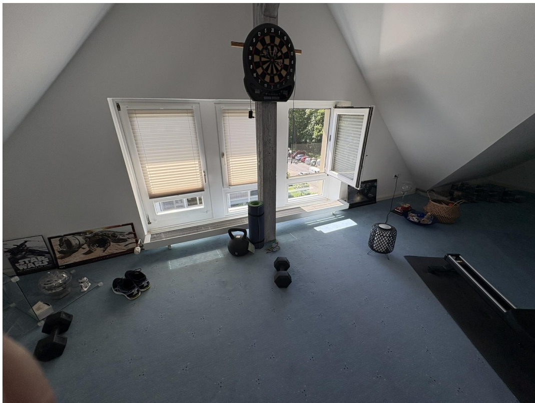
Sport und Yoga-Ecke