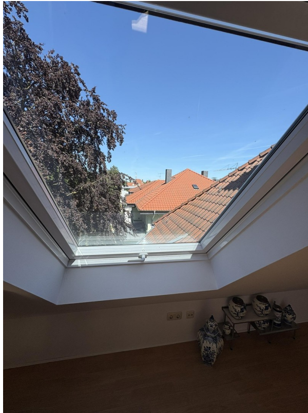
Freier heller Blick 2