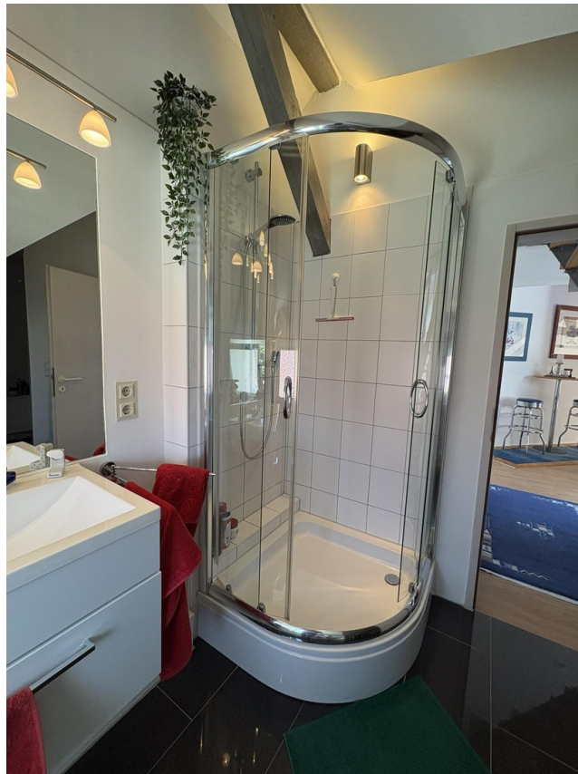
Bad 3 mit Dusche