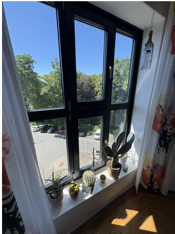
Blick in Eilenriede