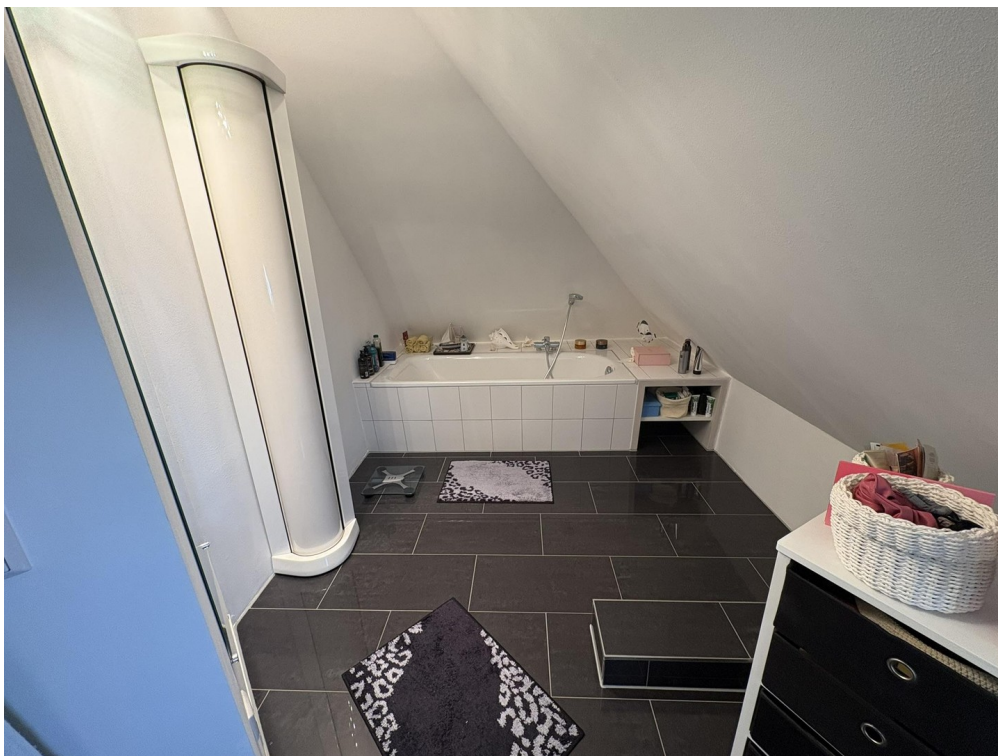
Bad 4 mit Wanne