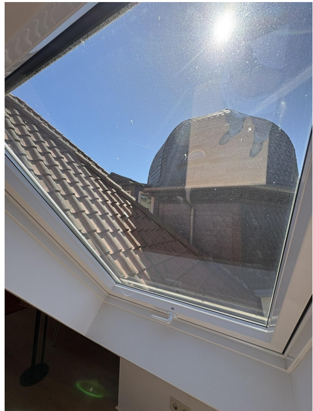
Freier heller Blick mit Turm