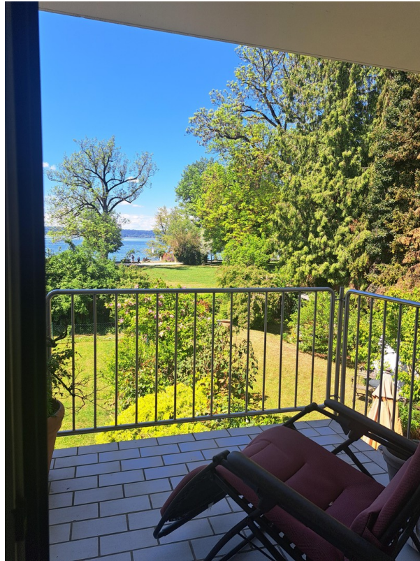
Blick vom Balkon auf den See