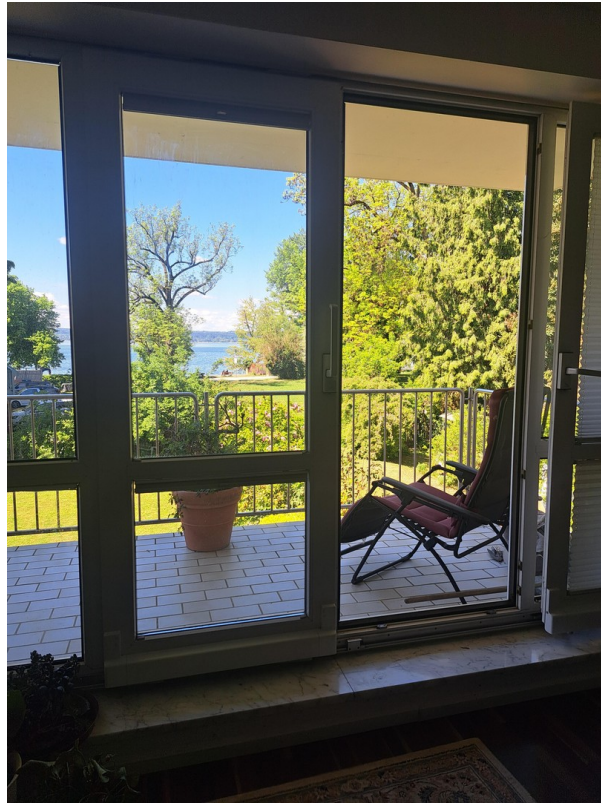
Blick vom Wohnzimmer z. Balkon