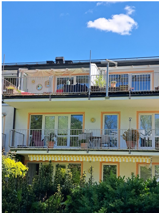
Sicht vom Garten aufs Haus