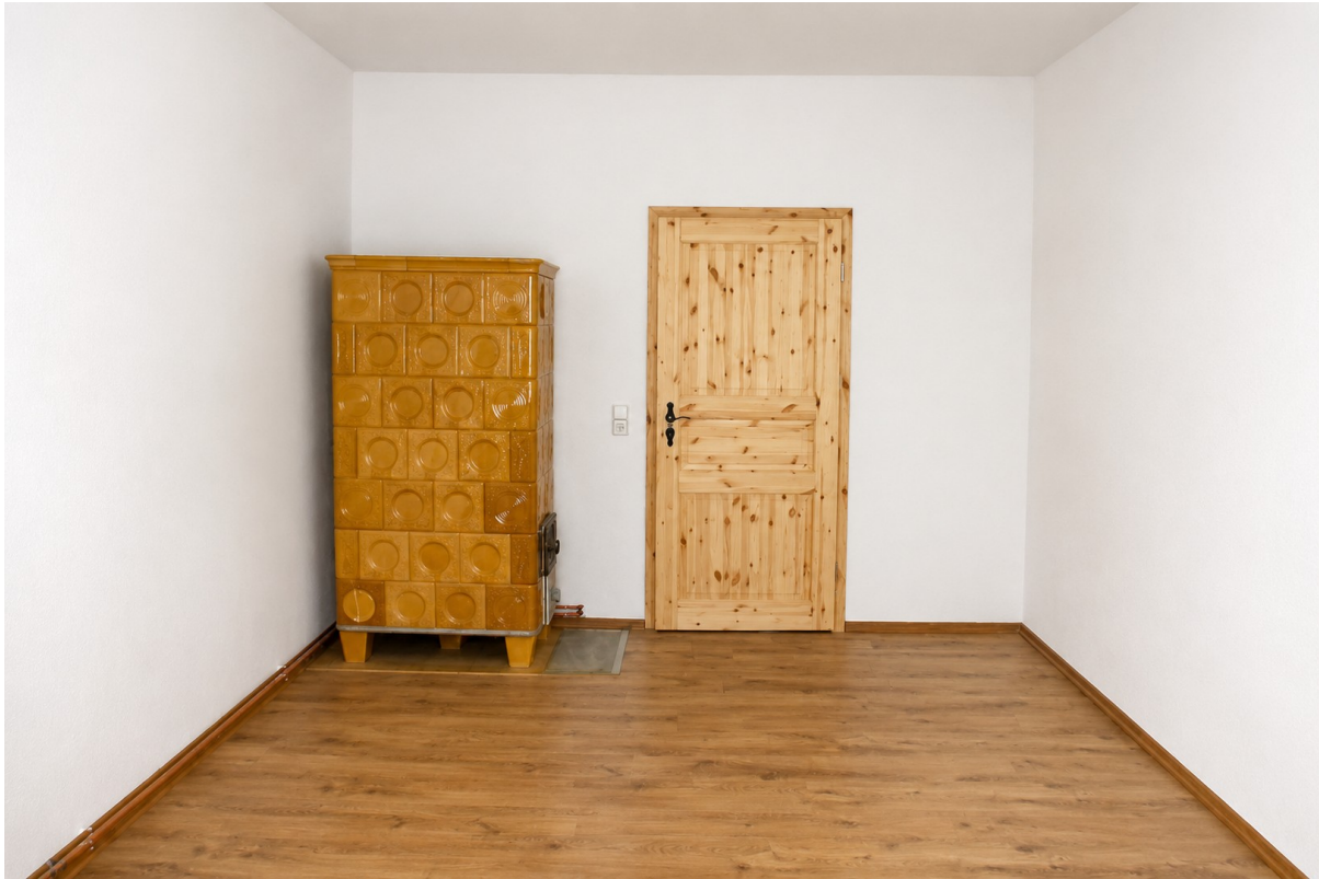
Wohnzimmer mit Ofenheizung