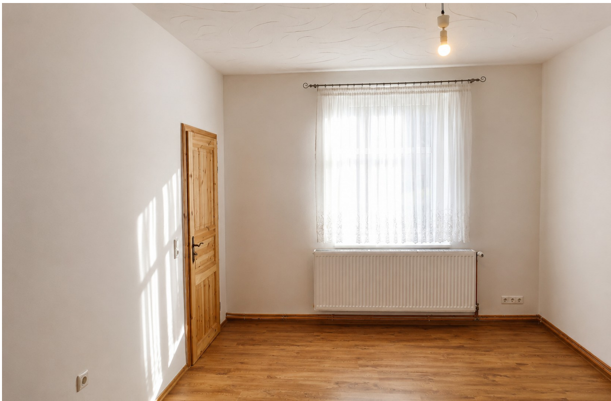
Wohnzimmer mit Ausblick