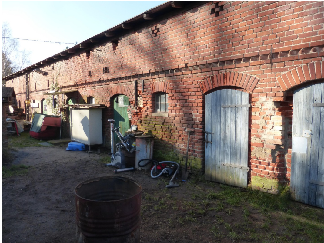
Unterstellräume je 25 qm