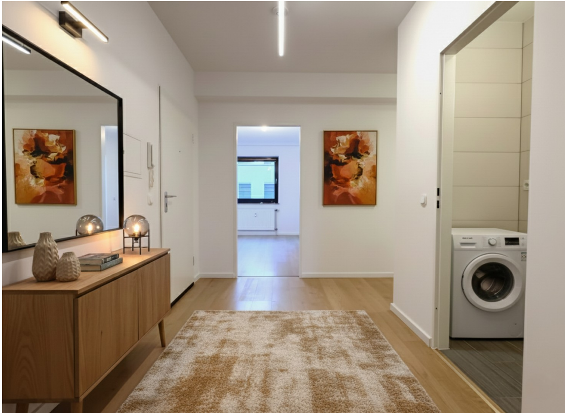
Flur 1 (KI-möbliert)