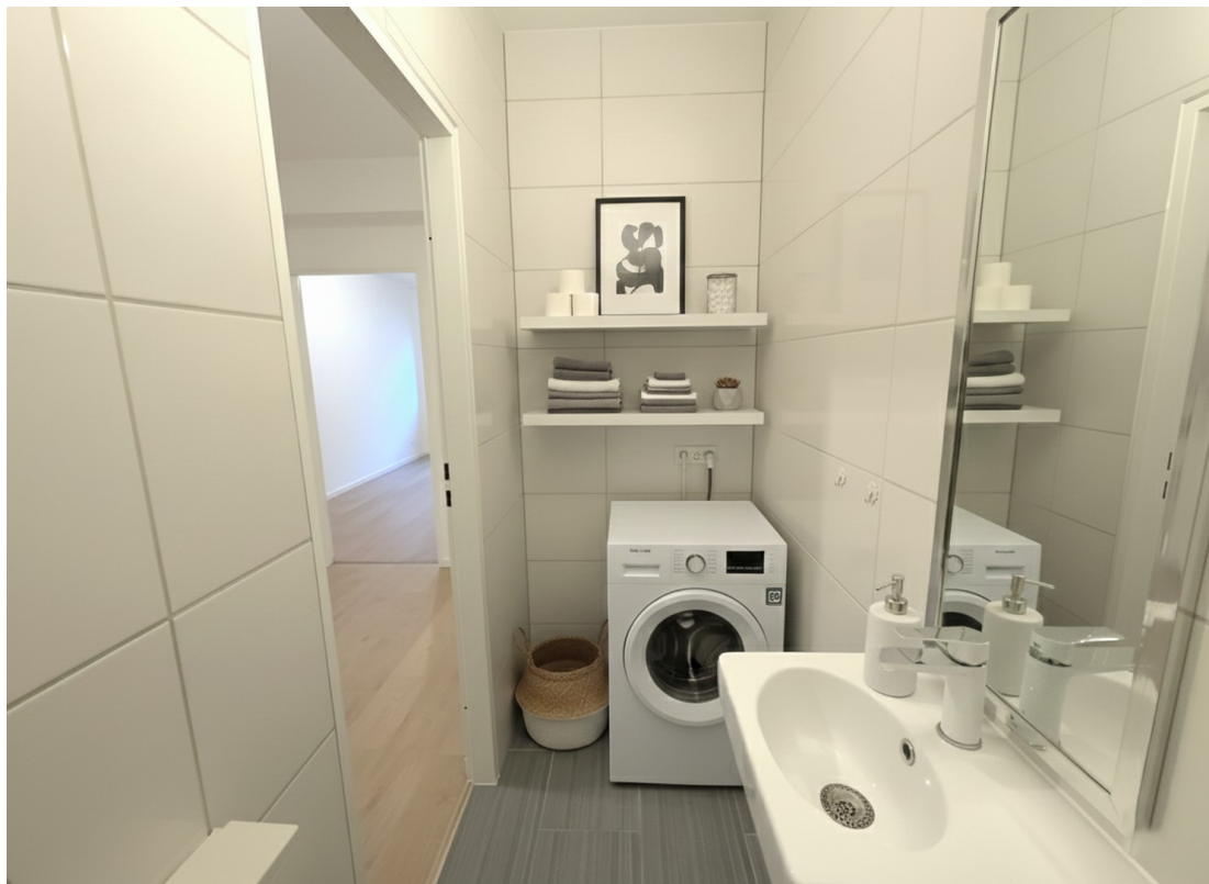
WC 1 (KI-möbliert)