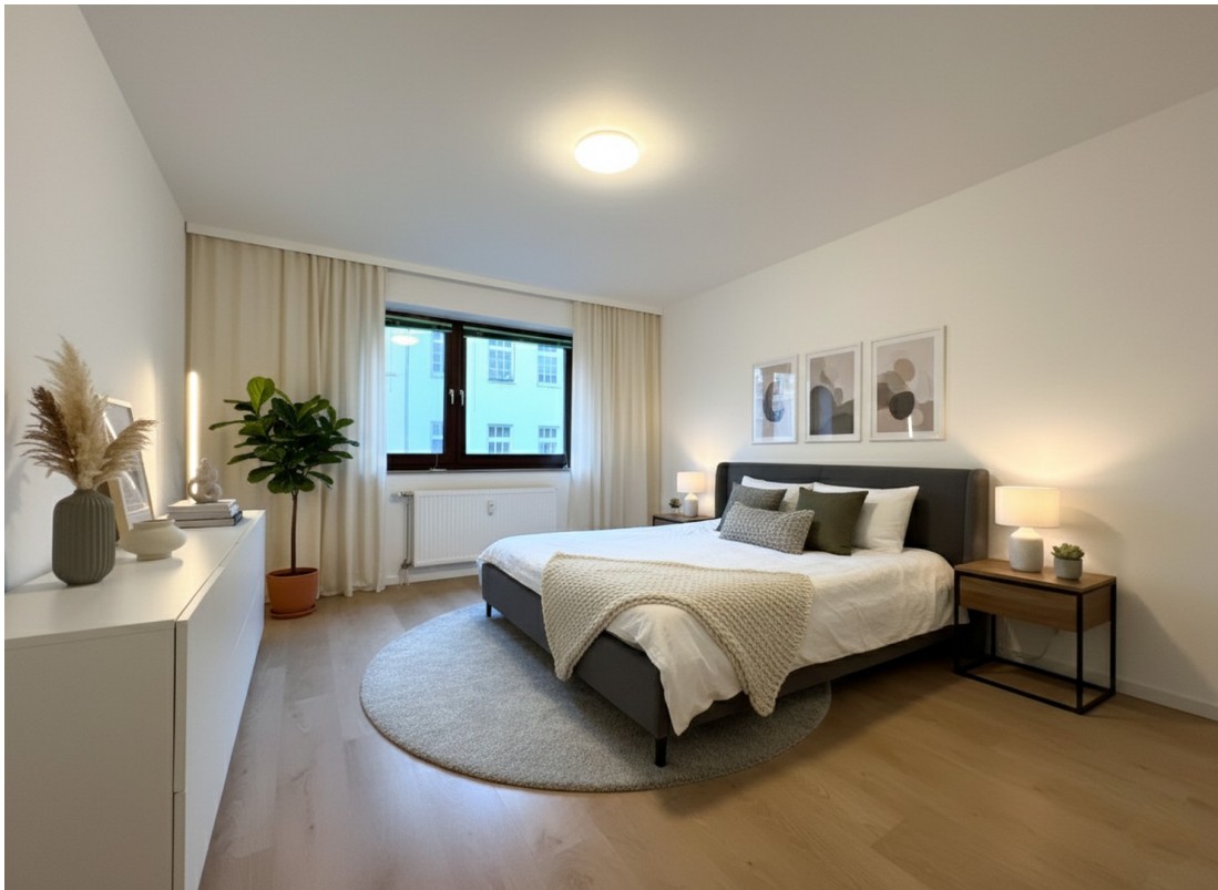
Schlafzimmer 1 (KI-möbliert)