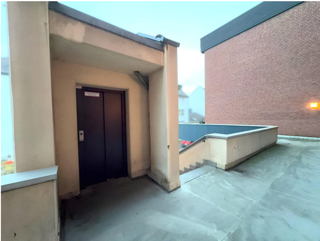
Aufzug / Außentreppe