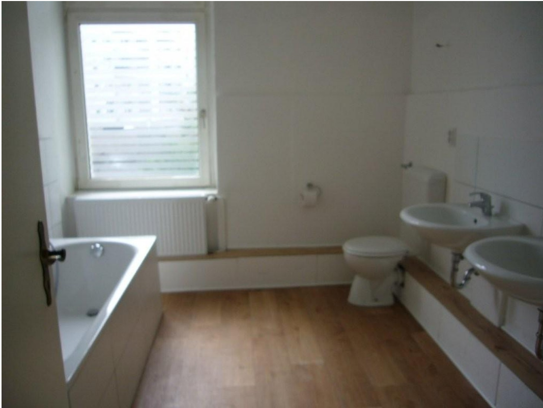
Bad 2 OG