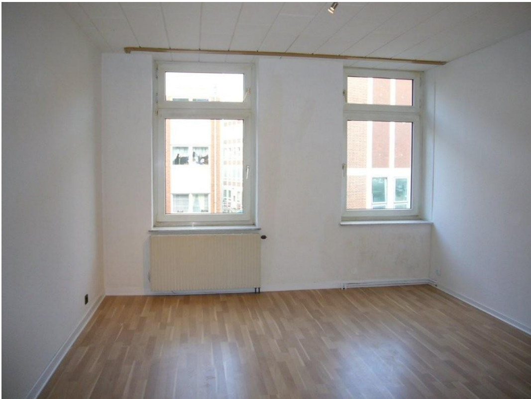
Eines der Schlafzimmer