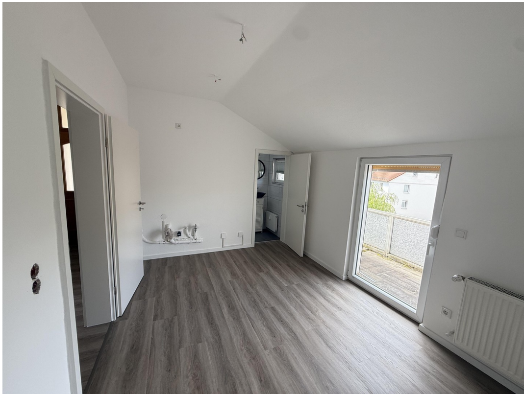
Küche(EBK wird noch eingebaut)