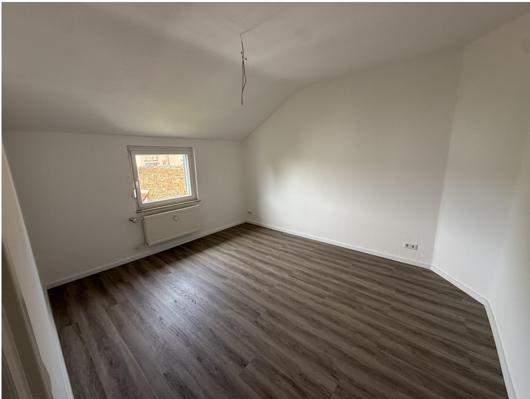
Büro / Kind