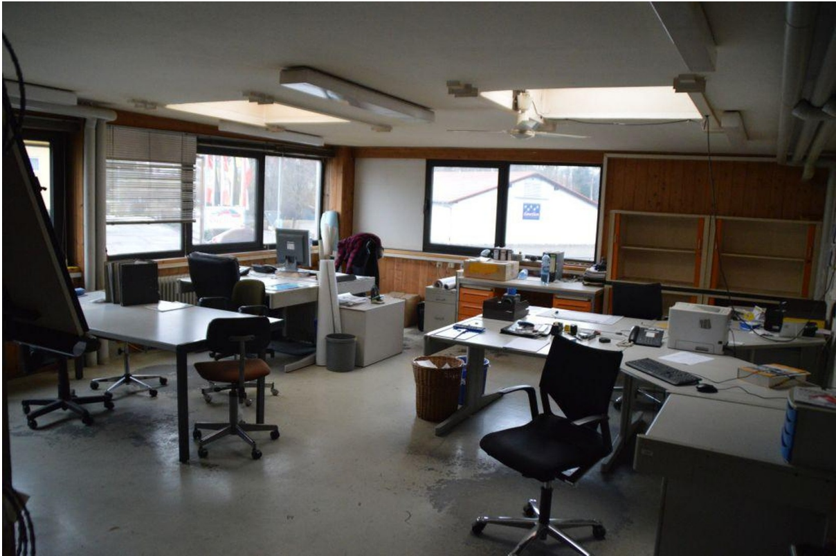
Büro Beispiel 40m 2