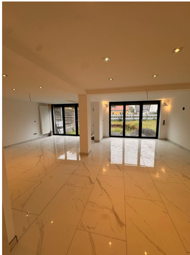
Wohn- u. Esszimmer