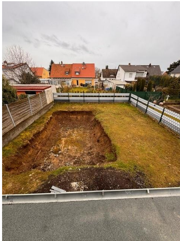
Garten Vorbereitung Poolanlage