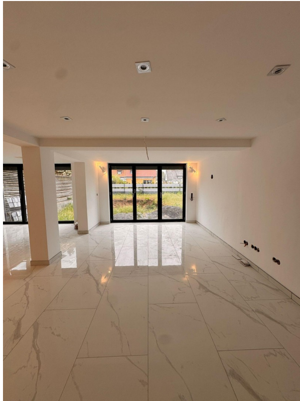
Wohnzimmer- o. Esszimmer