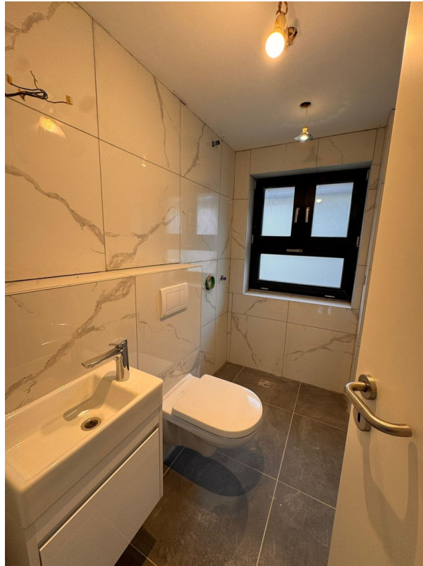
Gäste WC mit Dusche