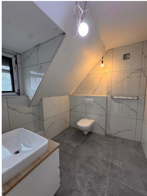
Bad im DG