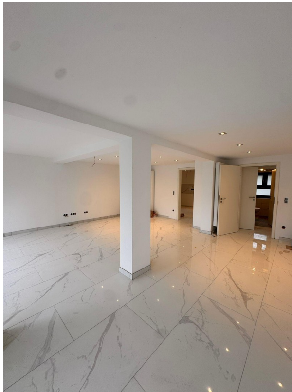
Wohnzimmer u. Esszimmer