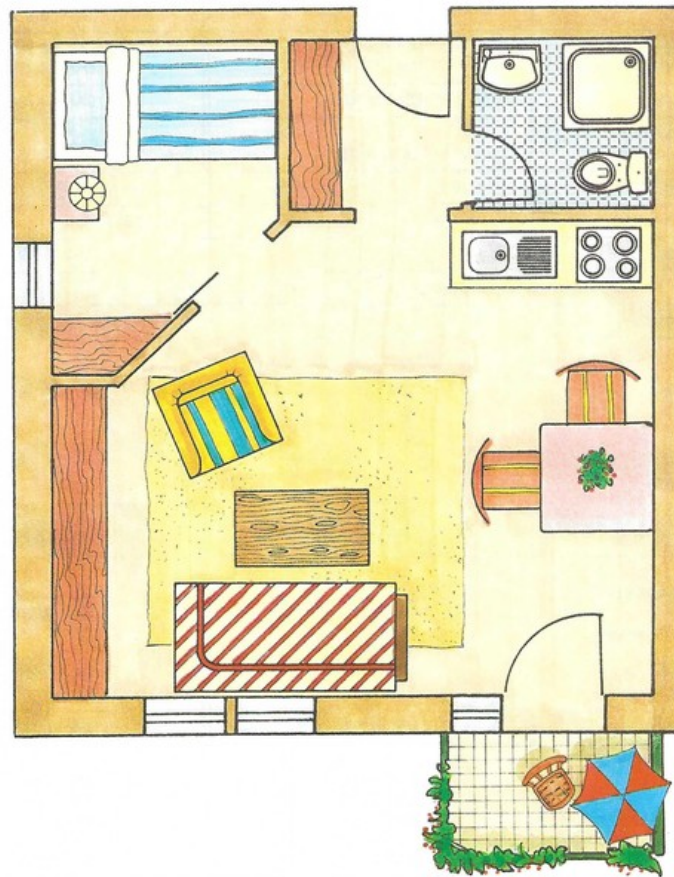
1 1/2-Zimmer-Appartement 36 m 2