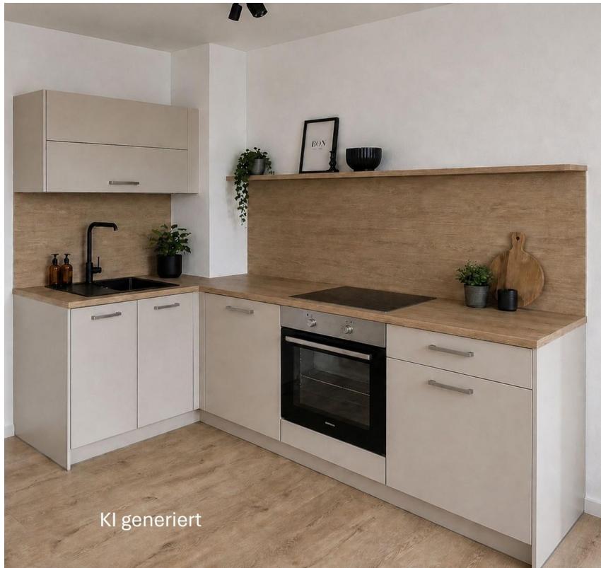
Küche - KI generiert