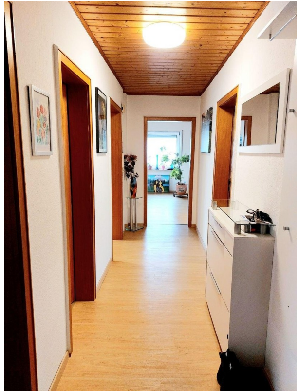
Flur / Diele