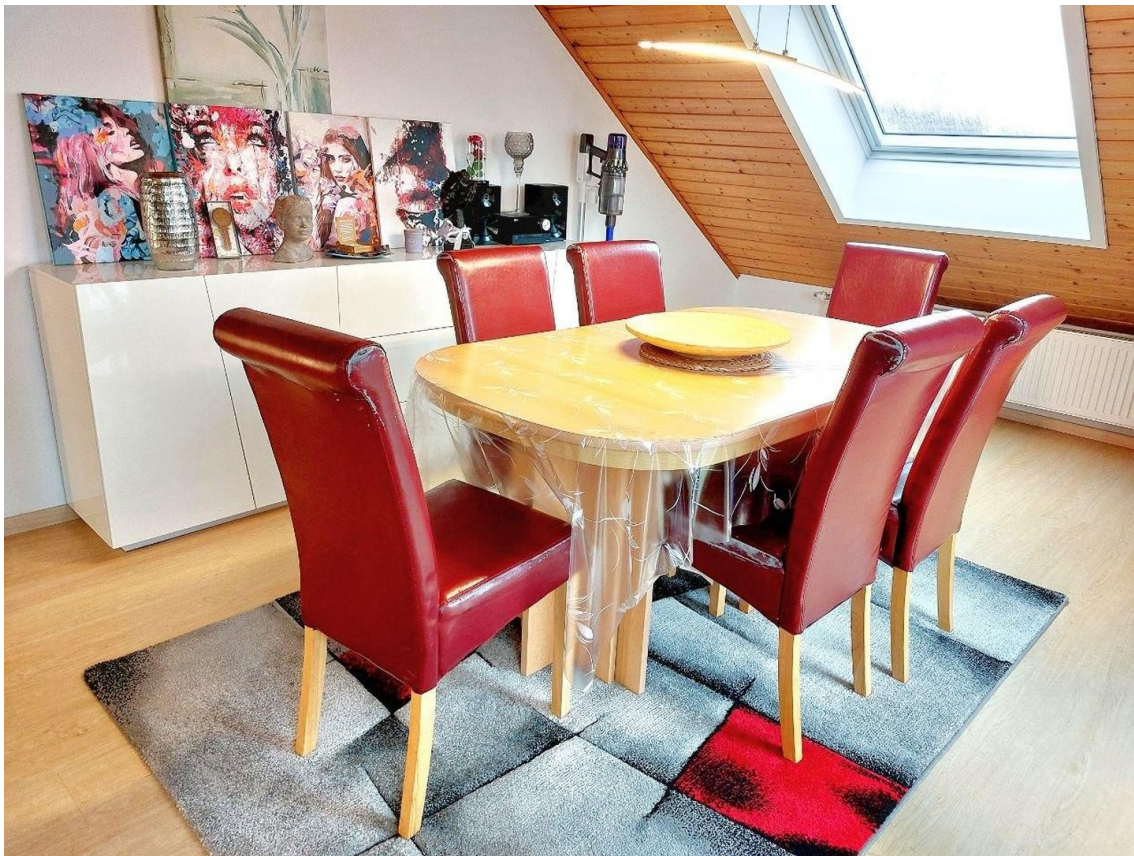
Essbereich im Wohnzimmer