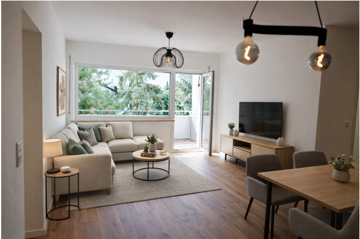
Wohnzimmer | KI generiert