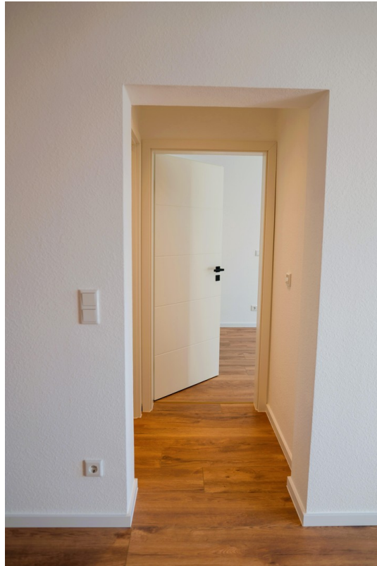
Flur ins Schlafzimmer