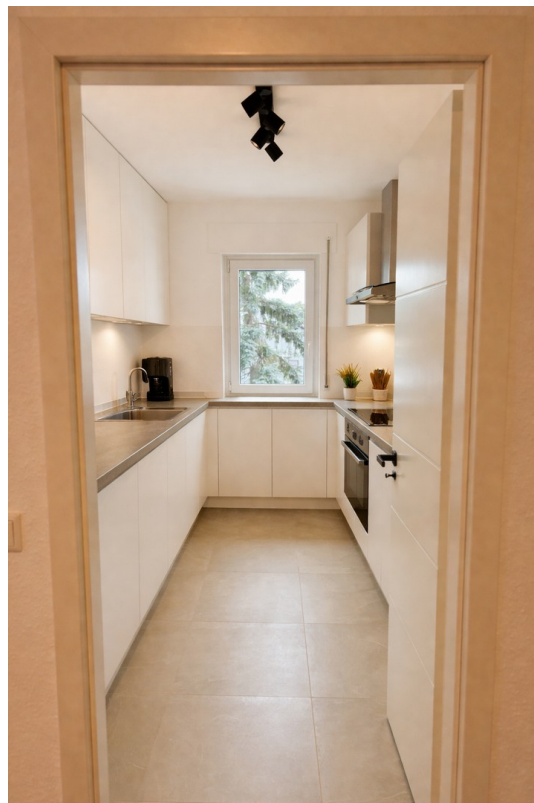
Küche | KI generiert