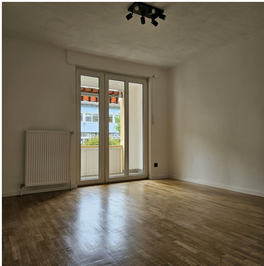
Wohnzimmer Blick auf Balkon