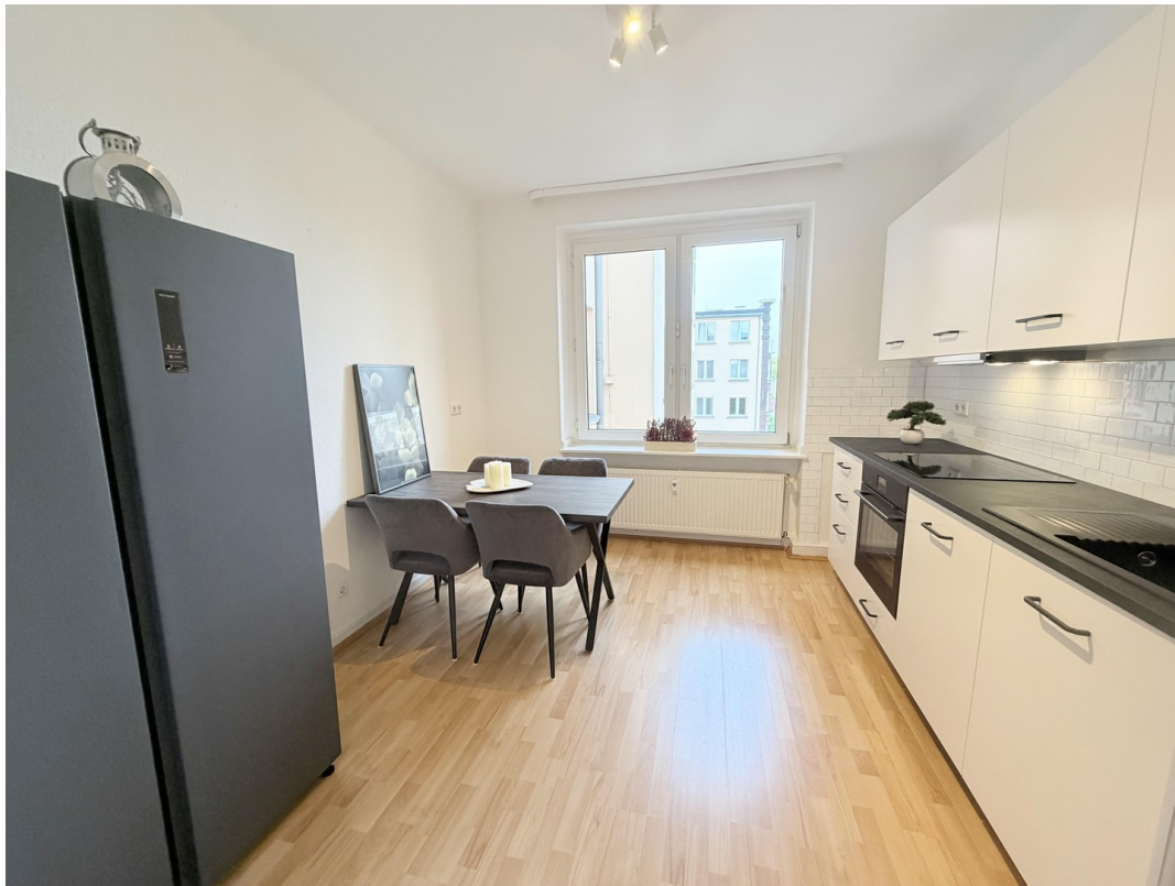
Küche (voll ausgestattet)