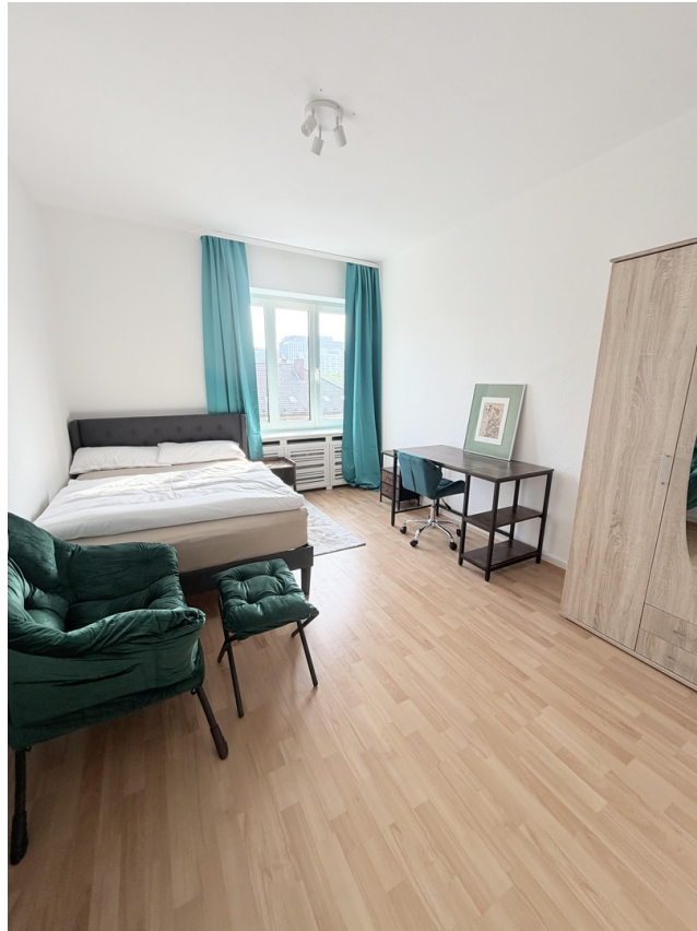
Zimmer 3, ca. 14 m2: