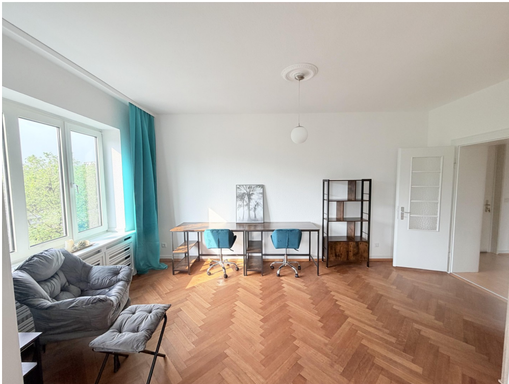
Zimmer 1, ca. 35 m2