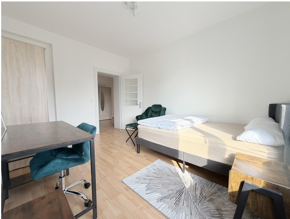
Zimmer 3, ca. 14 m2: