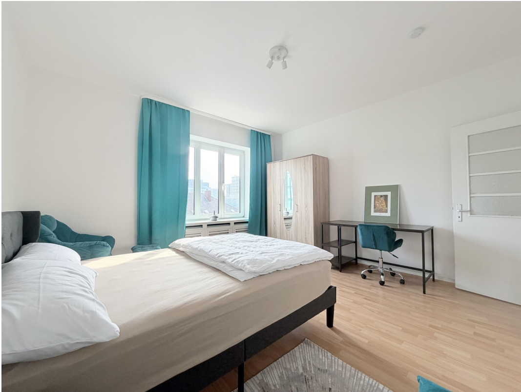
Zimmer 2, ca. 18 m2