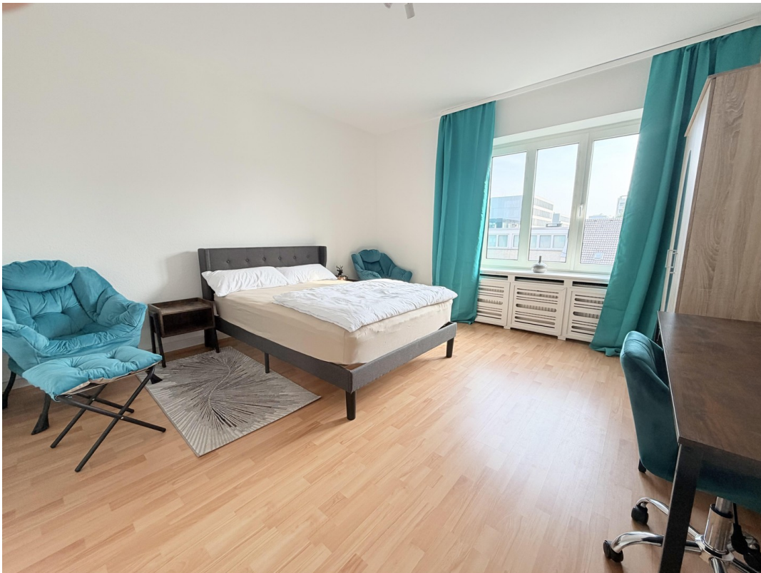
Zimmer 2, ca. 18 m2