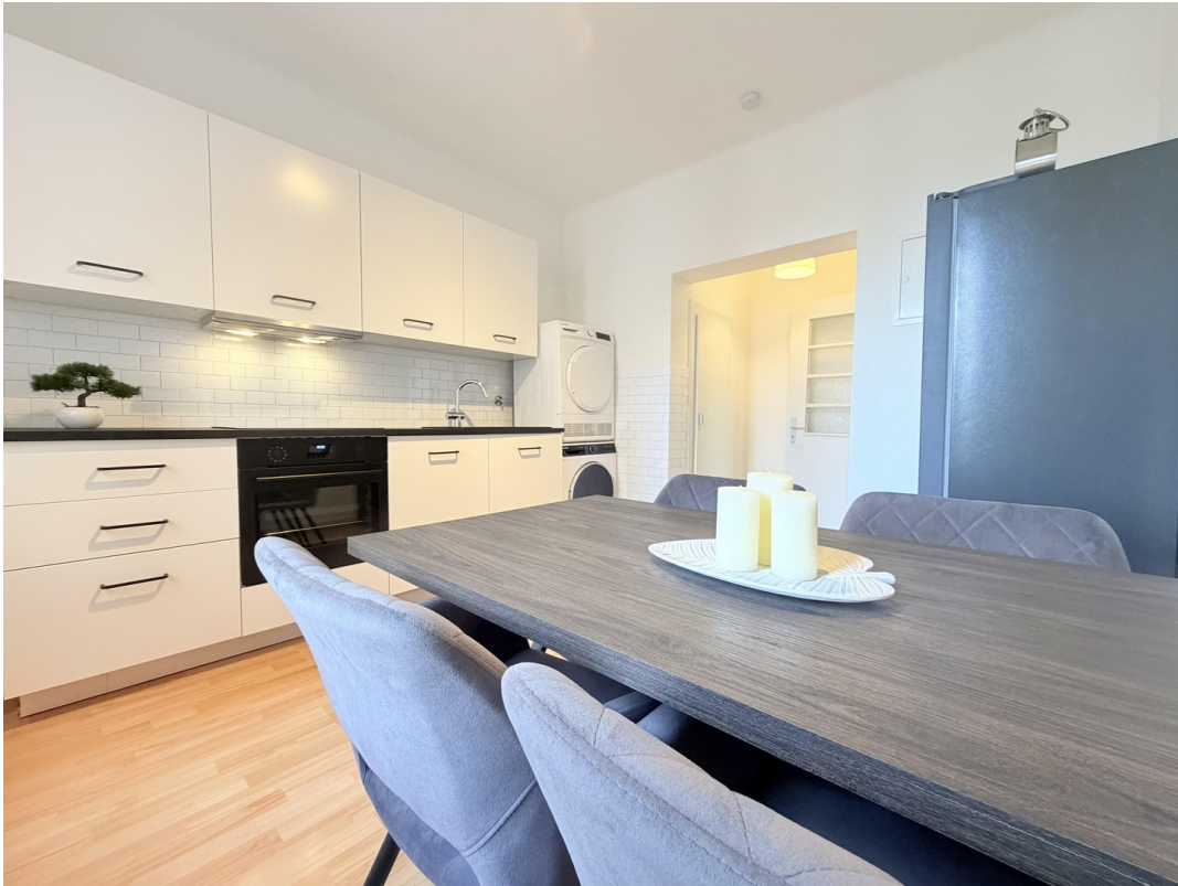
Küche (voll ausgestattet)