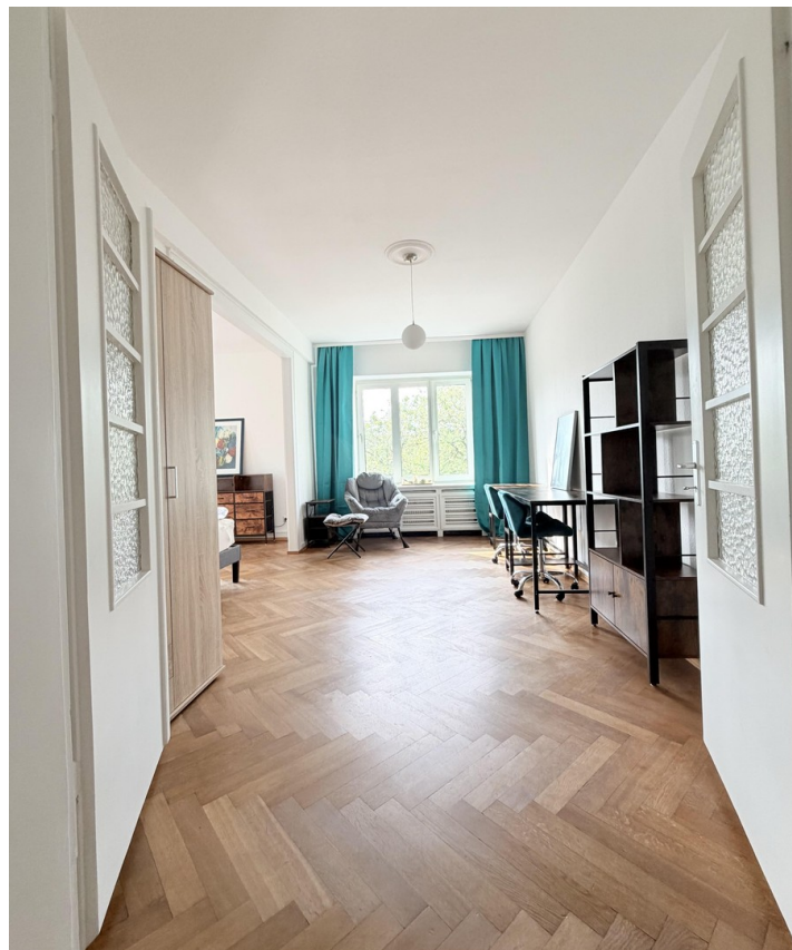
Zimmer 1, ca. 35 m2