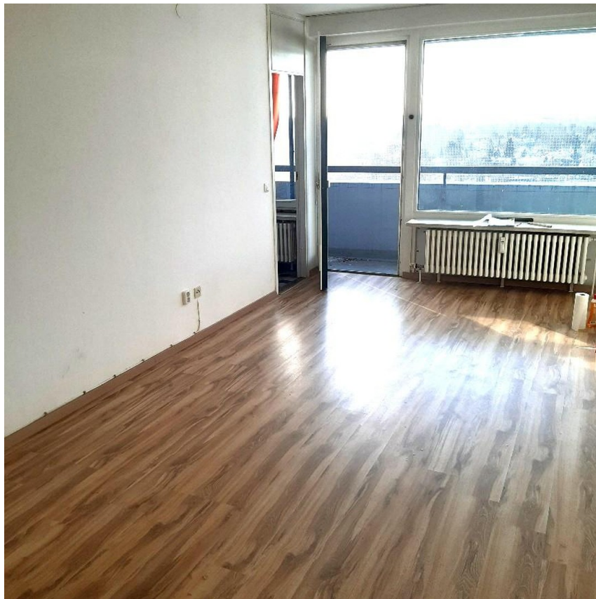
Blick nach Osten