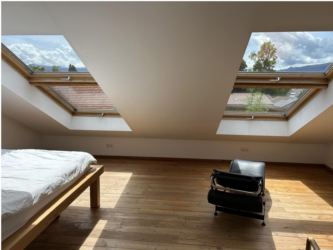
Dachgeschoß mit Blick