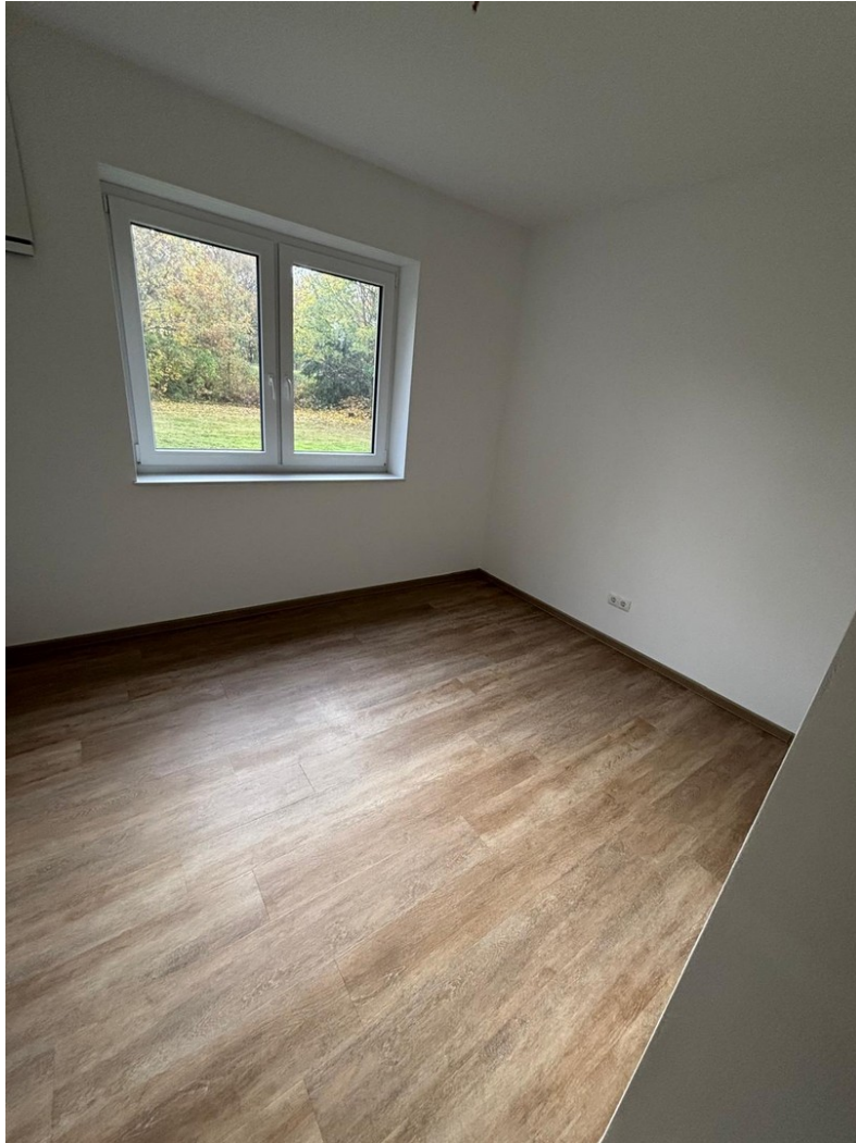
Zimmer 1 (Beispiel)