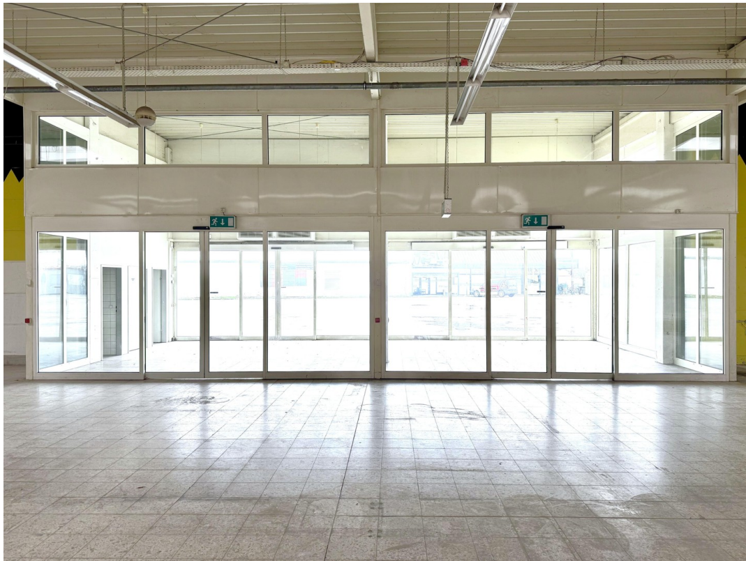
Halle 1 Eingang