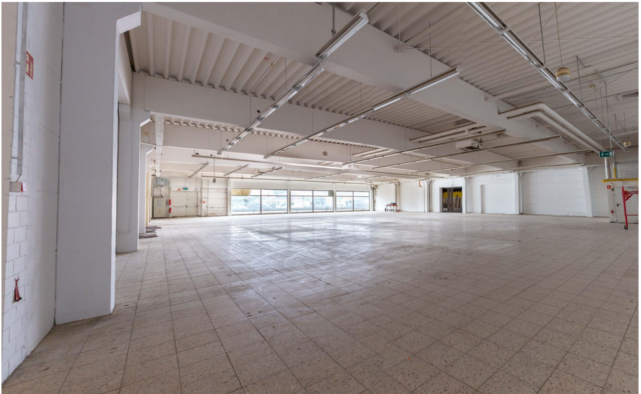
Halle 2 Front