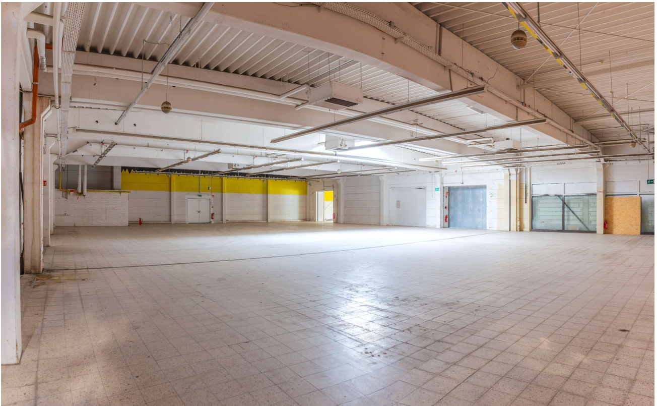
Halle 3 Rück