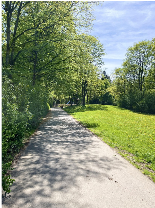
Zugang zum Forstenrieder Park