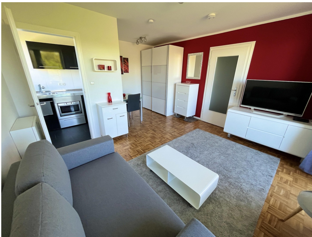
Wohnen Ansicht 2