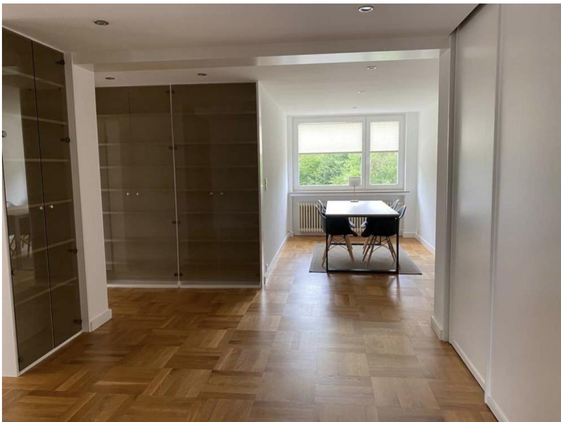
Diele/Esszimmer inkl. Schränke