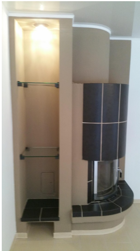
Kamin in Wohnzimmer