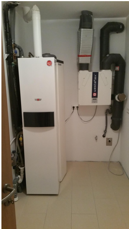
HWR Raum Heizung Lüftung