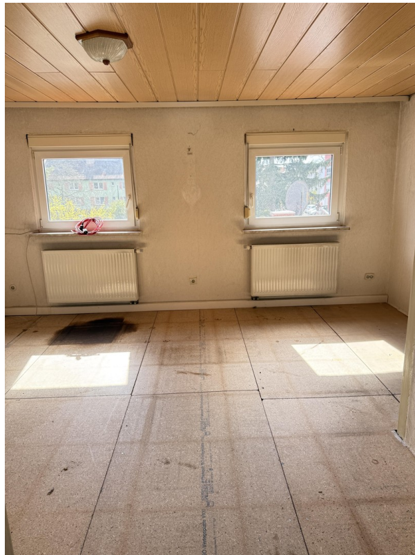
Zimmer Garten OG