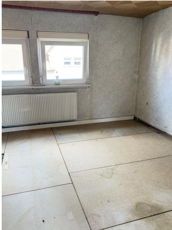
Zimmer Straße OG