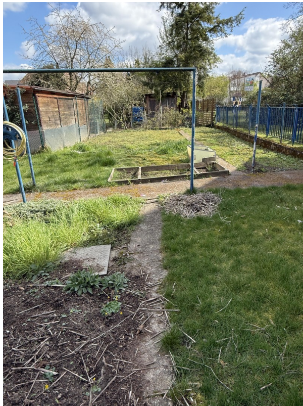
Garten linker Bereich