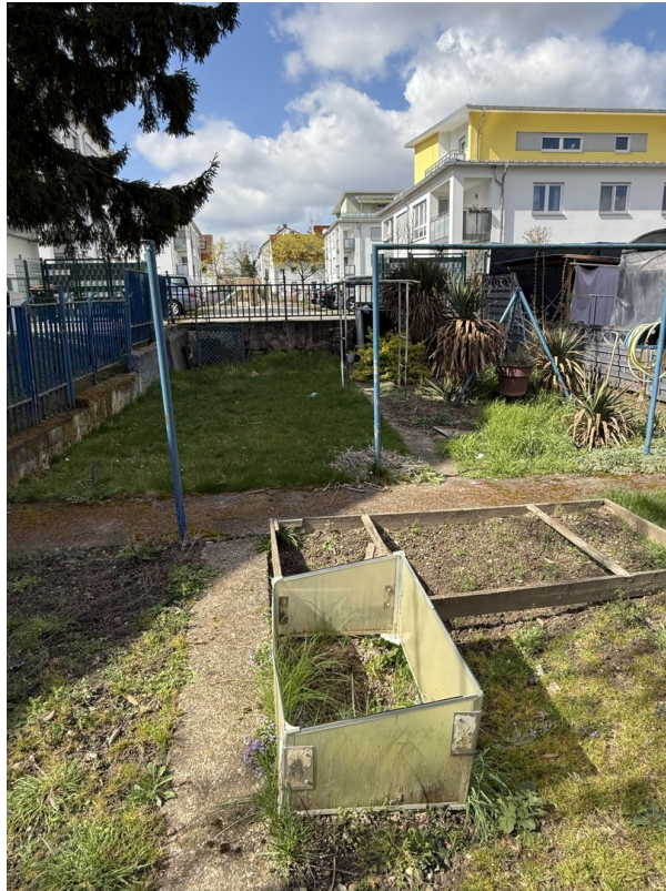
Garten rechter Bereich