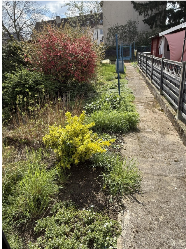
Ansicht zum Garten