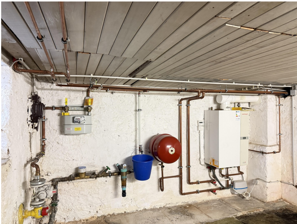
Heizung u. Hausanschlüsse