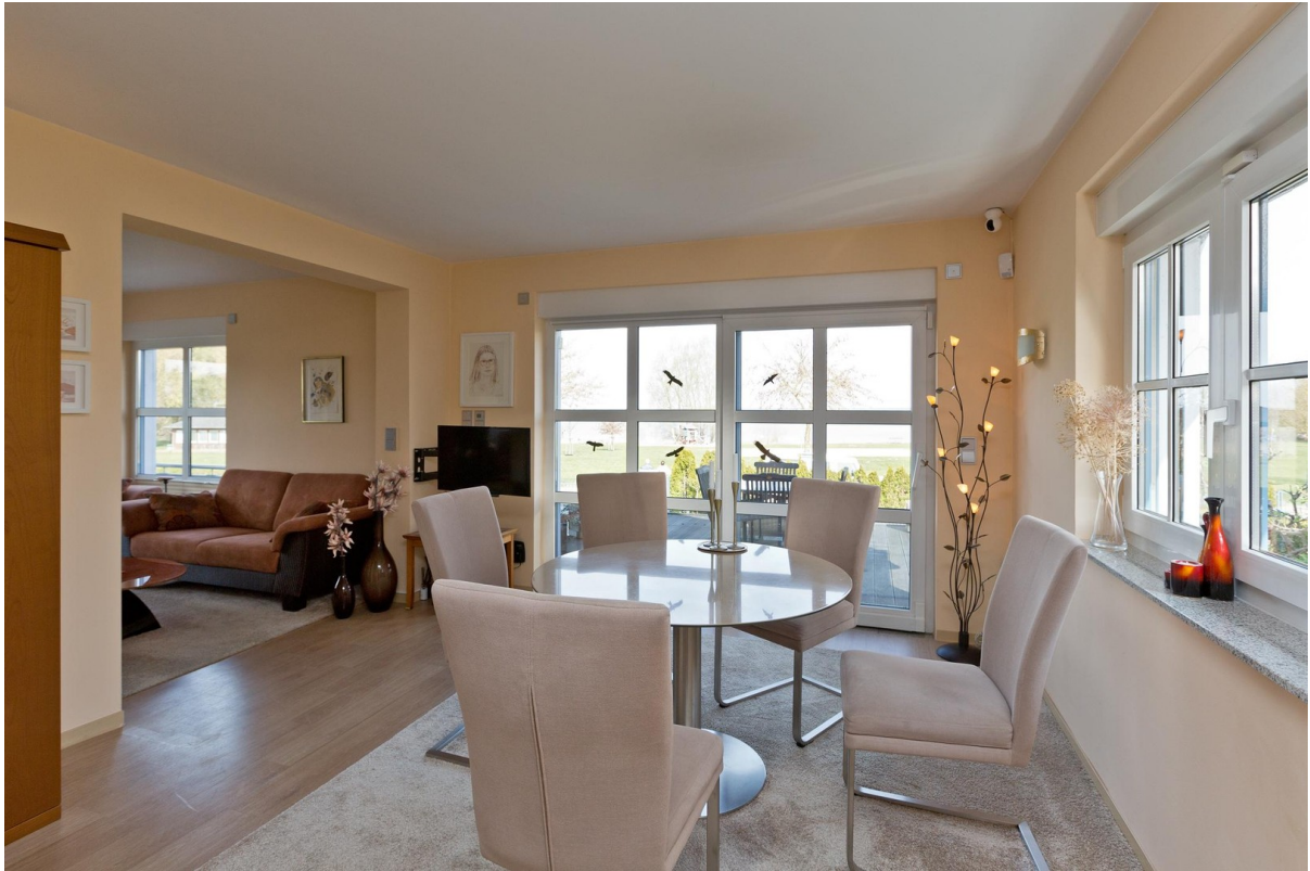
Wohnzimmer mit Esstisch