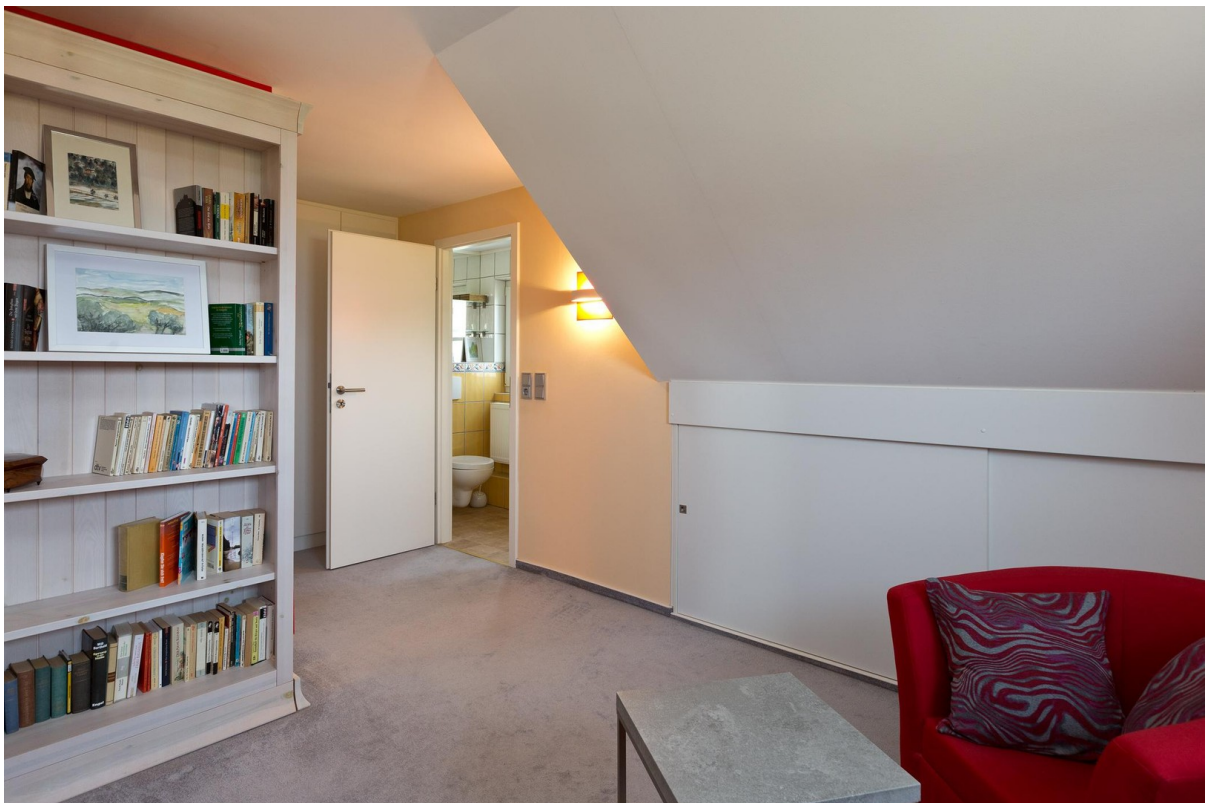
Schlafzimmer mit Sitzecke