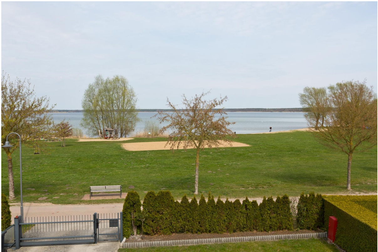
Seeblick Terrasse + Wohnzimmer