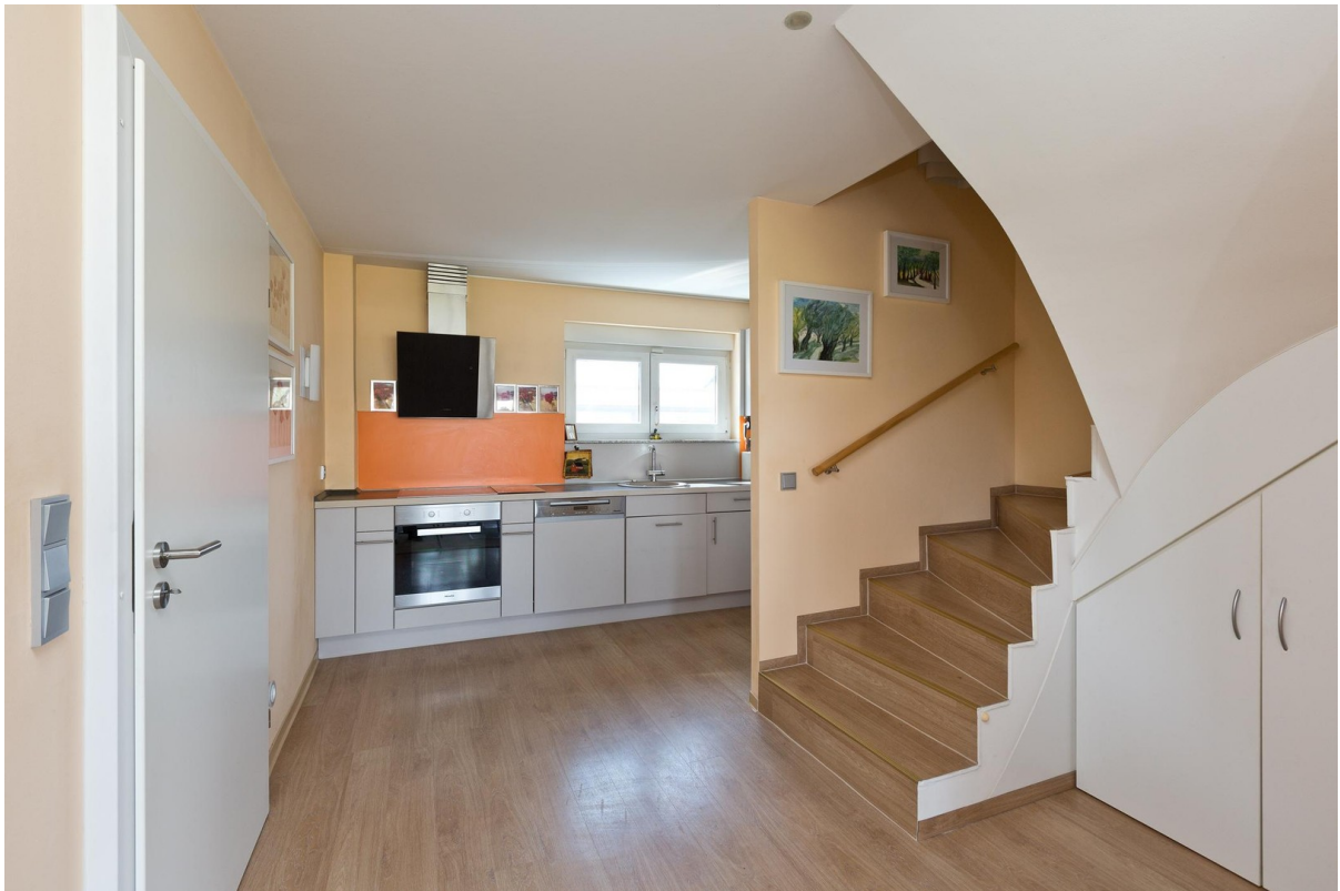
Küche mit Treppenhaus