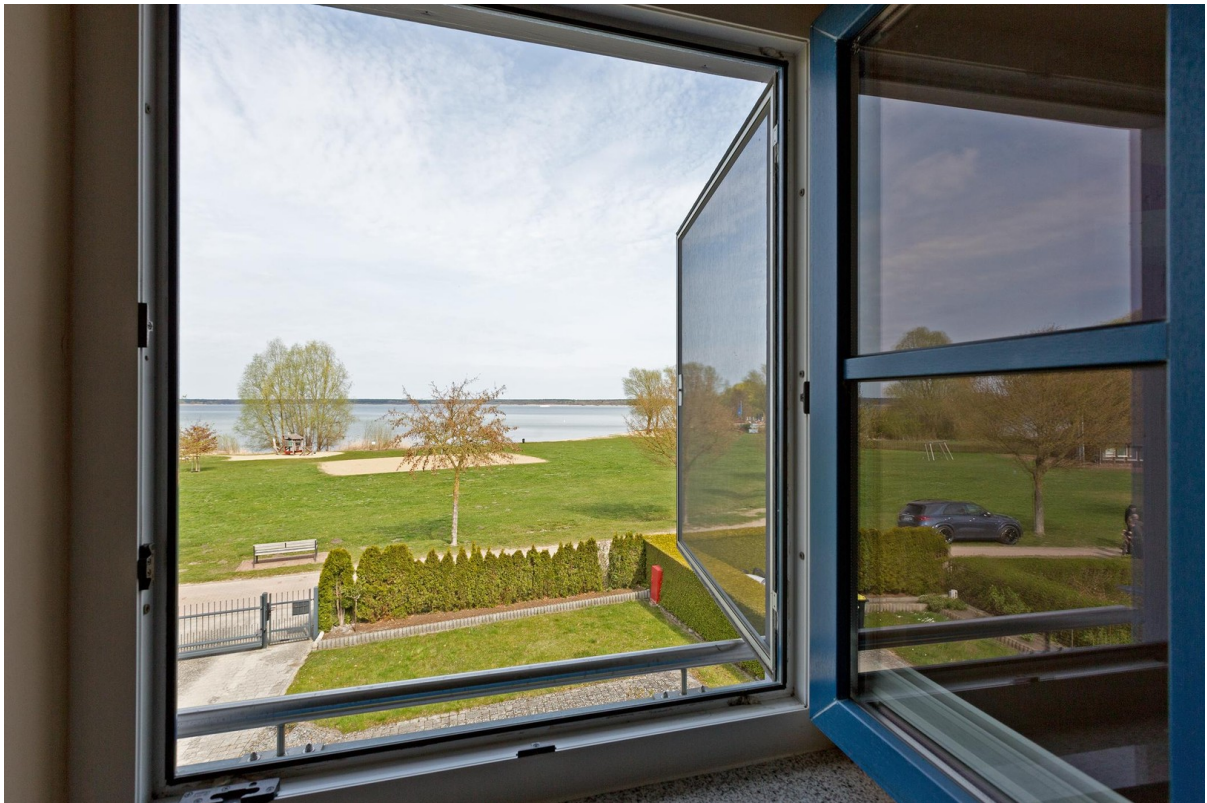
Blick aus dem Schlafzimmer