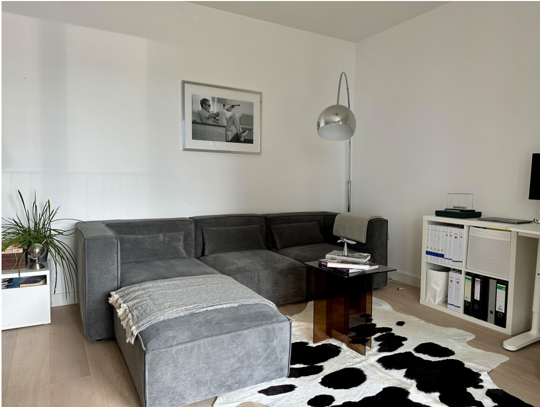
Blick in die Wohnzimmer