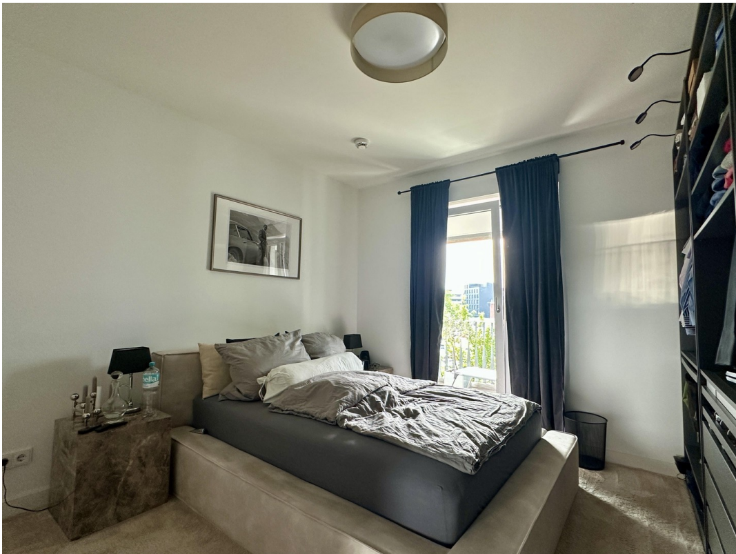
Blick ins Schlafzimmer