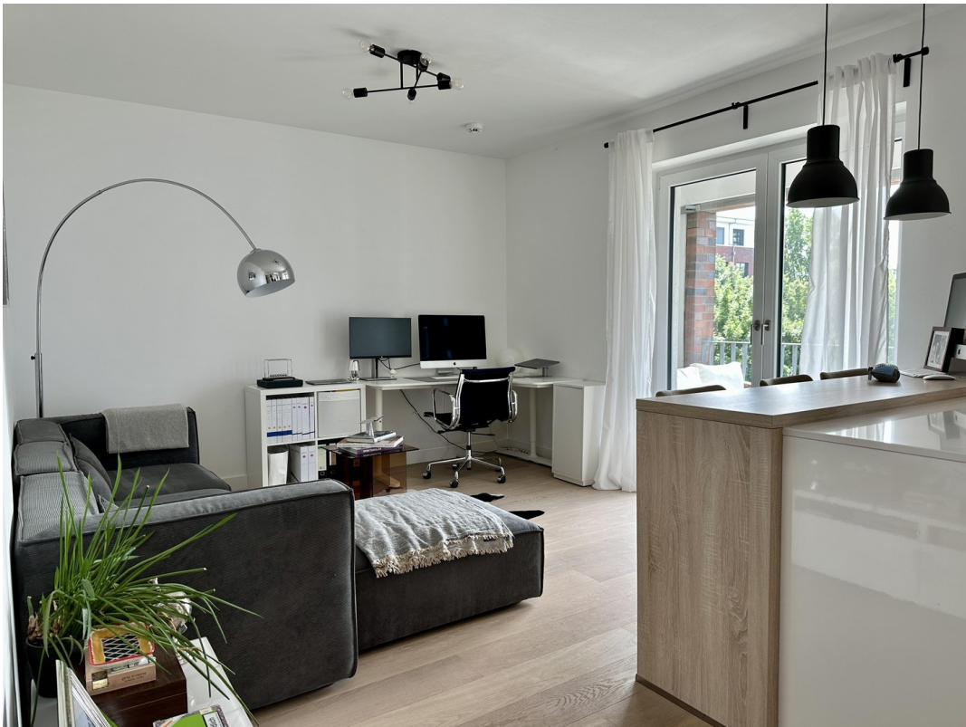
Blick in die Wohnzimmer