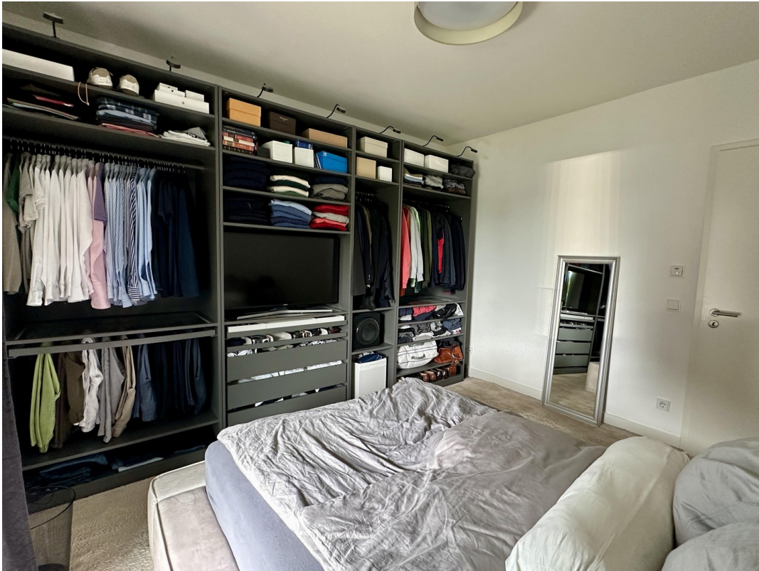
Blick ins Schlafzimmer