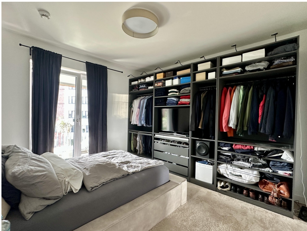
Blick ins Schlafzimmer