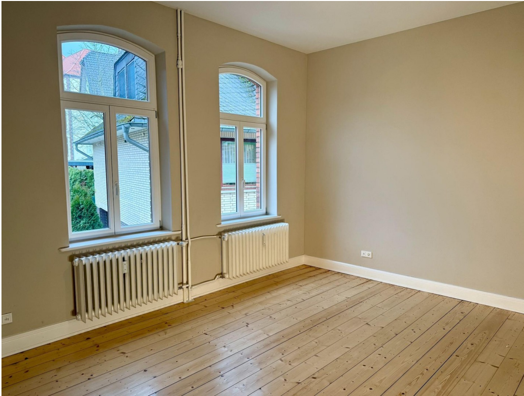
Zimmer 2 mit Anbau