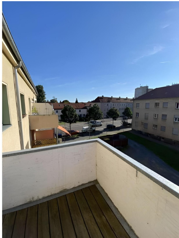
Blick vom Balkon 2