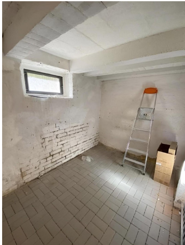
Kellerabteil Wohnung 1