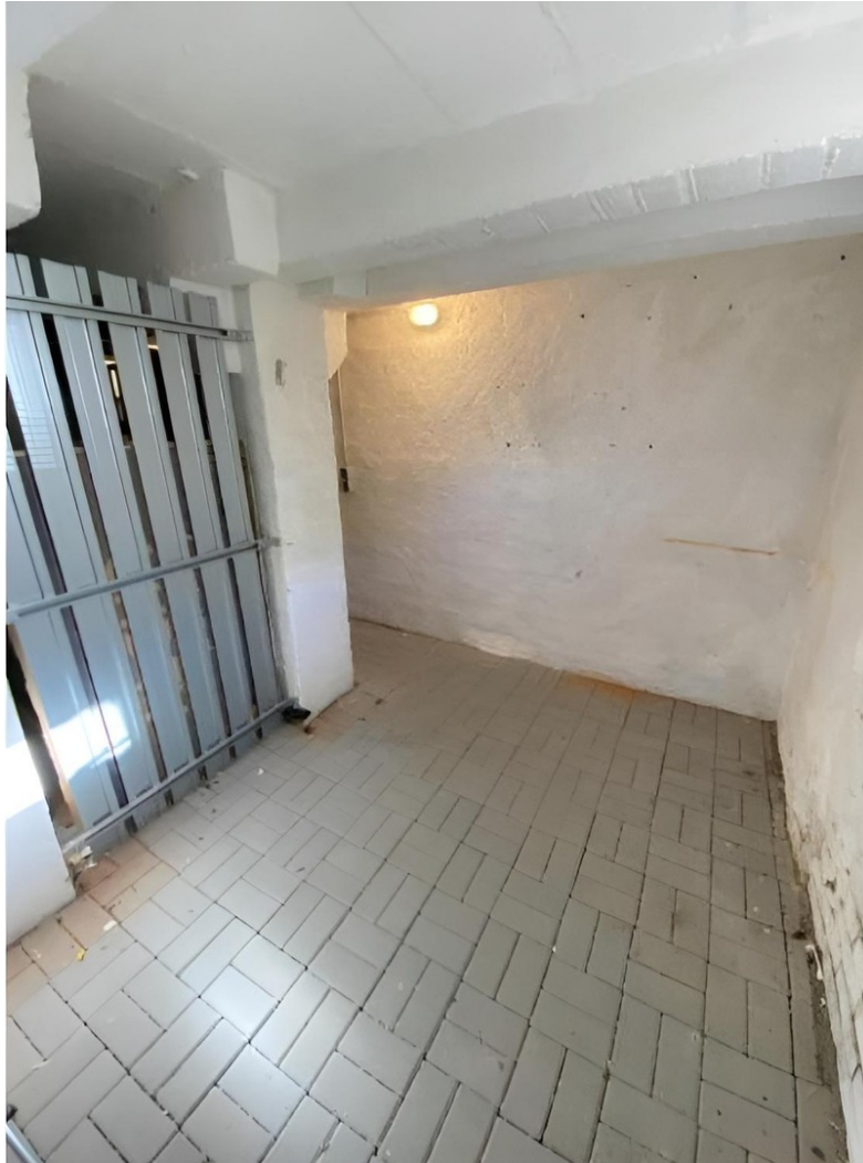
Kellerabteil Wohnung 2