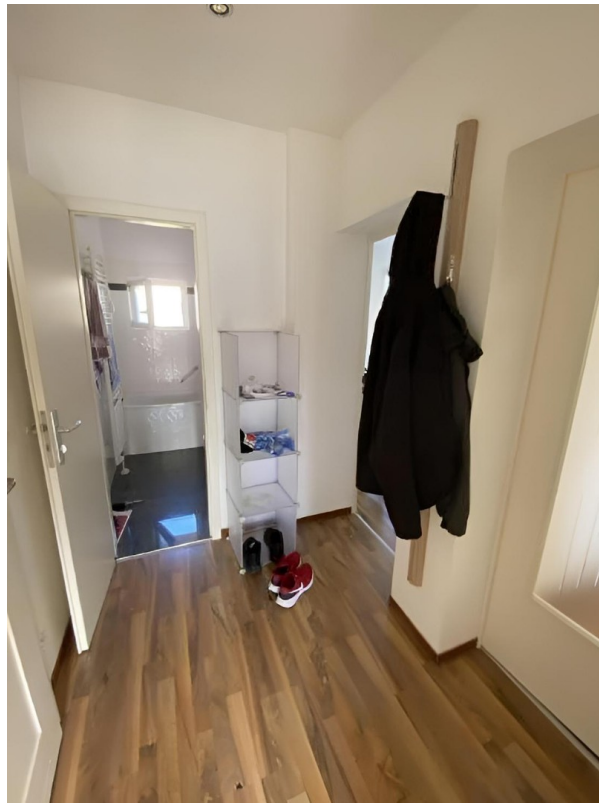
Diele / Flur