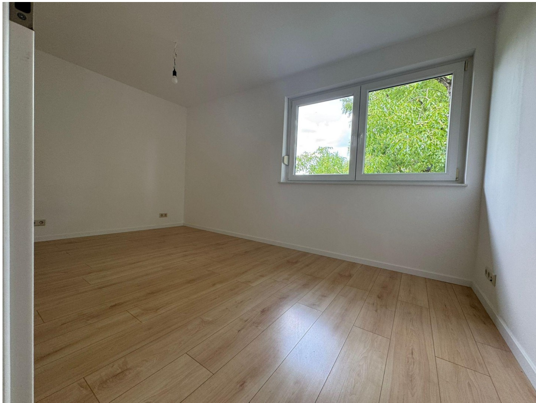
Praktisches 2. Schlafzimmer