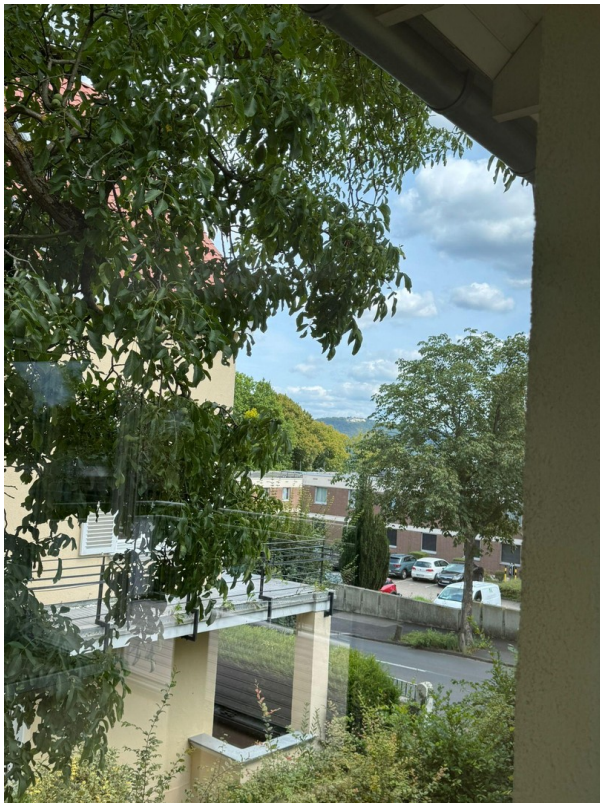
Ausblick zum Petersberg