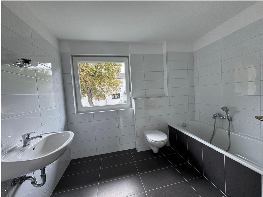
Großes en-suite Wannenbad