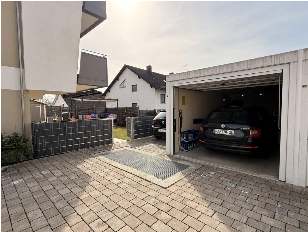
Garage / Stellplatz