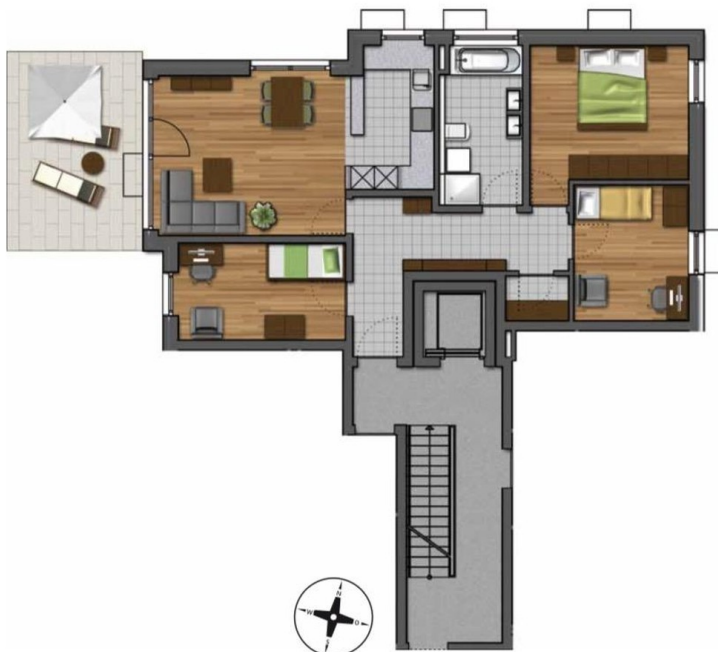
Terrassen-Wohnungen mit traumhafter Aussicht Wohnung B4 | 4-ZKB | Erdgeschoss