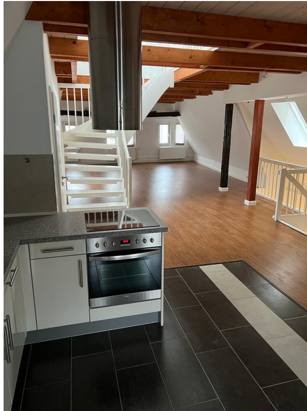
Blick ins Wohnzimmer