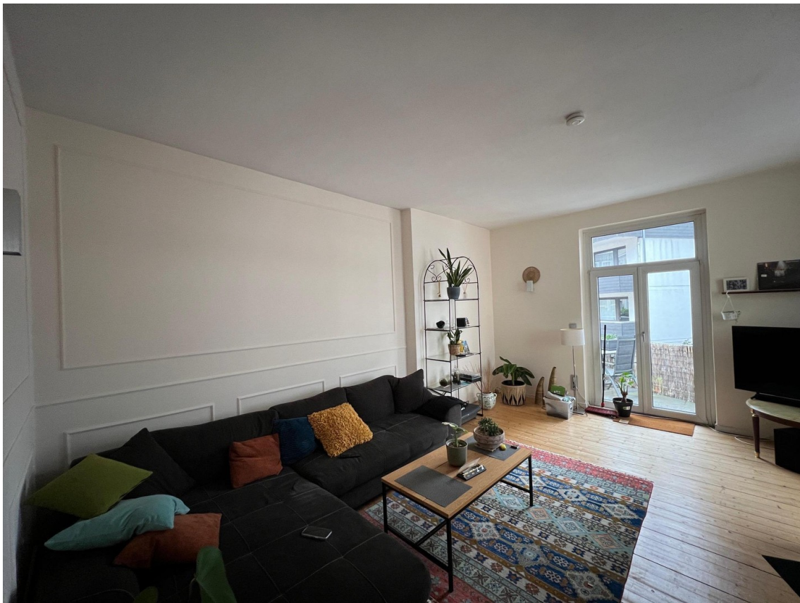
Wohnzimmer (oder WG Zimmer)