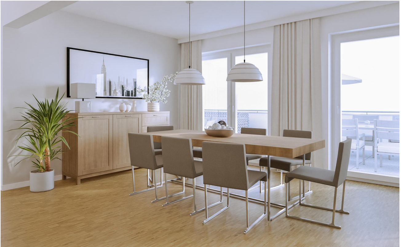
Offene Küche und Essbereich