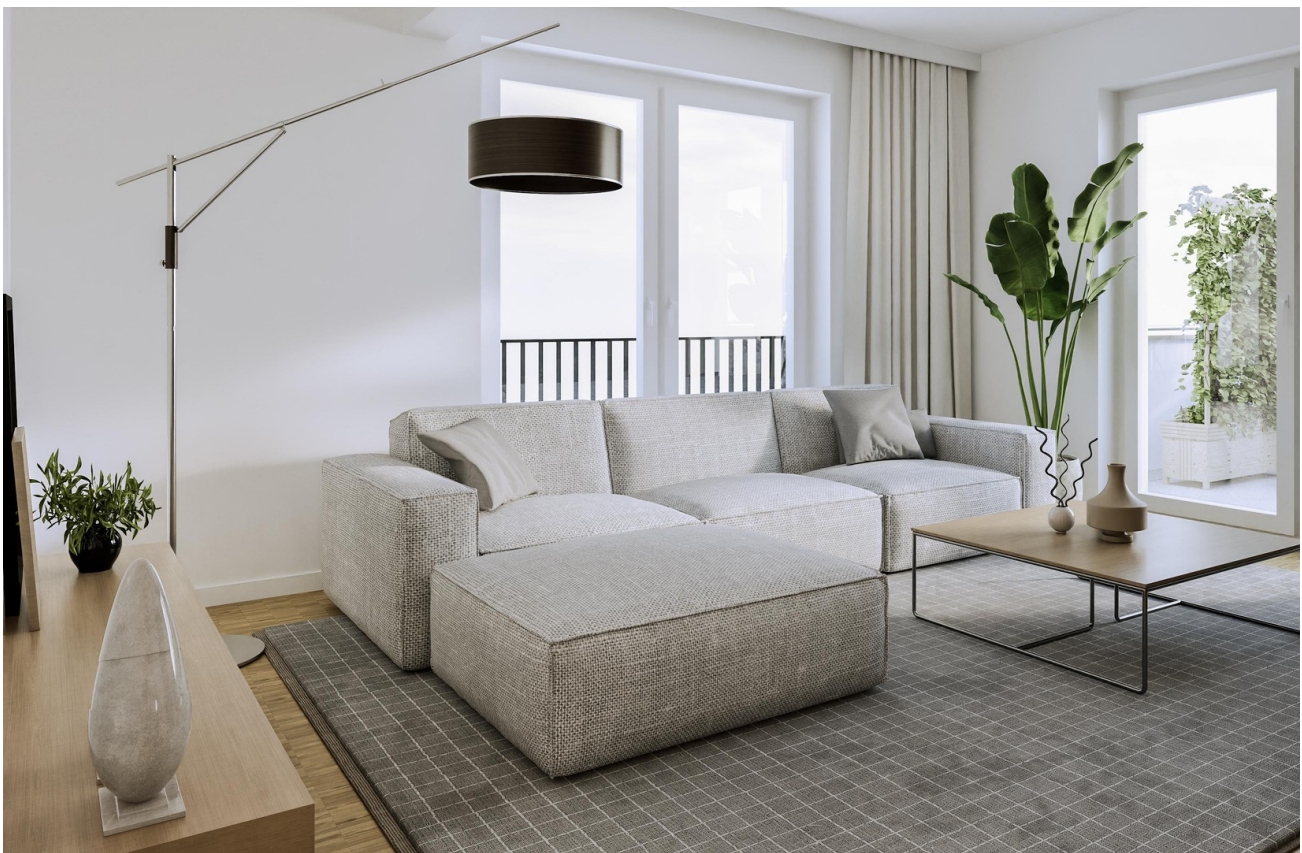
Wohnen mit Aussicht