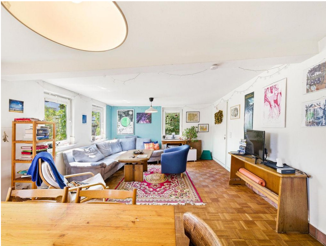
Wohnzimmer EG 1