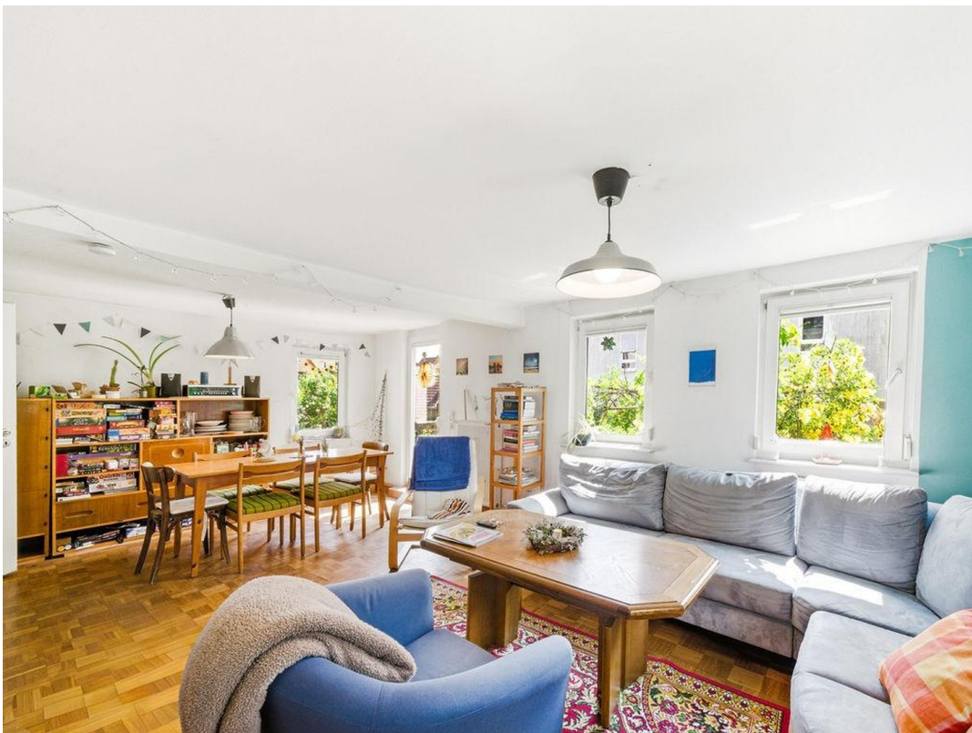
Wohnzimmer EG 2