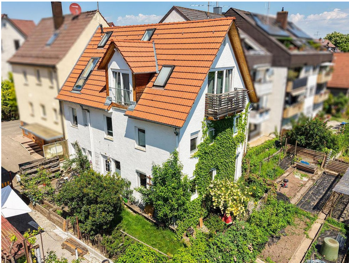
Haus Bild 2