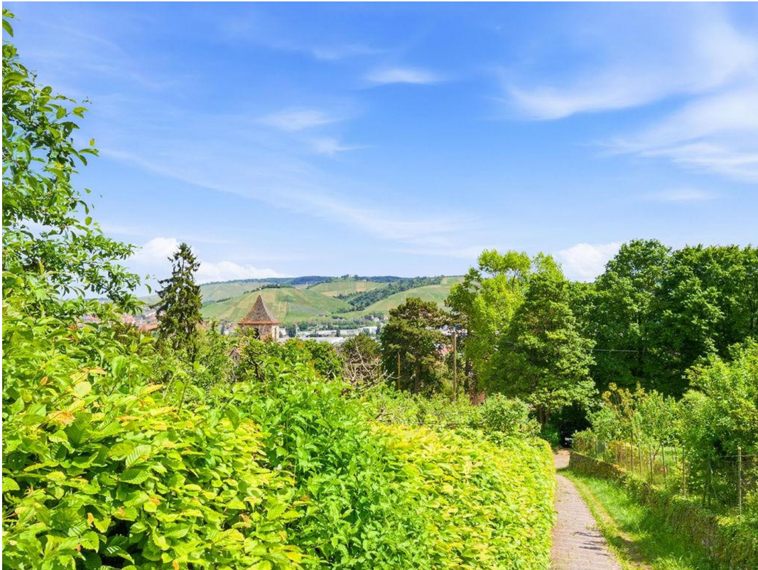
Aussicht Wangener Höhe