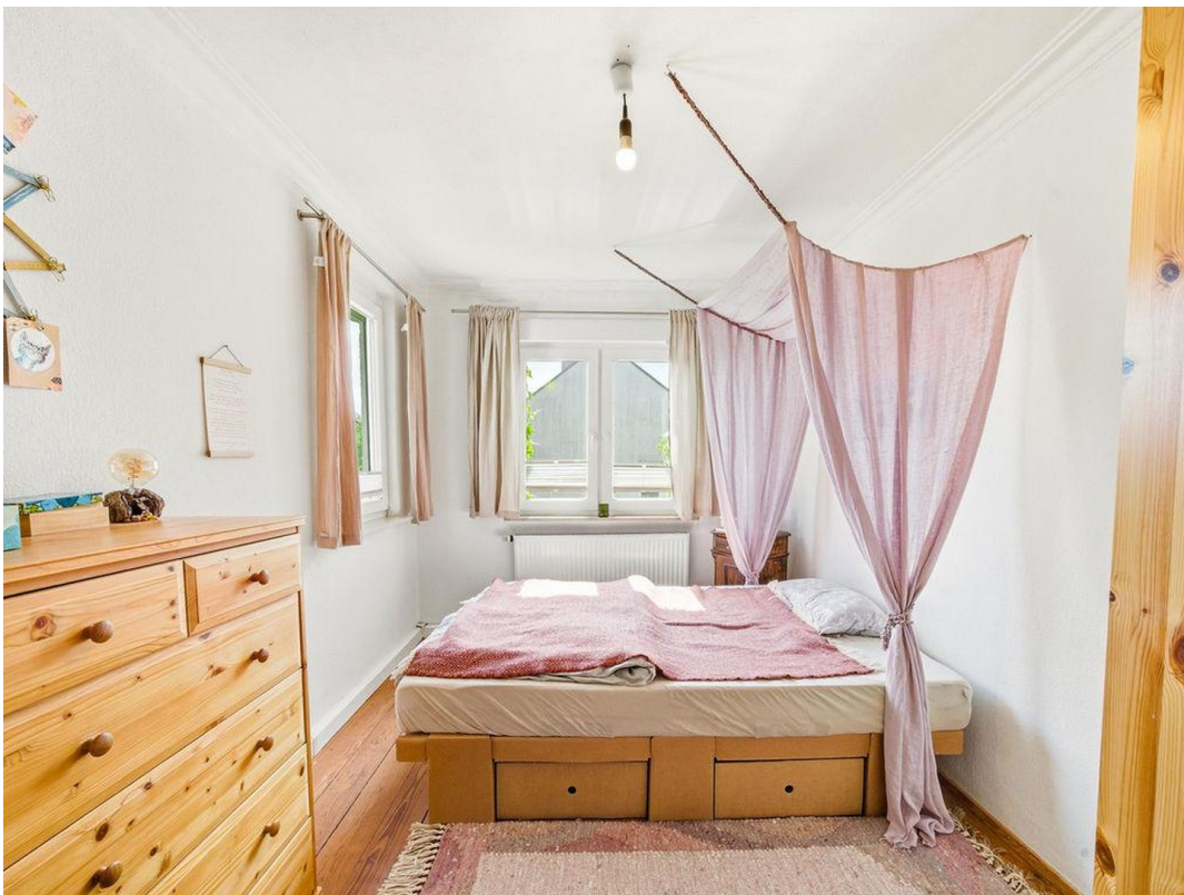
Zimmer 2 im 1. OG