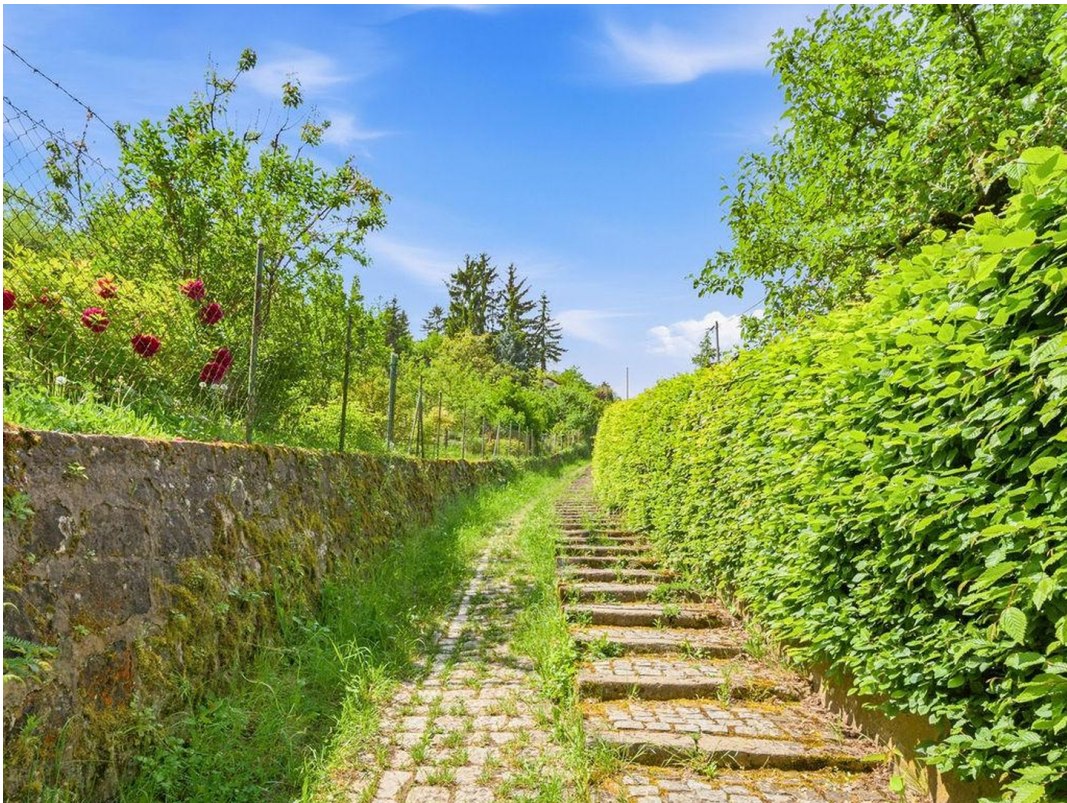
Weg Wangener Höhe