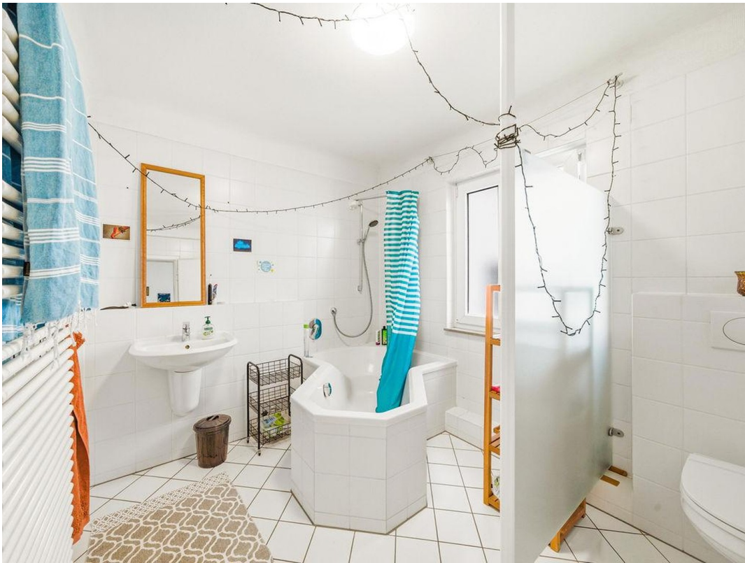
Bad im 1. OG