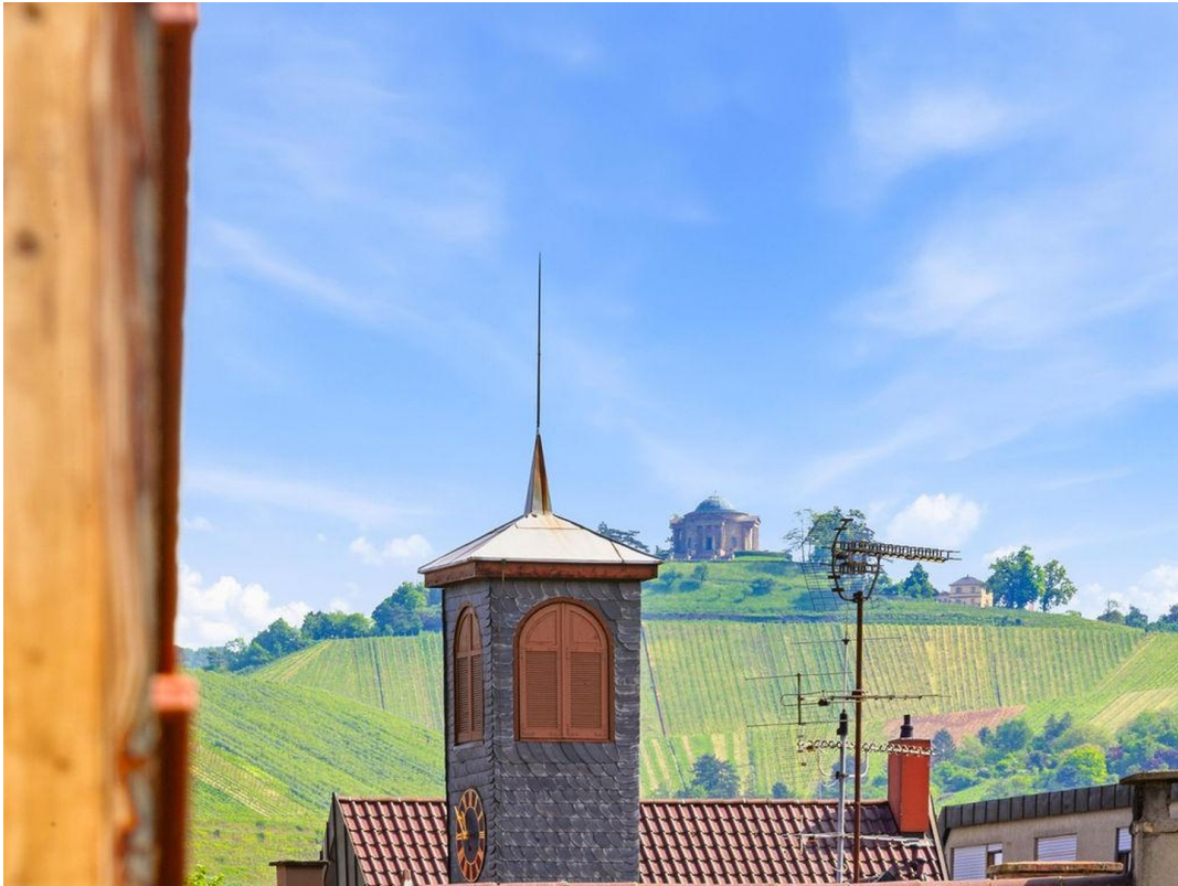
Fernsicht Balkon Grabkapelle