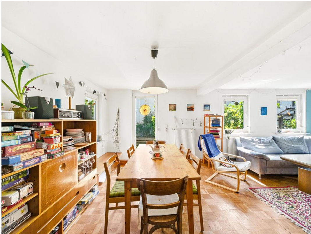
Wohnzimmer EG 3