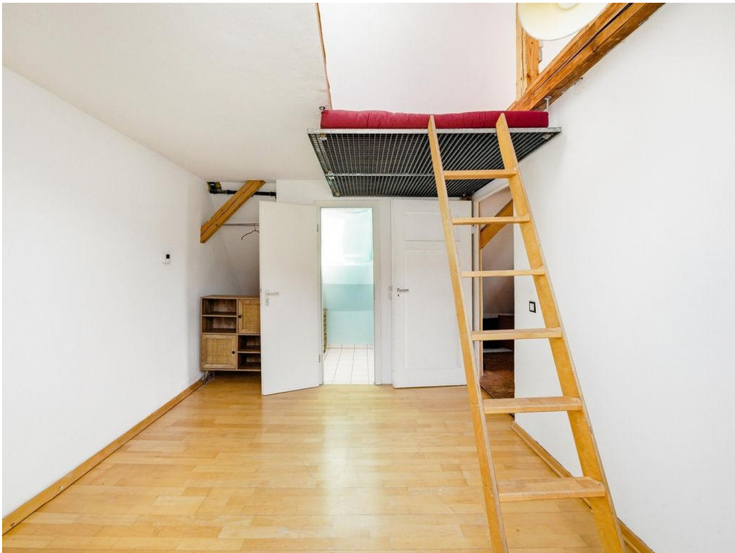
Kl. Zimmer DG mit Empore