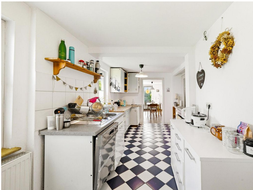
Küche EG 1