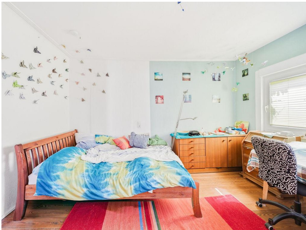
Zimmer 3 im 1. OG