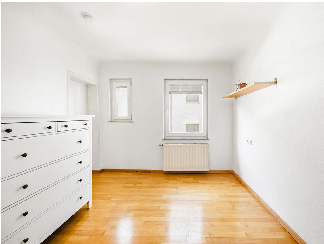
Zimmer 1 im 1. OG