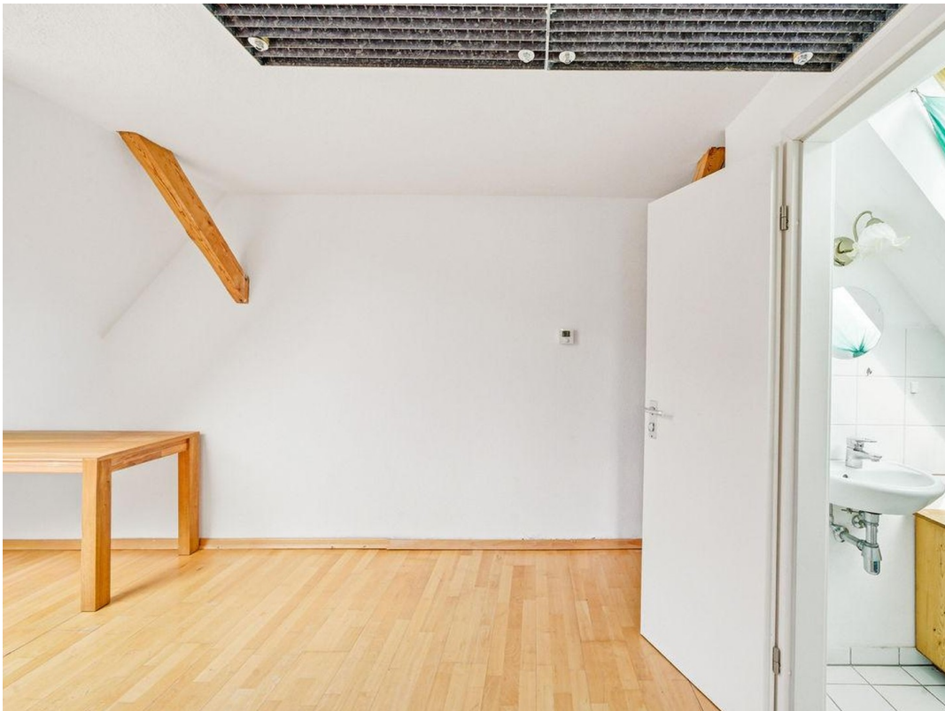
kl.Zimmer DG mit Minibad