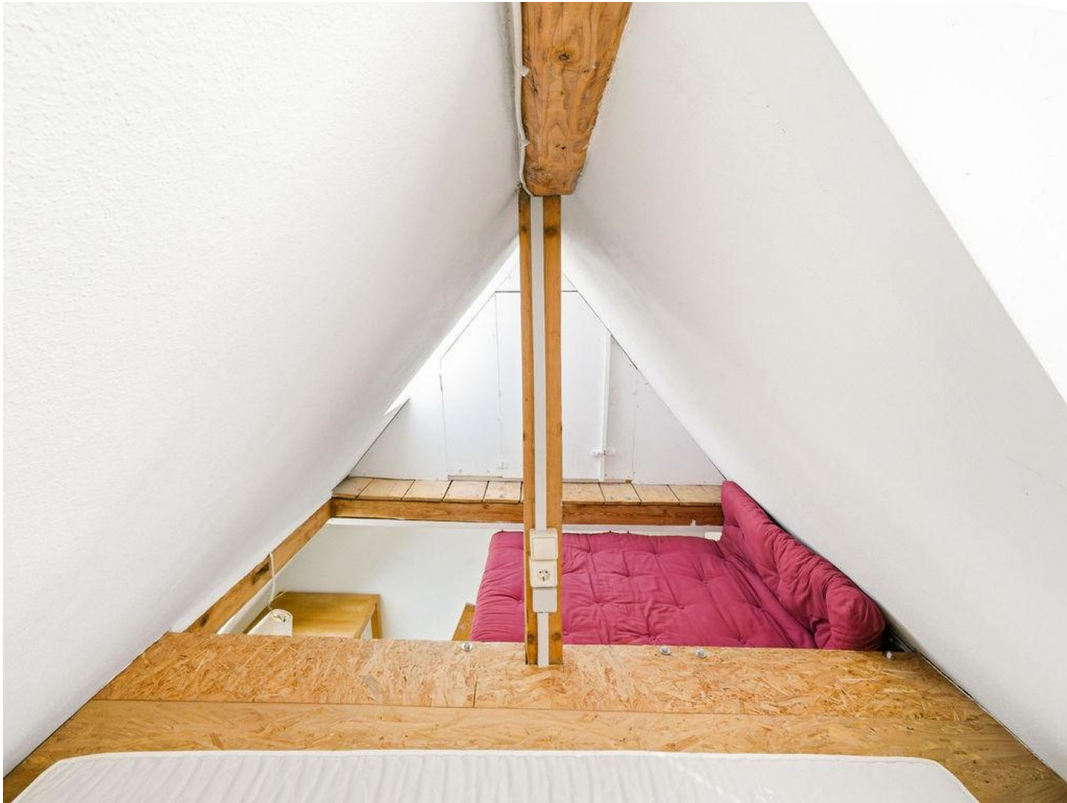
Kl. Zimmer DG Empore