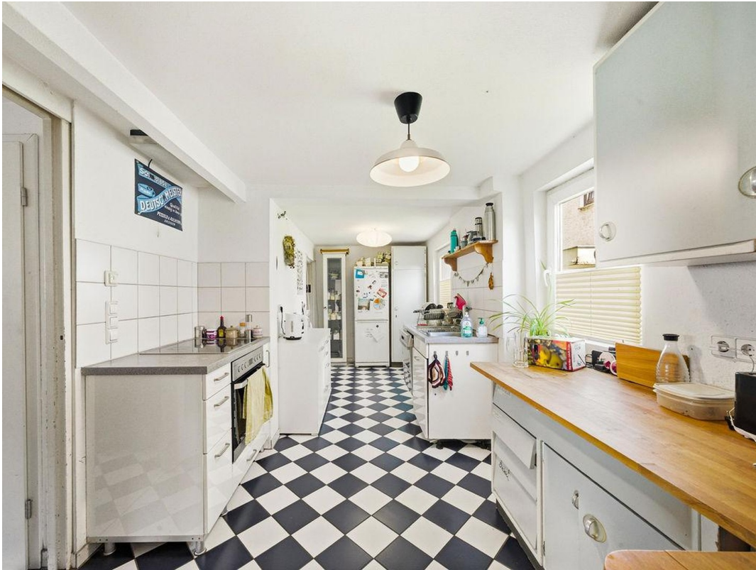
Küche EG 2