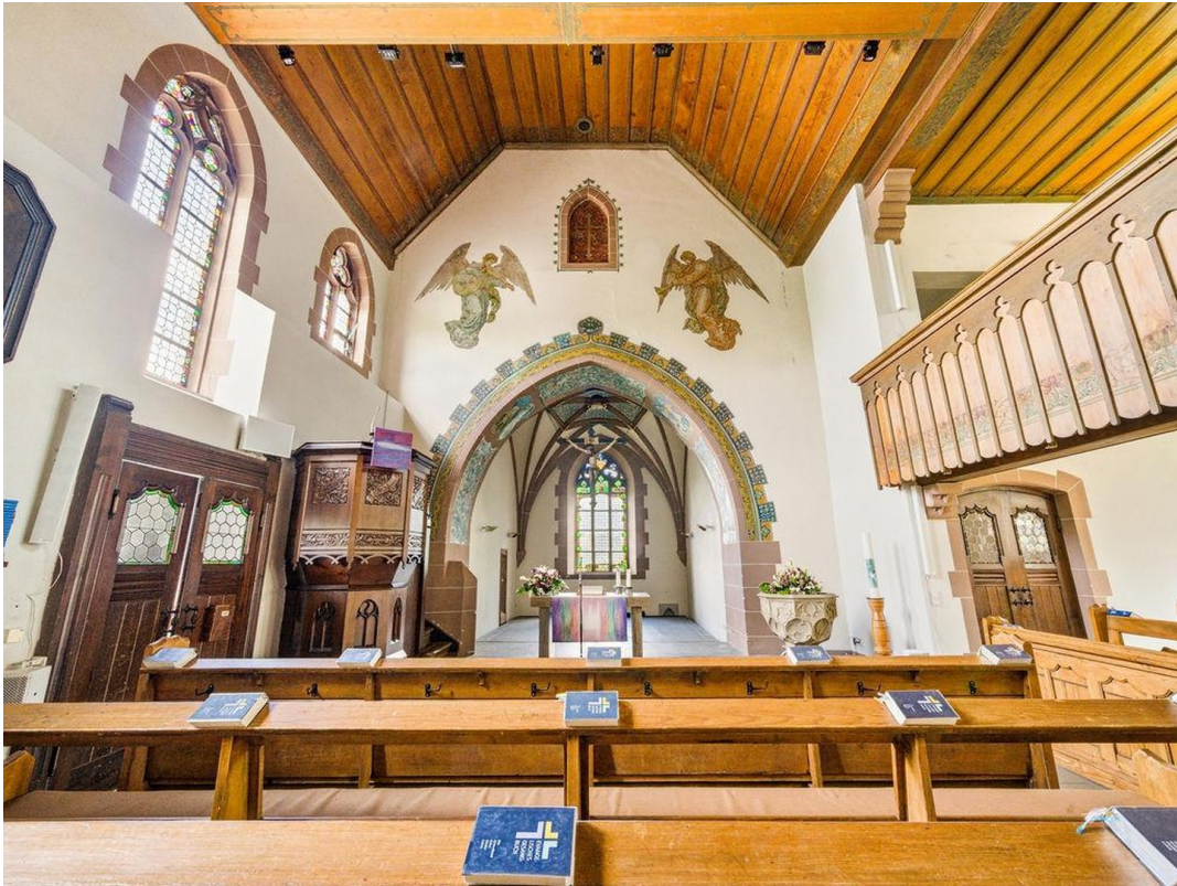
Michaelskirche 200m Entfernung