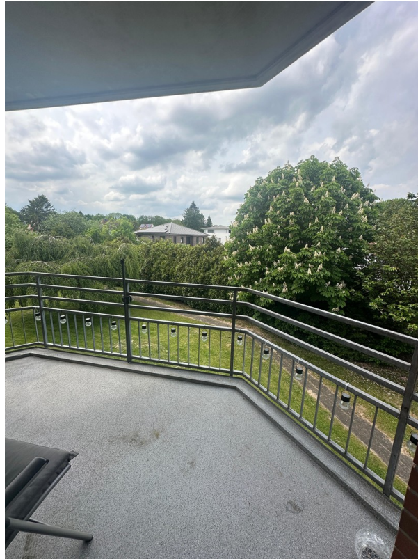
Balkon vom Wohnzimmer2