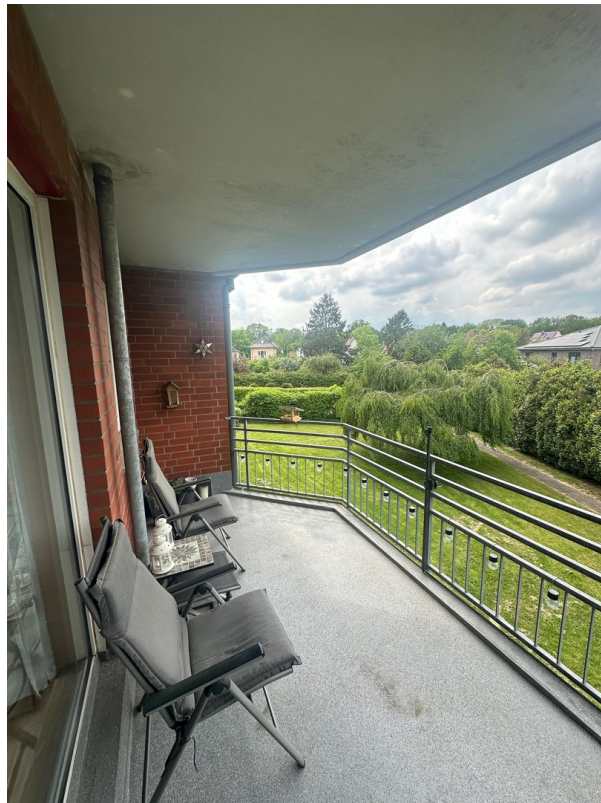
Balkon vom Wohnzimmer1