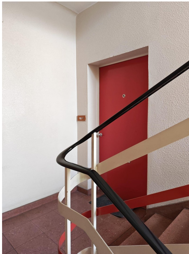
Tür zur Wohnung