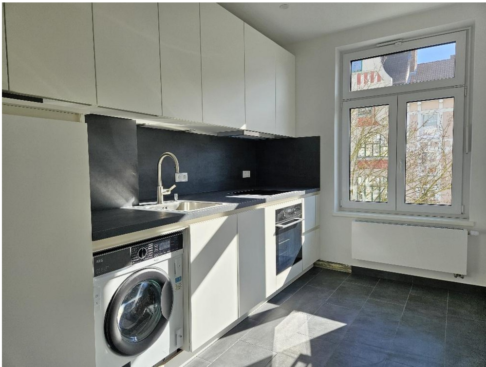
Küche inkl. Waschtrockner