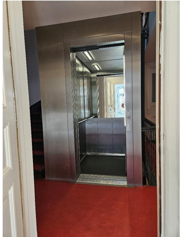
Aufzug / Treppenhaus