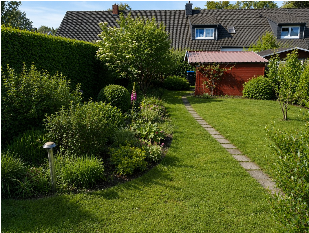
Garten mit Gartenhaus