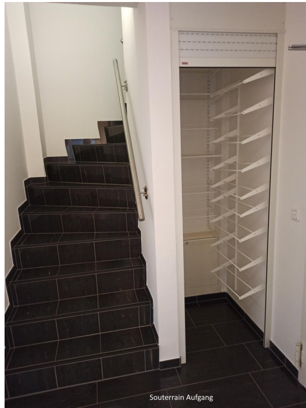
Treppe vom Souterrain zum EG