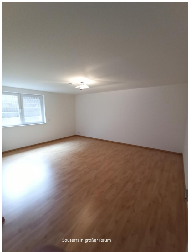
Souterrain großer Raum