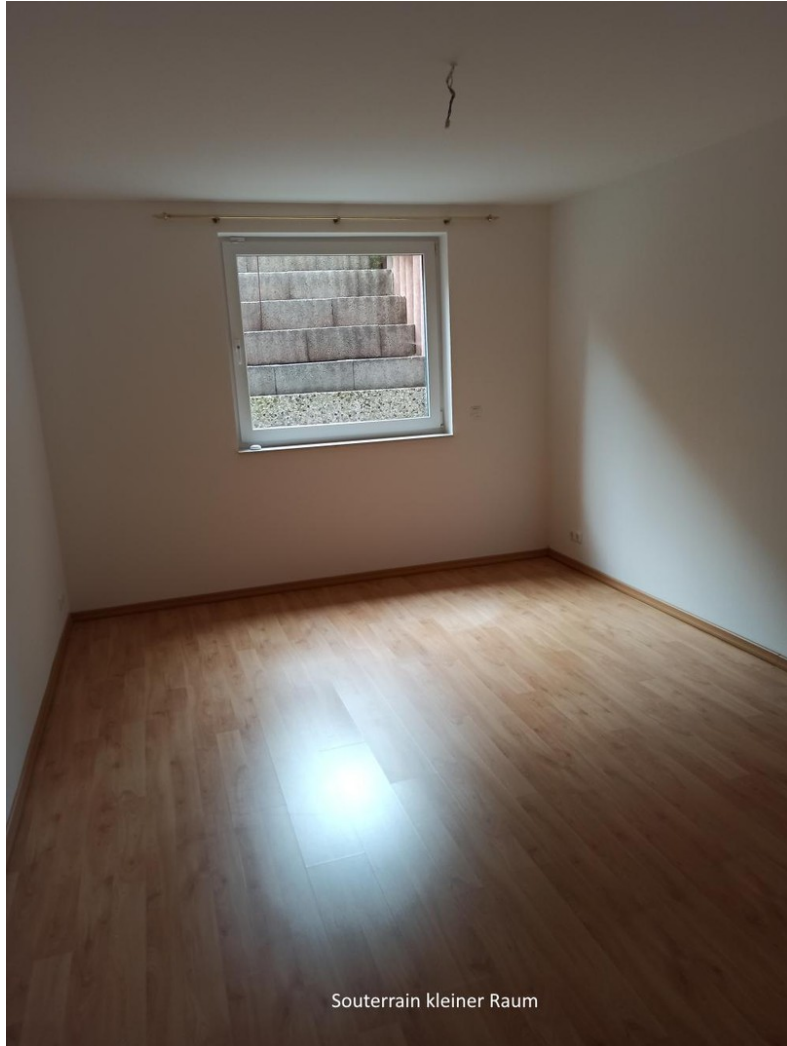
Souterrain kleiner Raum