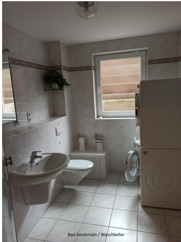
Bad Souterrain / Waschkeller