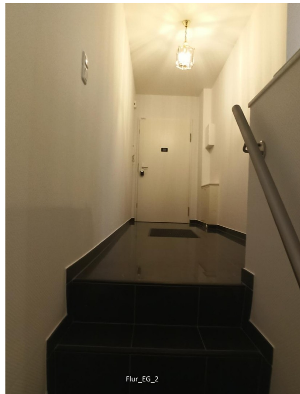
Flur EG 2