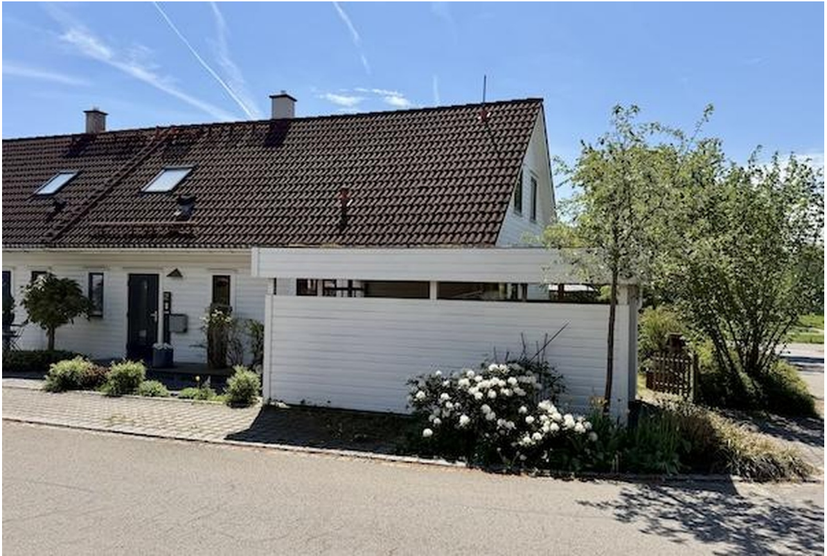
Blick auf Carport