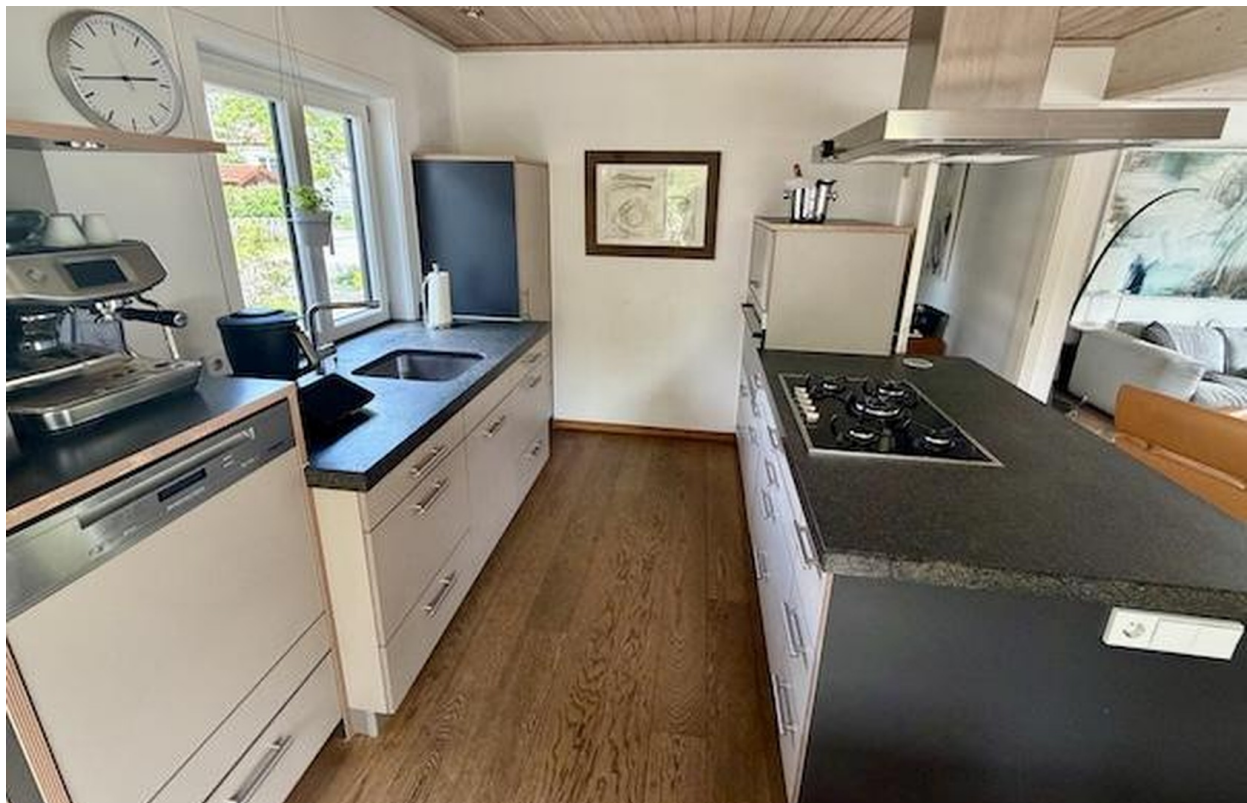
Offene Küche im EG