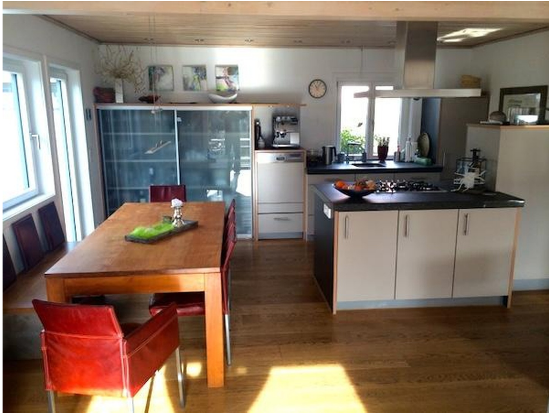
Küche mit Insel im EG