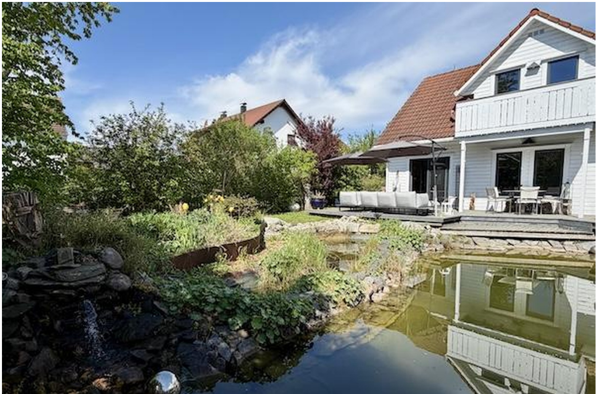
Blick über Teich auf Terrasse