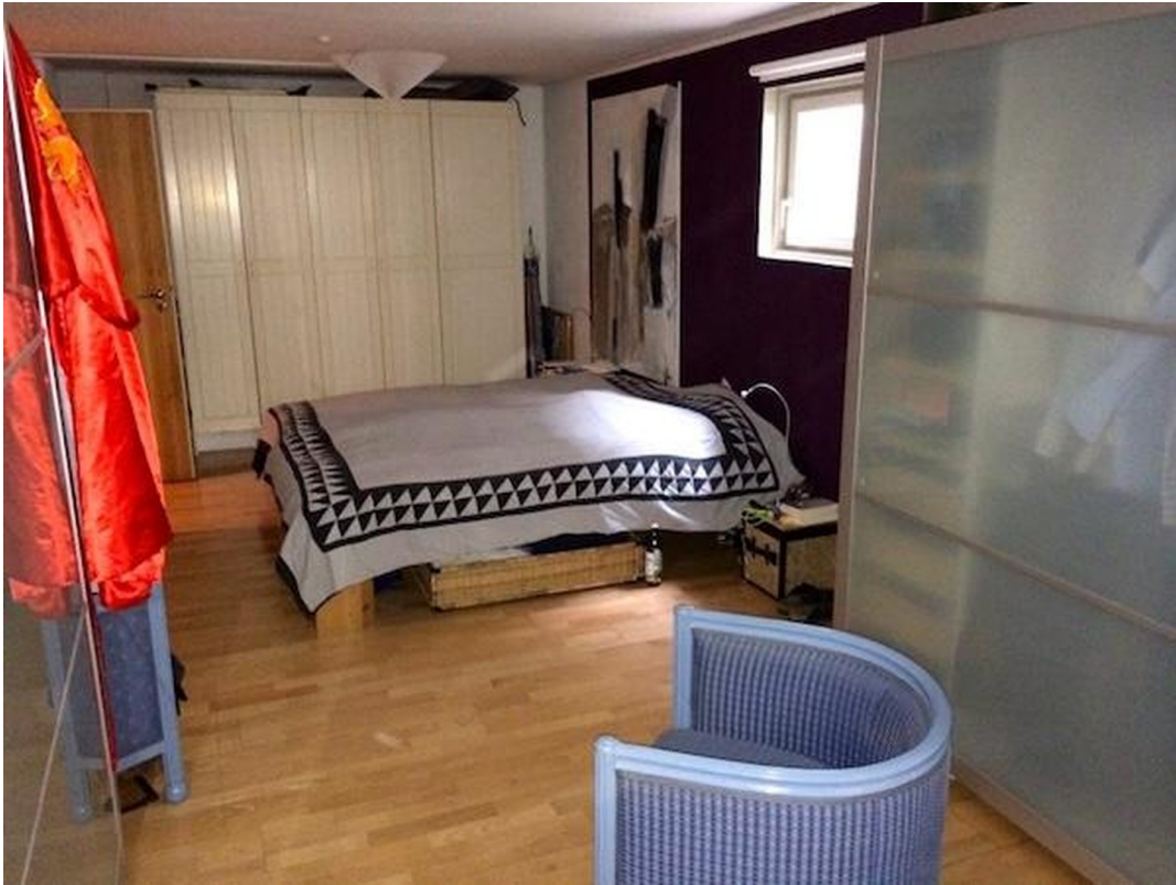
Schlafzimmer im KG