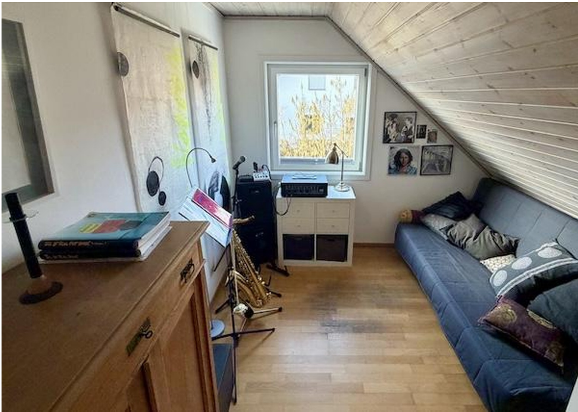
Schlafzimmer 3 im OG