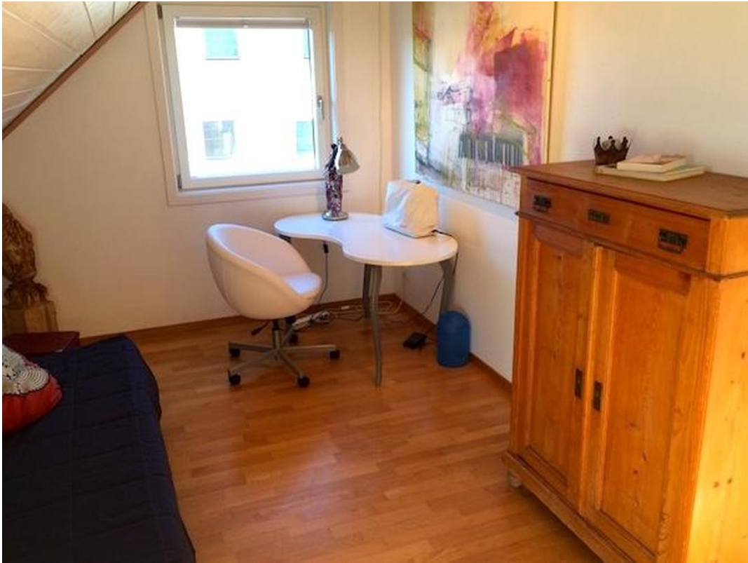
Schlafzimmer 2 im OG