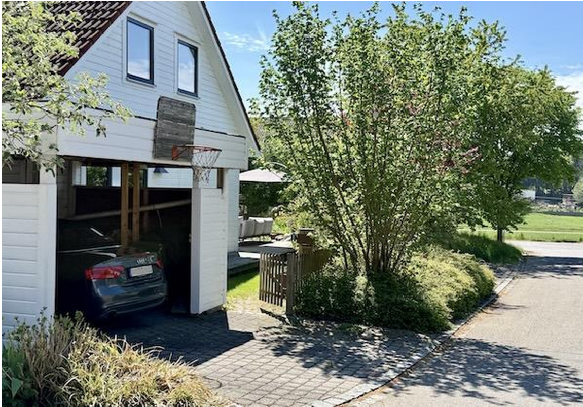
Blick von Strasse auf Carport