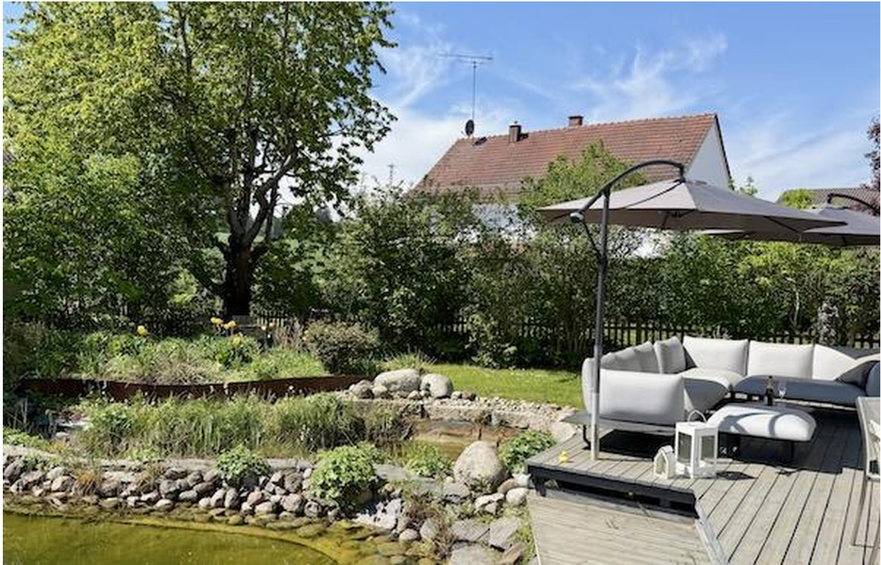
Blick von Osten auf Garten