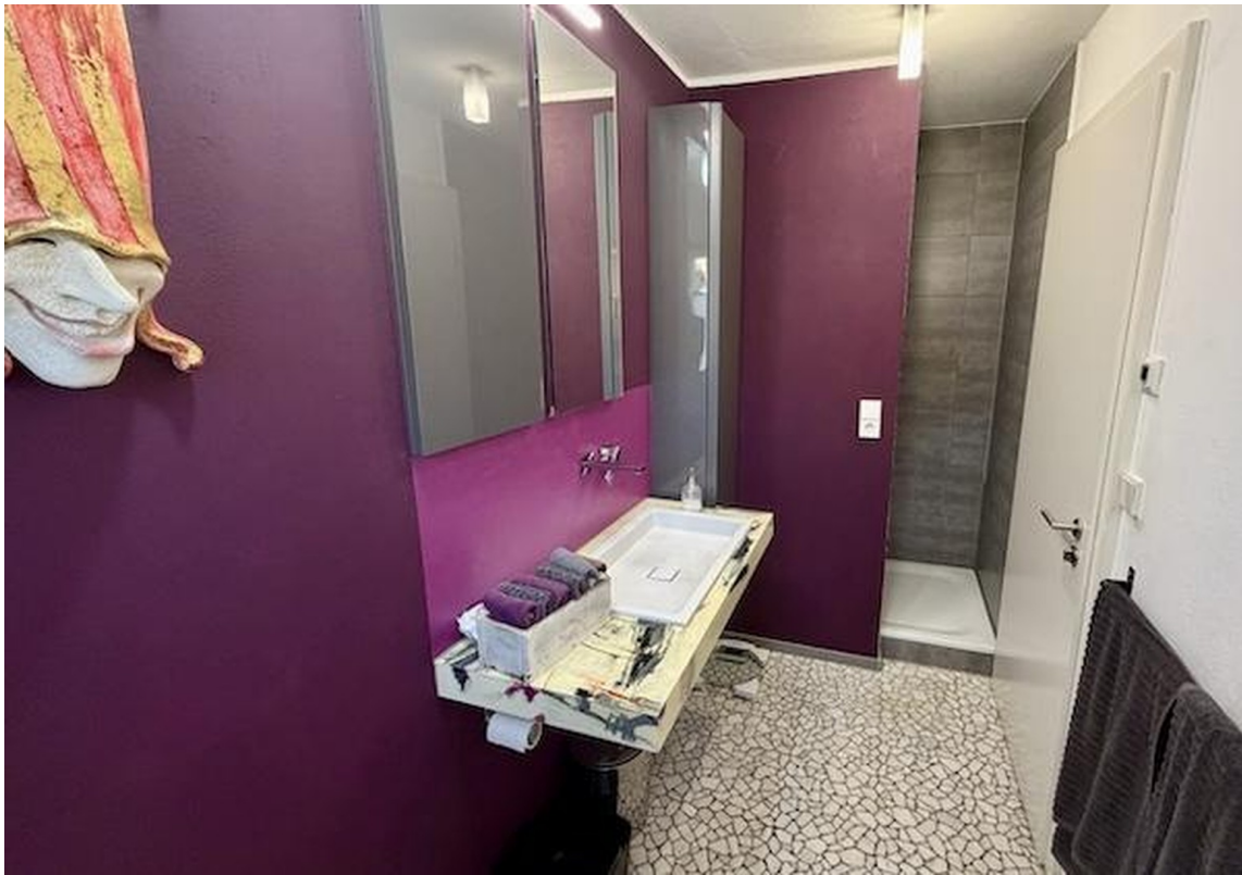
Gäste-WC mit Dusche im EG