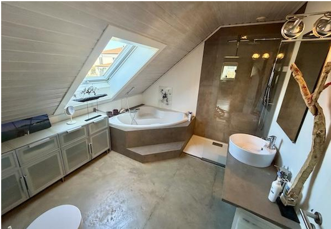
Badezimmer im OG