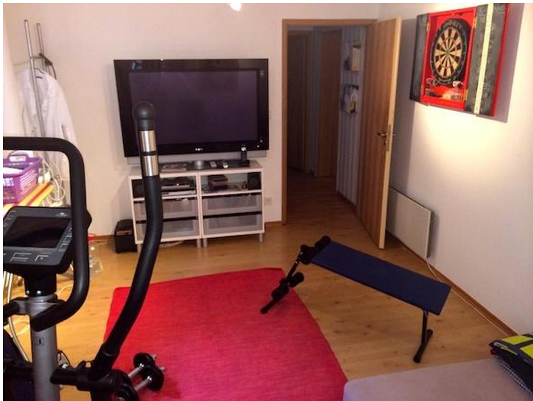
Mehrzweckraum im KG