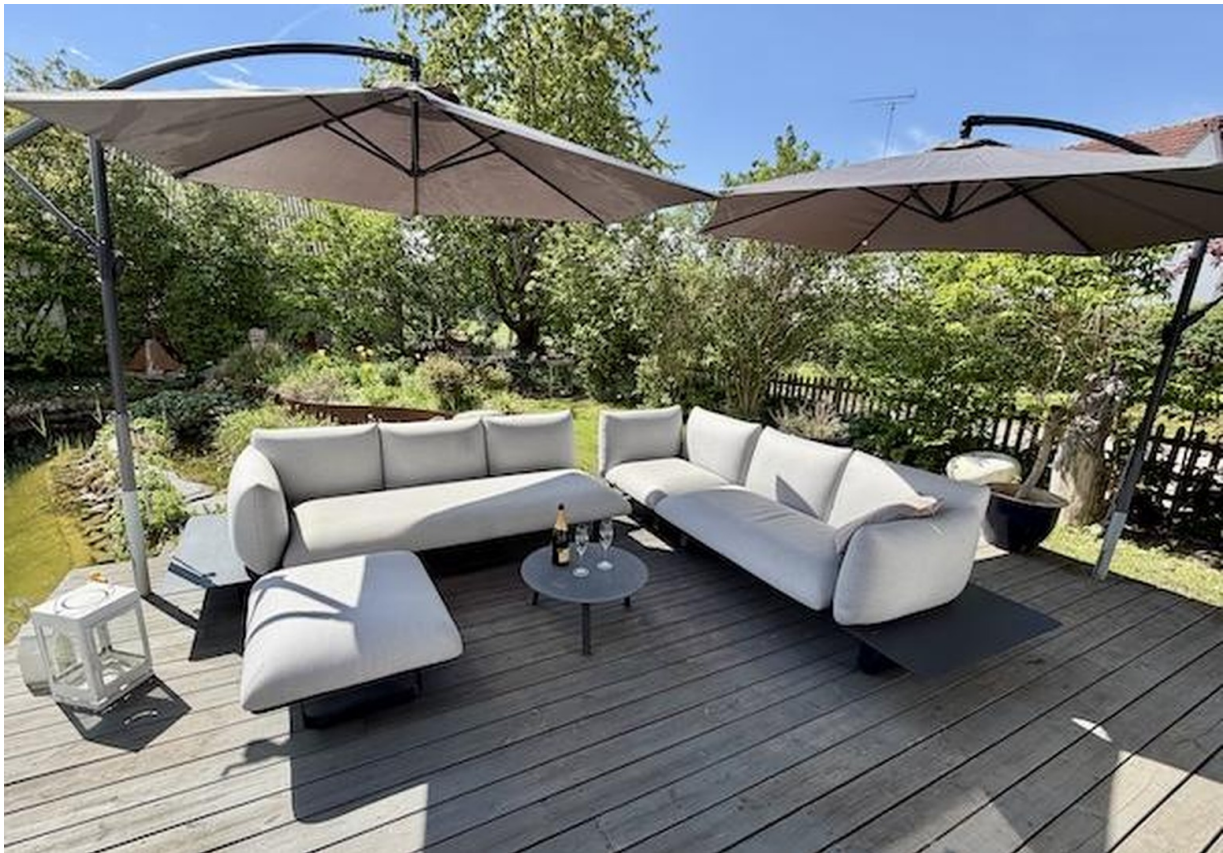
Blick Wohnzimmer auf Garten