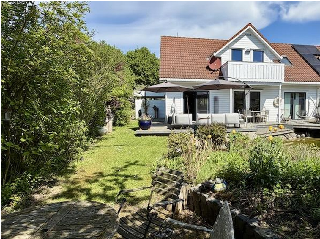
Blick von Feuerstelle auf Haus