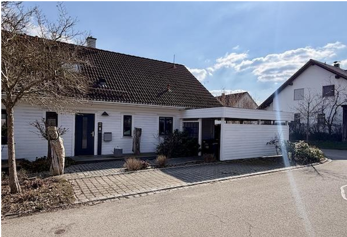
Blick von Nordseite