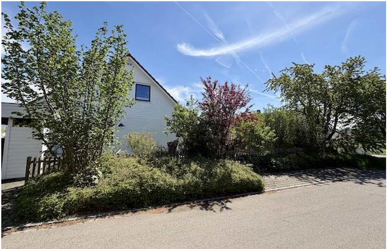
Blick von Westen