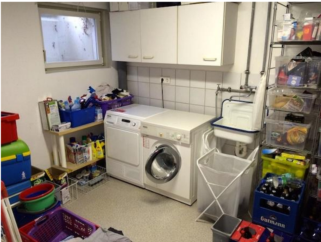
Waschküche im KG