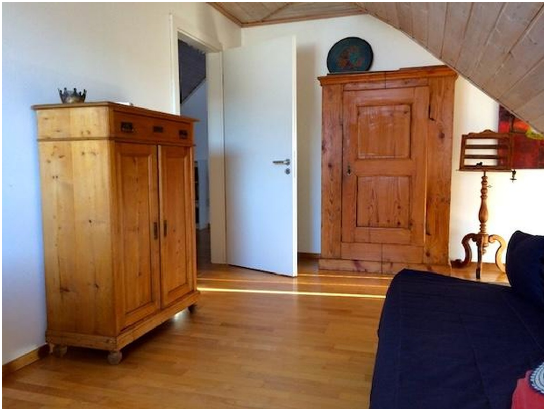
Schlafzimmer 2 im OG