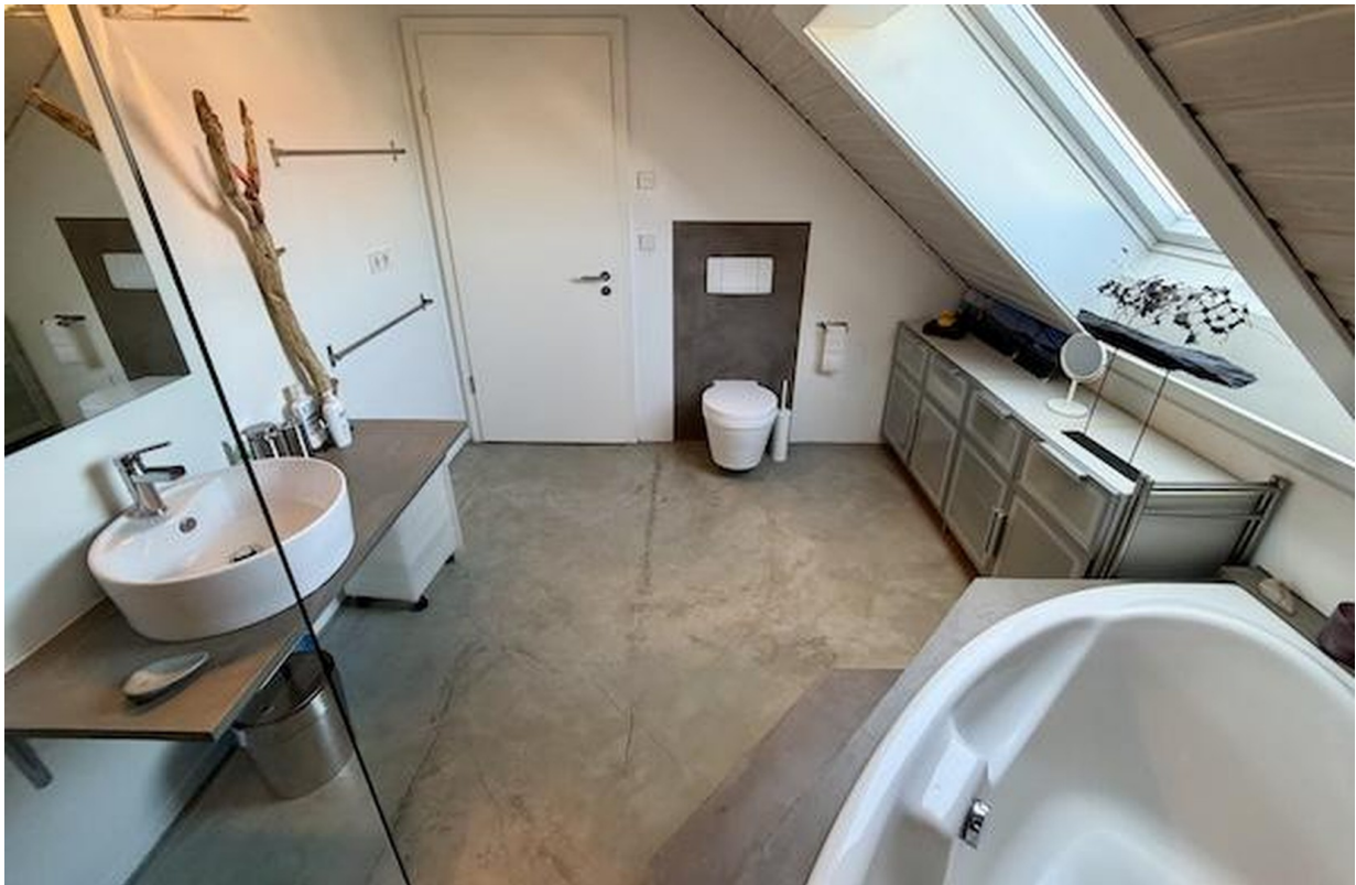
Badezimmer im OG