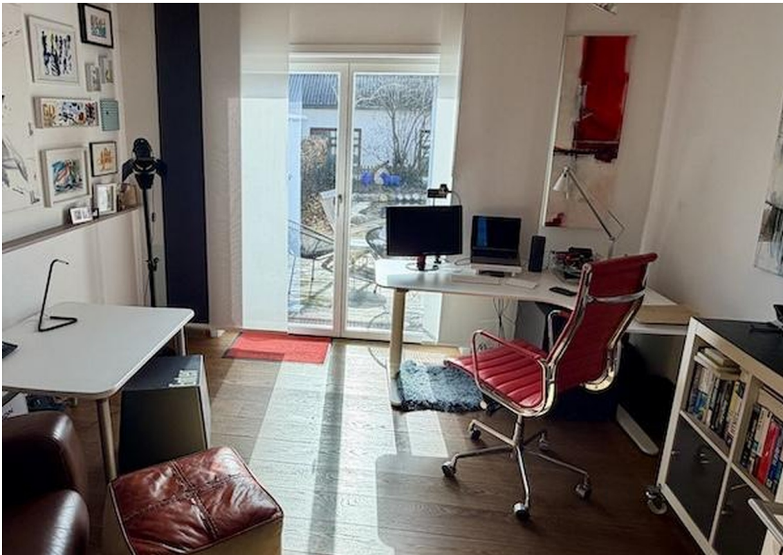
Arbeits-/Schlafzimmer im EG