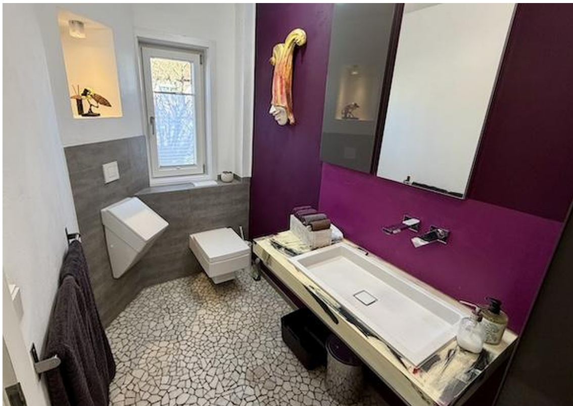
Gäste-WC im EG