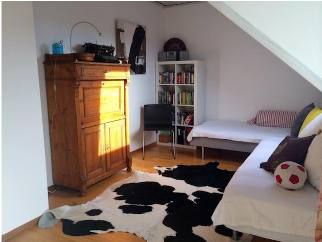
Schlafzimmer 1 im OG