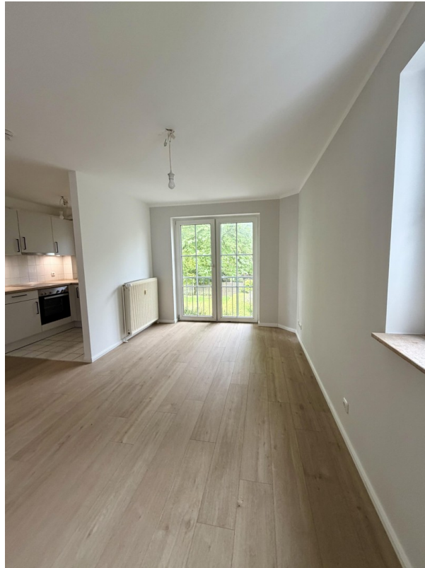
Wohnzimmer inkl. Küche