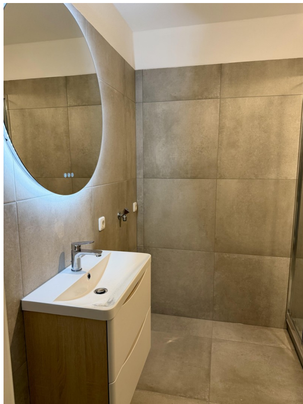
Waschtisch inkl. Spiegel