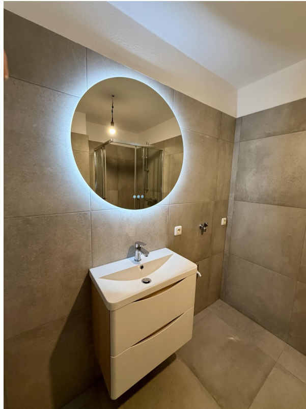
Waschtisch inkl. Spiegel