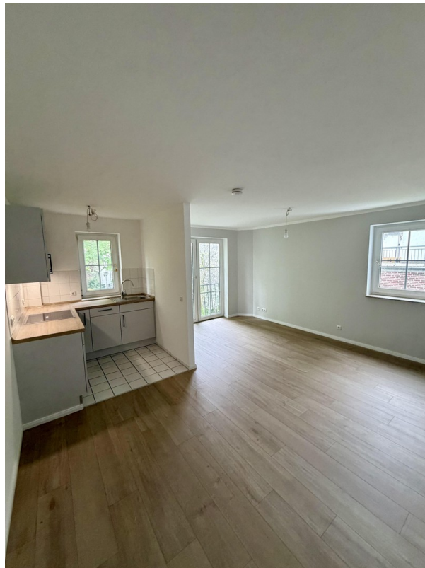
Wohnzimmer inkl. Küche