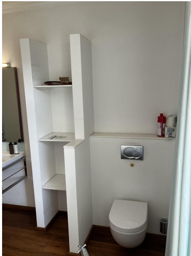
Detail Badezimmer 2