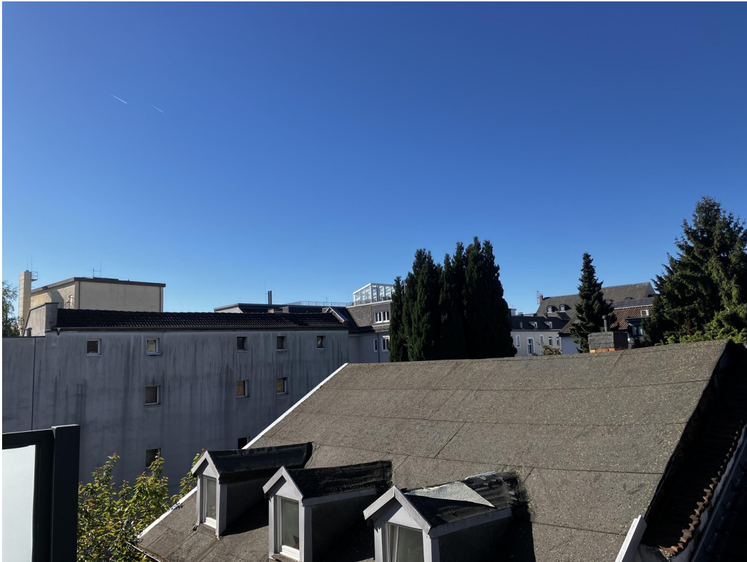
Blick vom Balkon 2