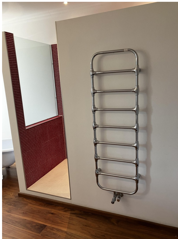
Detail Badezimmer 3