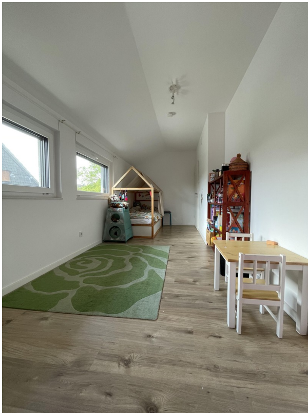
Kinderzimmer/ Schlafzimmer 2