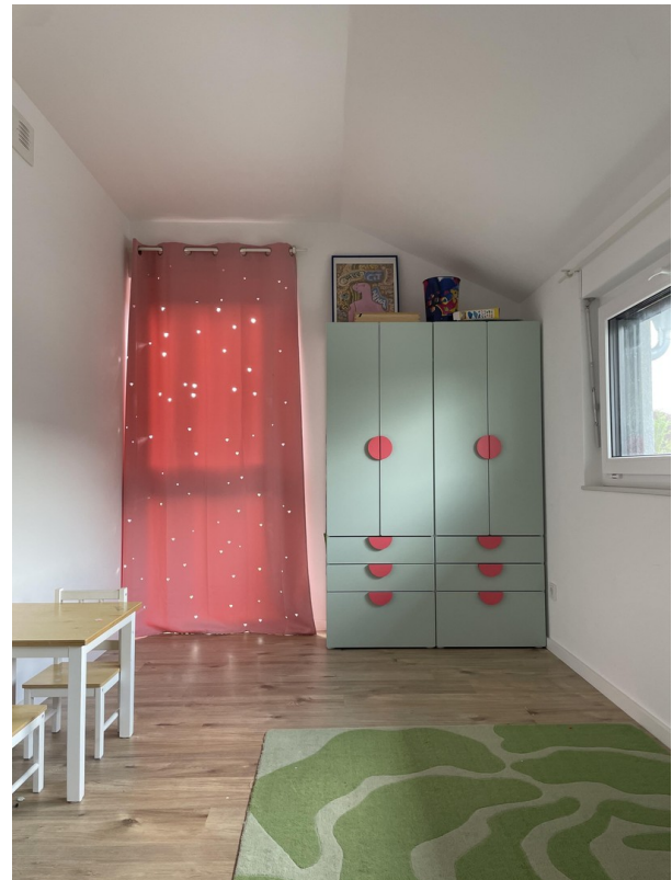
Kinderzimmer/ Schlafzimmer 2