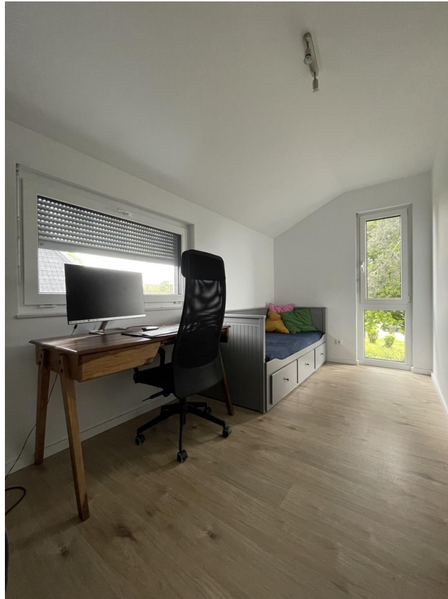
Büro / Schlafzimmer 3