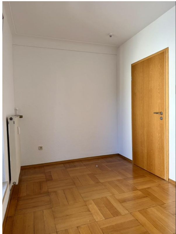
Schlaf- oder Arbeitszimmer