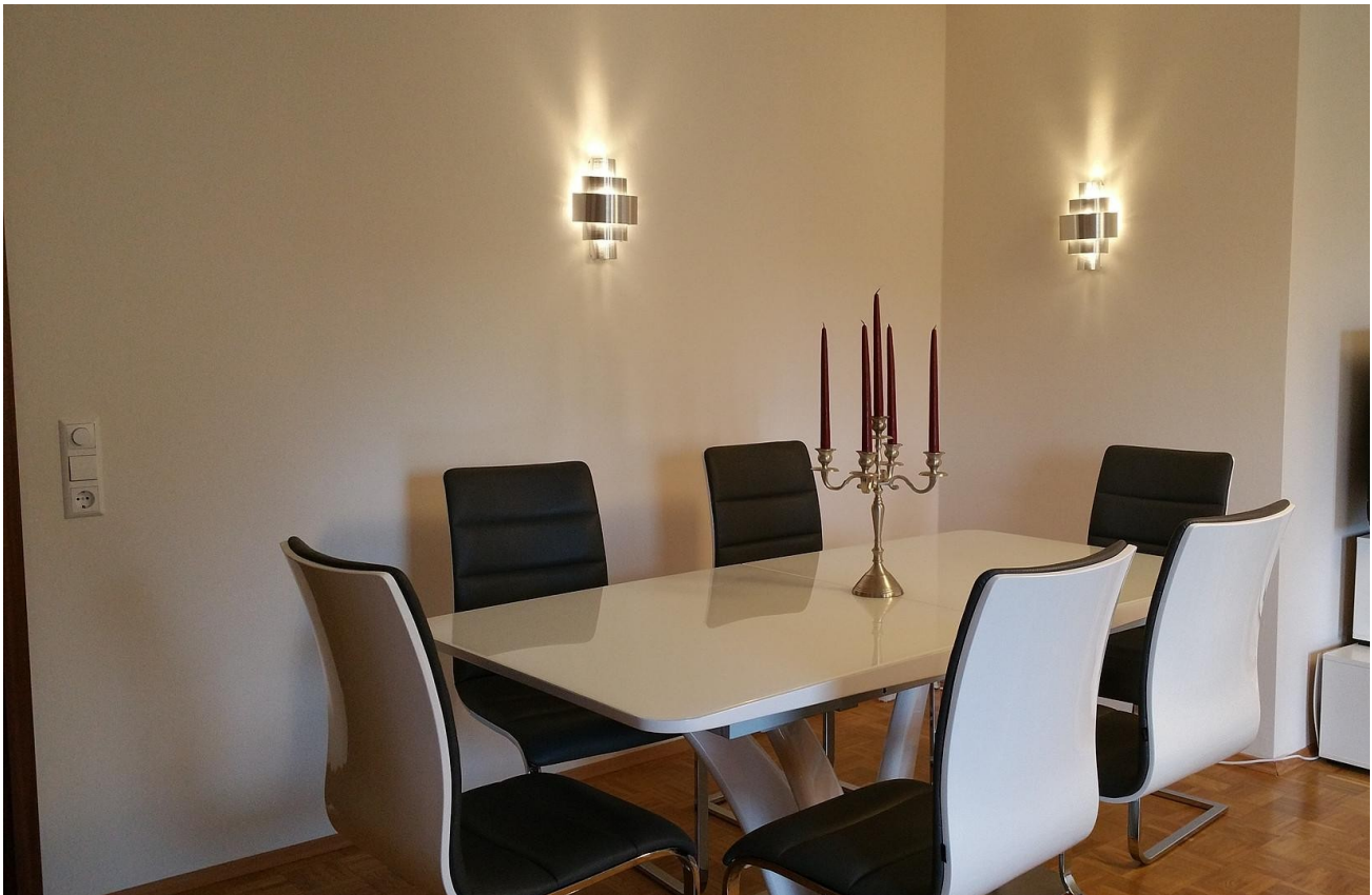
Wohnzimmer linke Seite