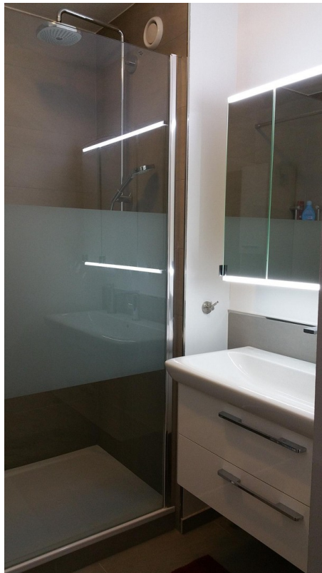
Dusche andere Sicht