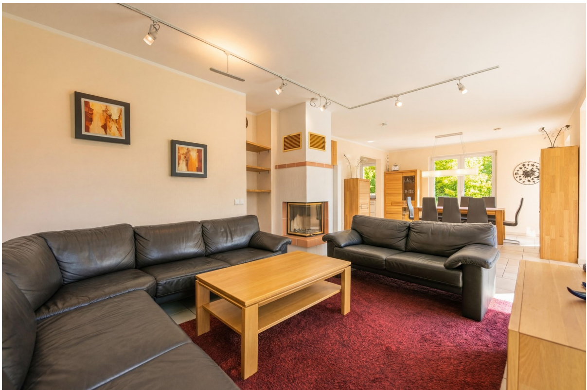
Wohnzimmer Blick auf Kamin