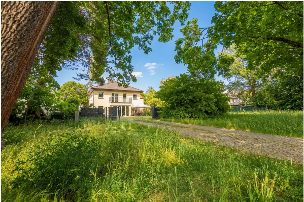
Blick von Straße