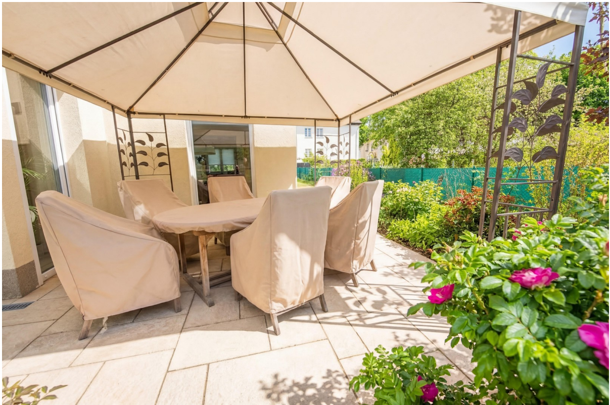
Terrasse vorn mit Bepflanzung