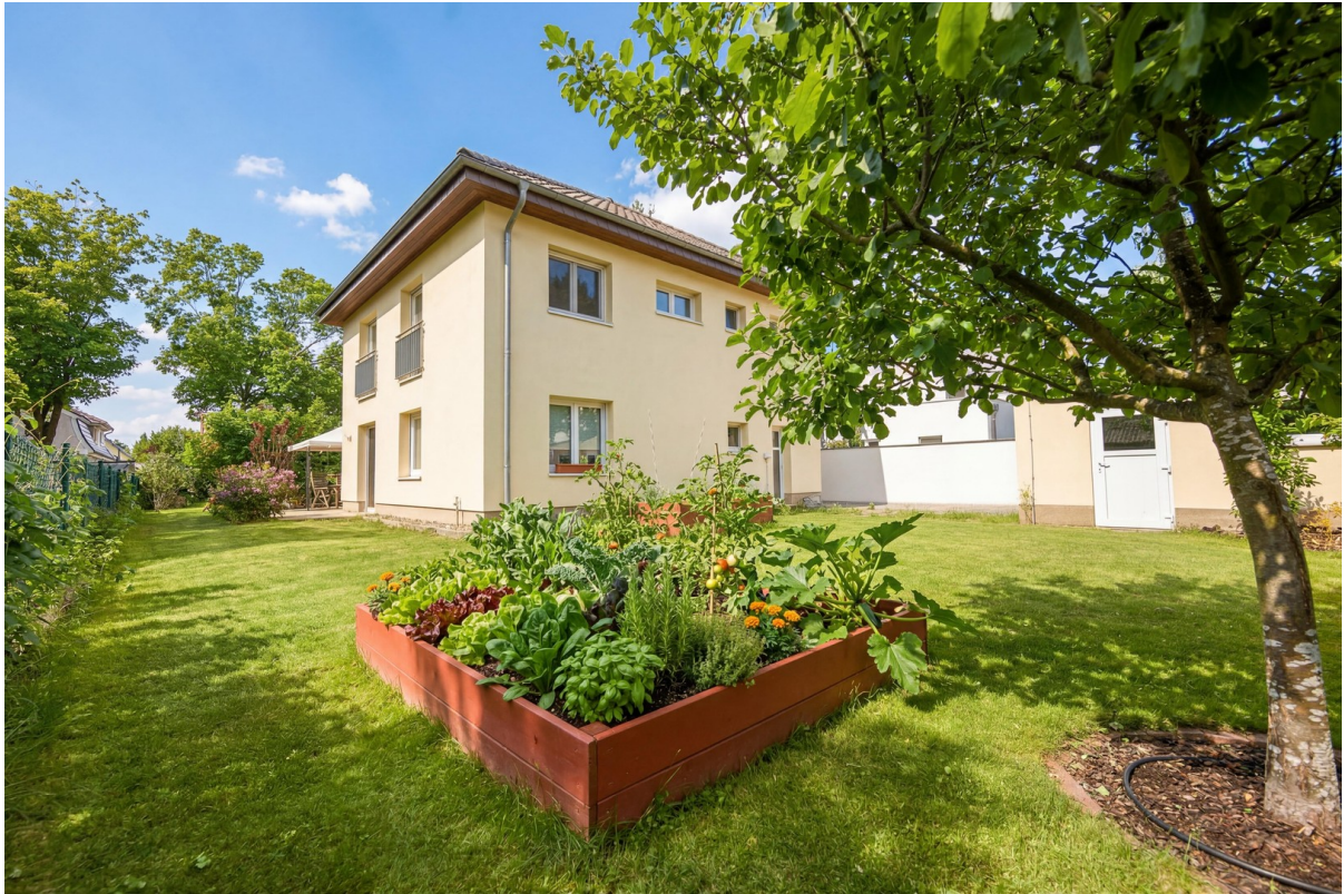
Rückseite Blick mit Garage