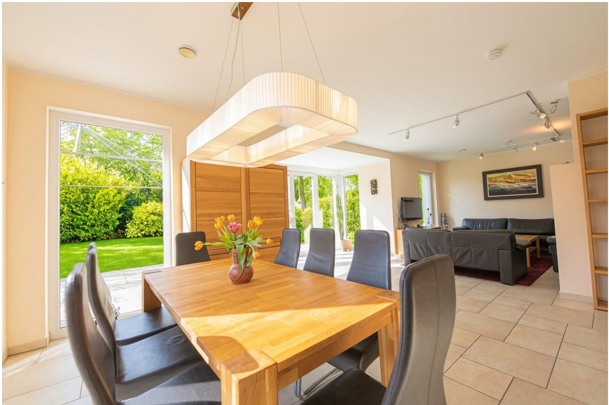
Wohnzimmer Blick nach draußen