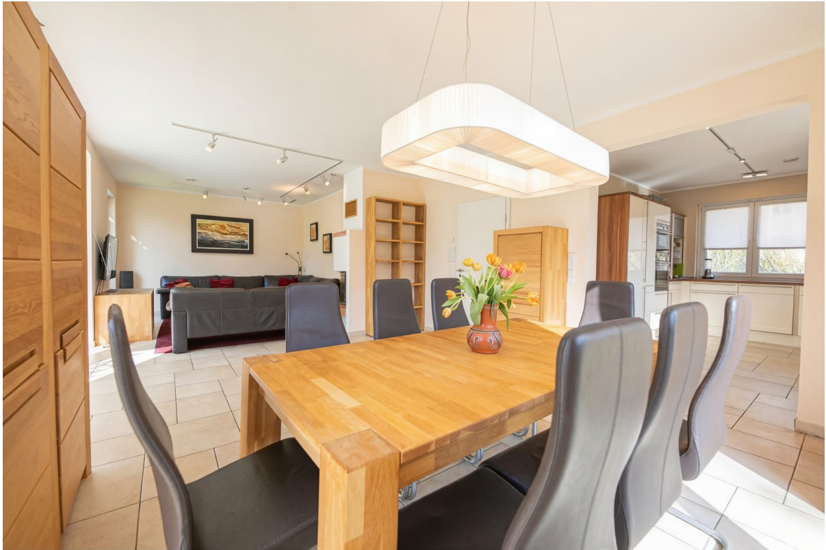
Wohnzimmer Blick zur Küche